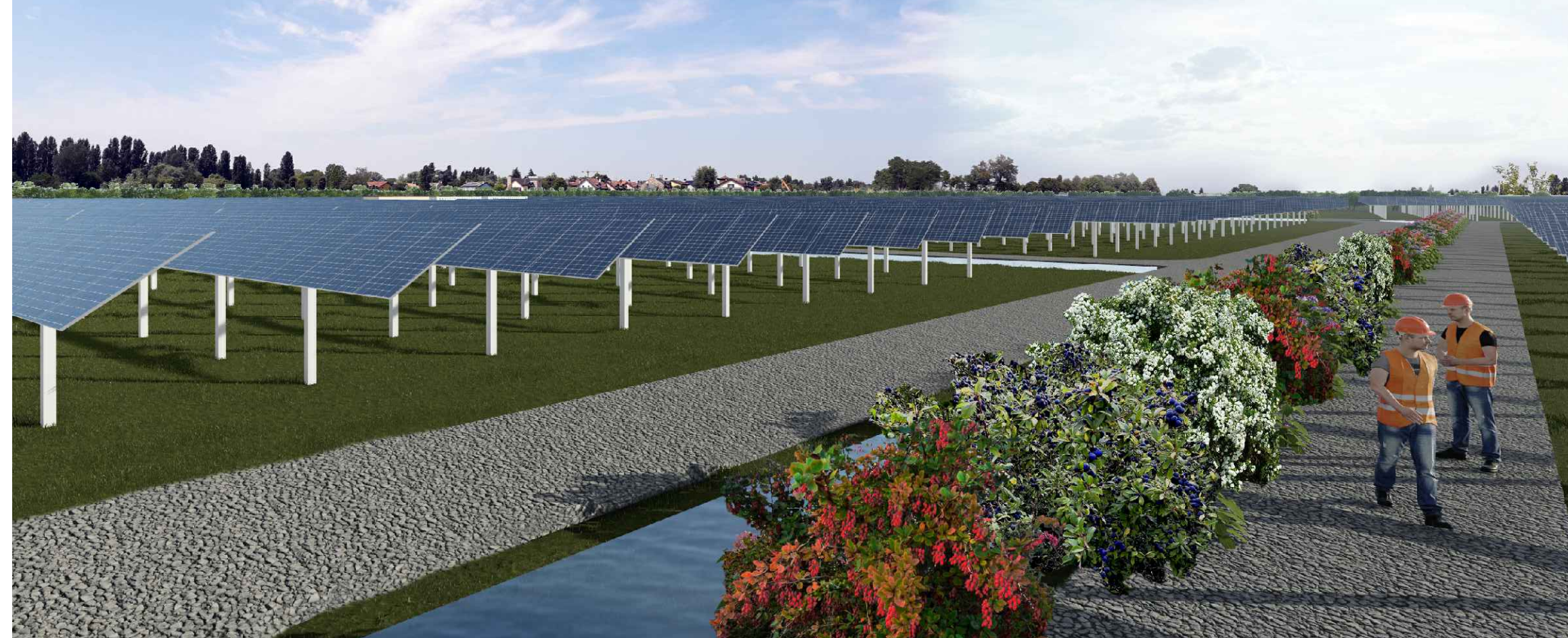
FOTO 2 - ANTE