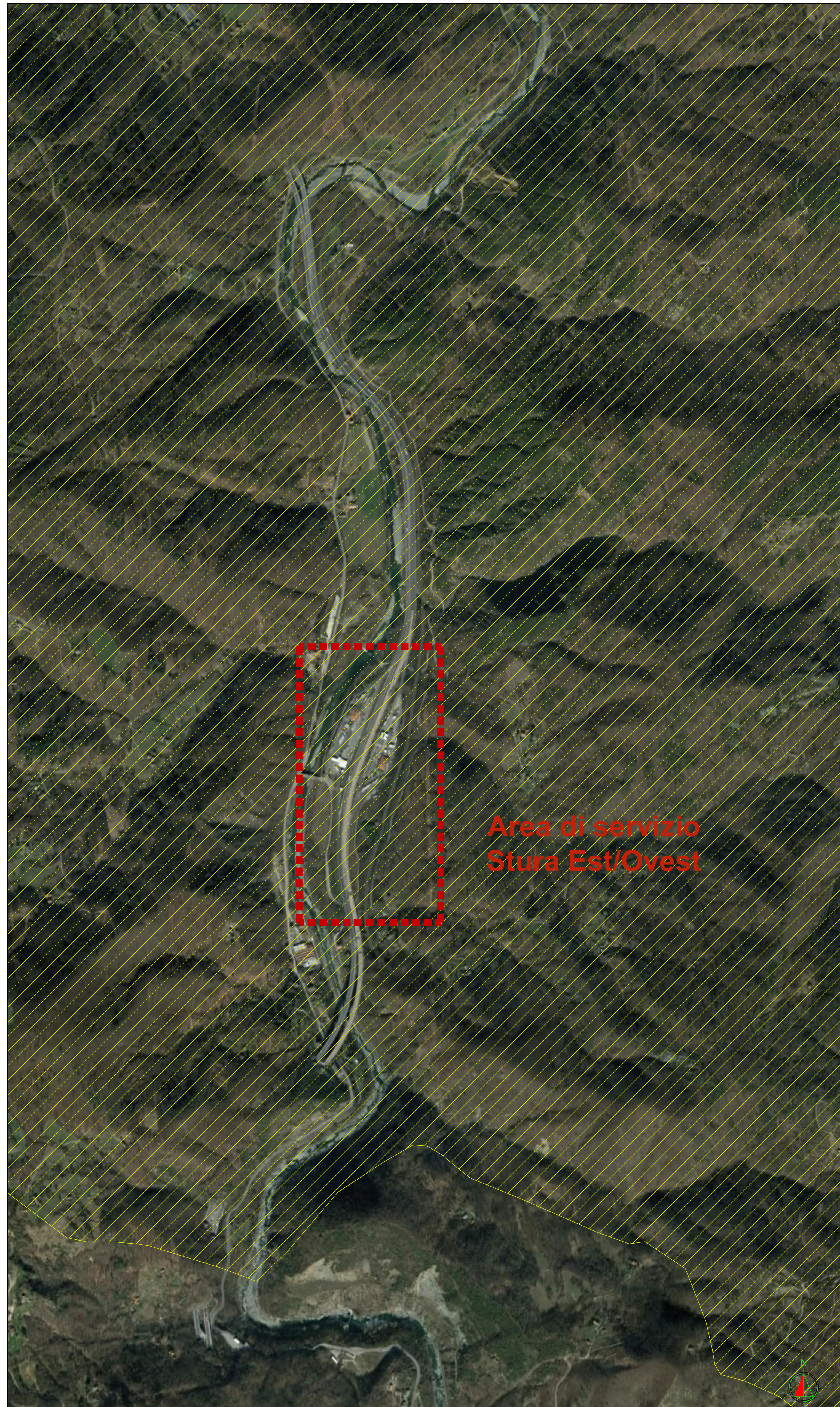
Classificazione sismica della Regione Piemonte - Comune - Belforte Monferrato Provincia - Alessandria