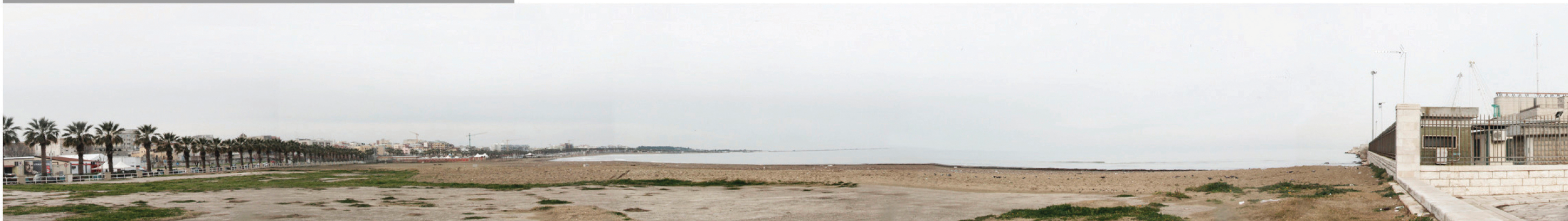
Stato di fatto