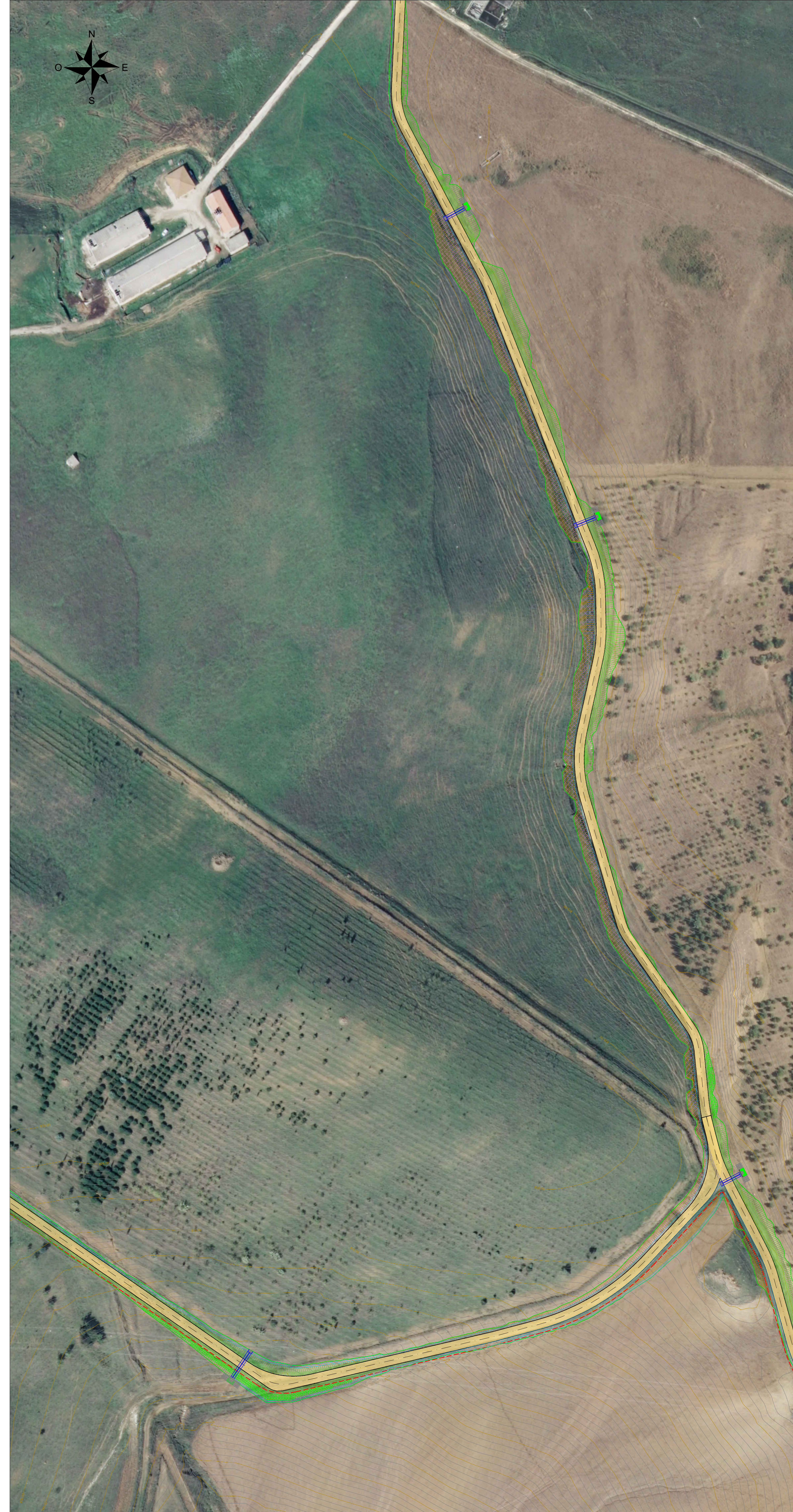
Vista B - Scala 1:1000