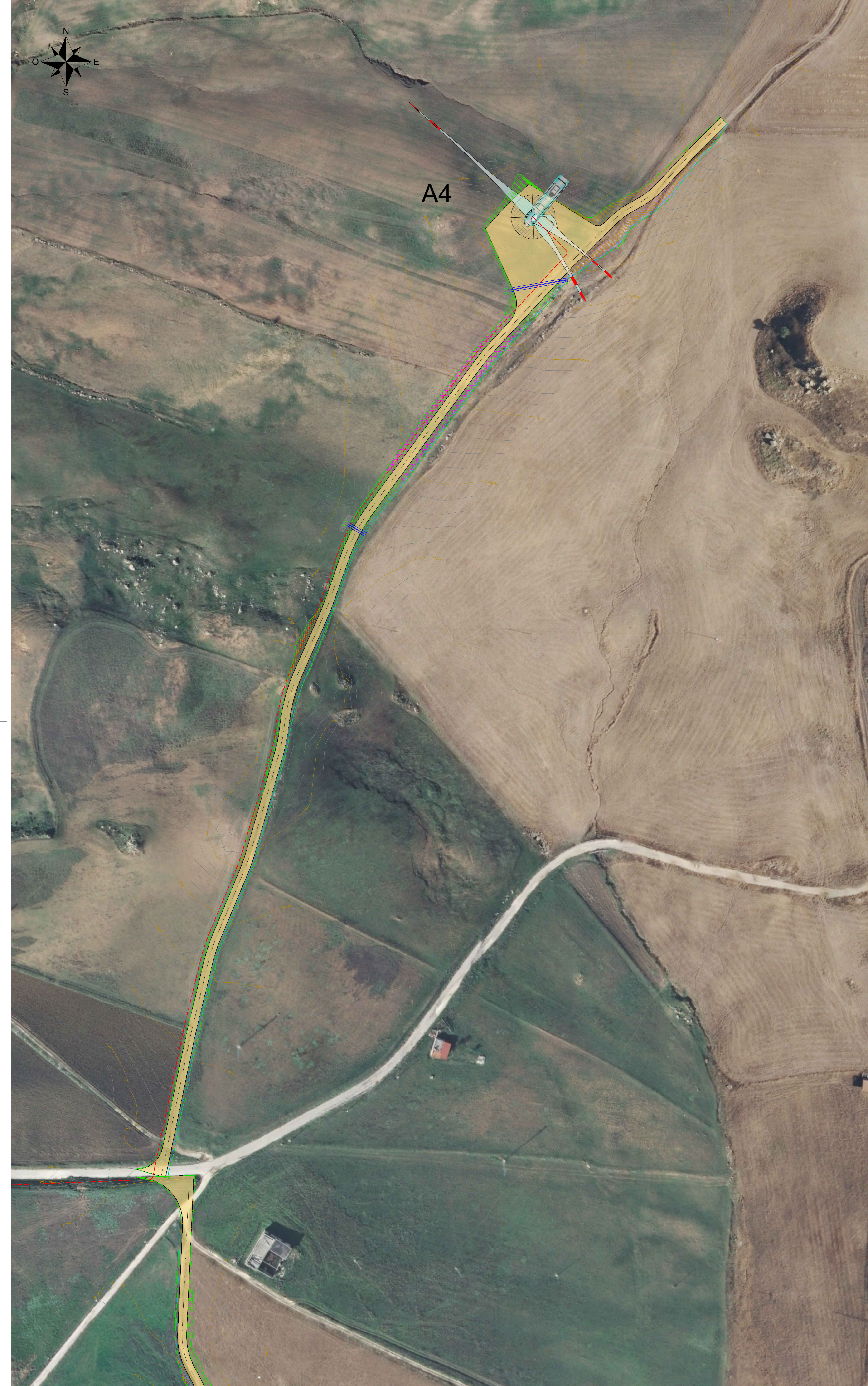
Vista A - Scala 1:1000