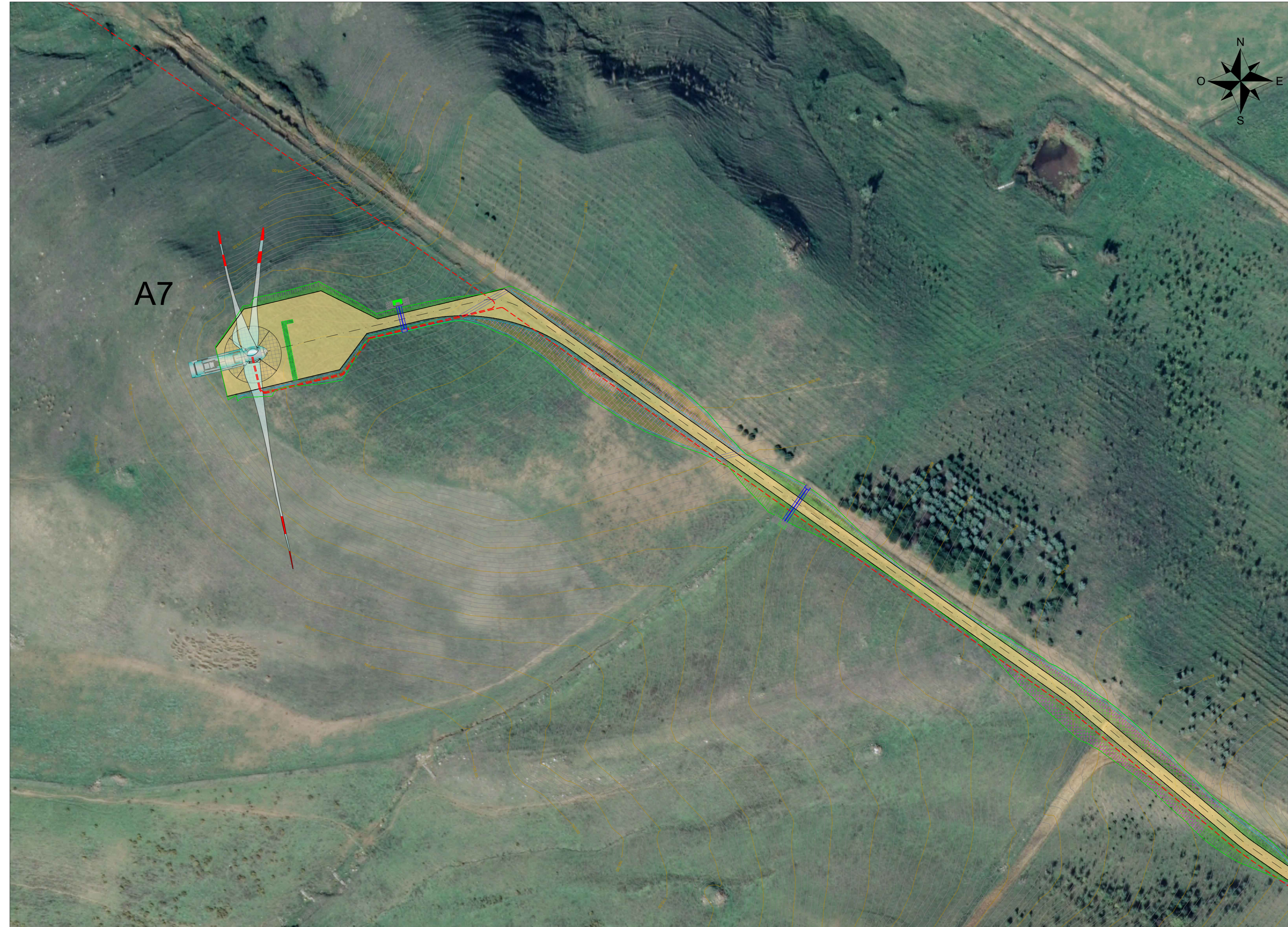
Vista F - Scala 1:1000