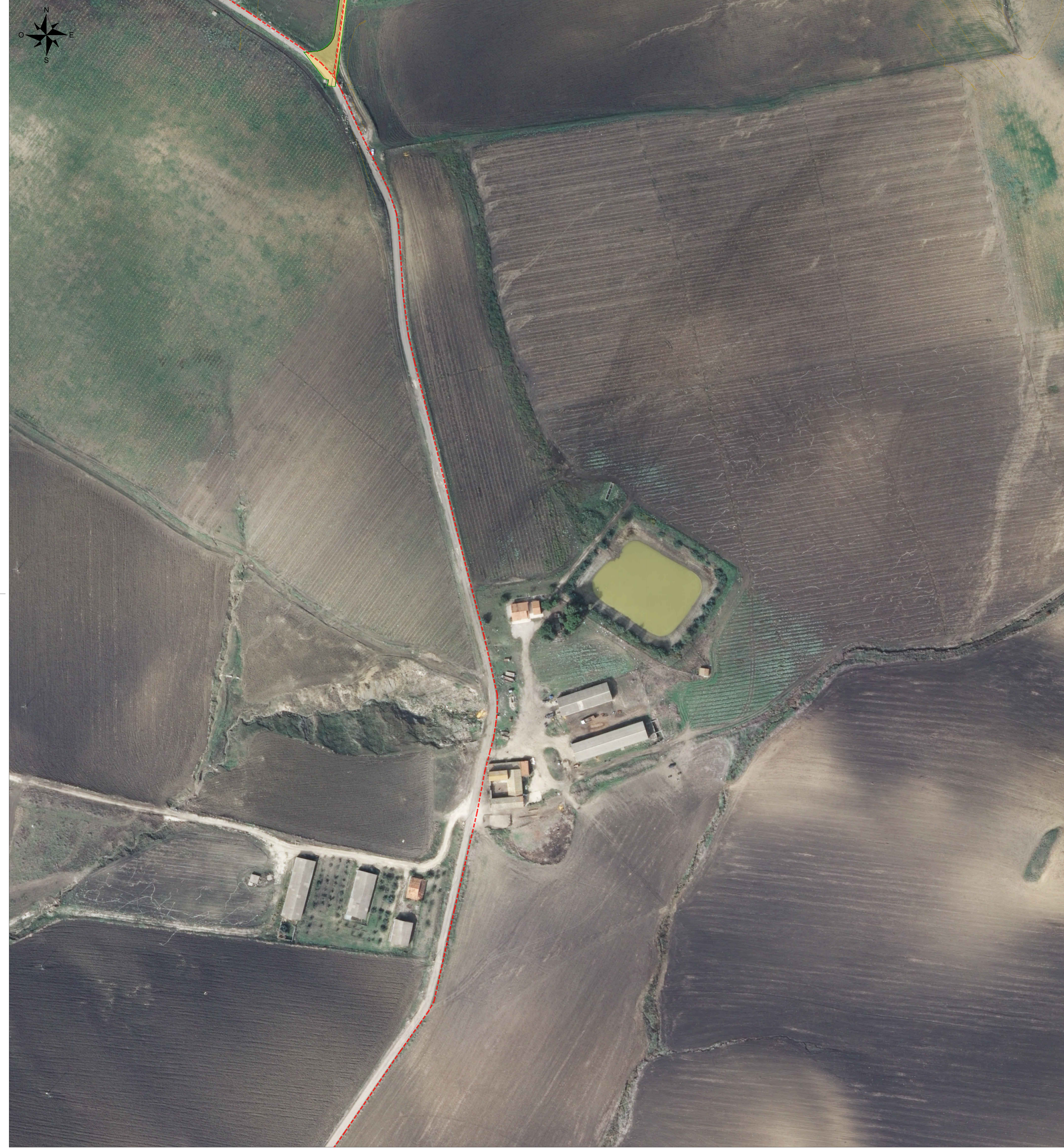
Vista T - Scala 1:1000