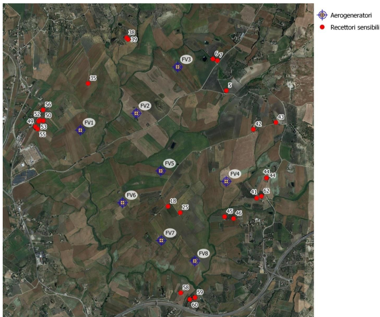
Figura 6-1 – Localizzazione aerogeneratori e ricettori su ortofoto