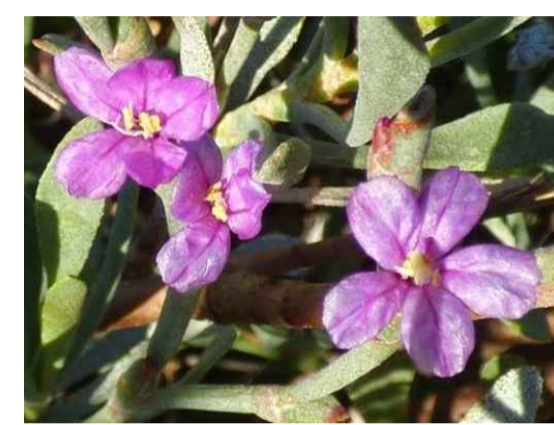
Lmn - Limoniastrum monopetalum