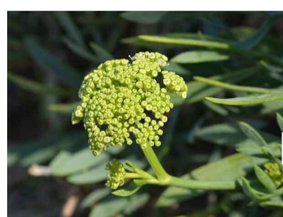
Cmr - Crithmum maritimum