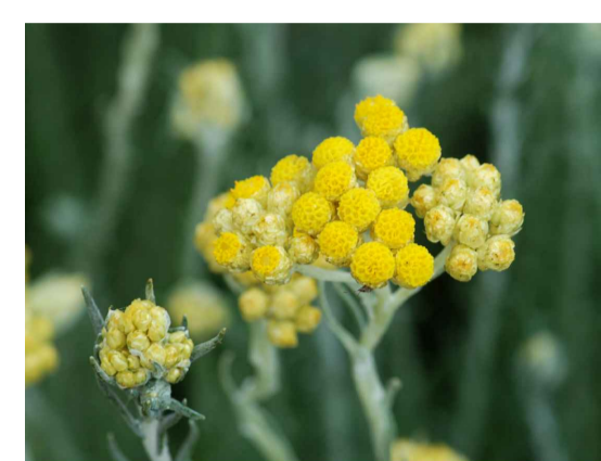
Hst - Helichrysum stoechas