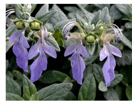
Tfr - Teucrium fruticans