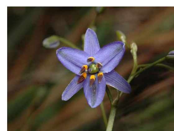
Dcr - Dianella caerulea