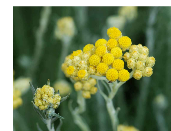
Hst - Helichrysum stoechas