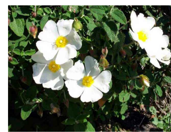
Csl - Cistus salviifolius