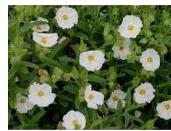
Cmn - Cistus monspeliensis