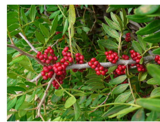
Pln - Pistacia lentiscus