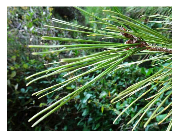
Phl - Pinus pinea