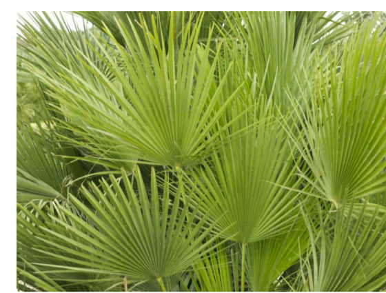
Chm - Chamaerops humilis