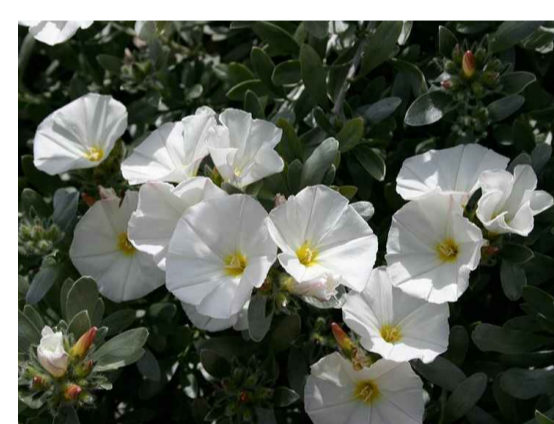
Ccn - Convolvulus cneorum