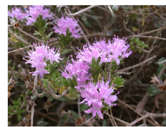
Tcp - Thymus capitatus