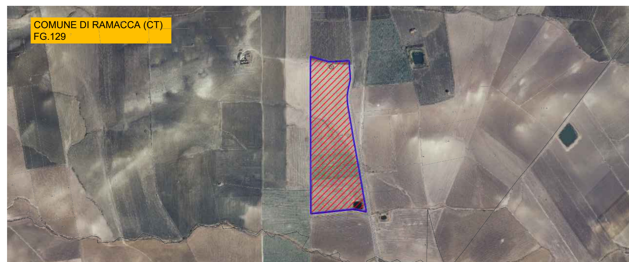
SOVRAPPOSIZIONE MAPPA CATASTALE - ORTOFOTO AREA D'INTERVENTO SCALA 1:10.000