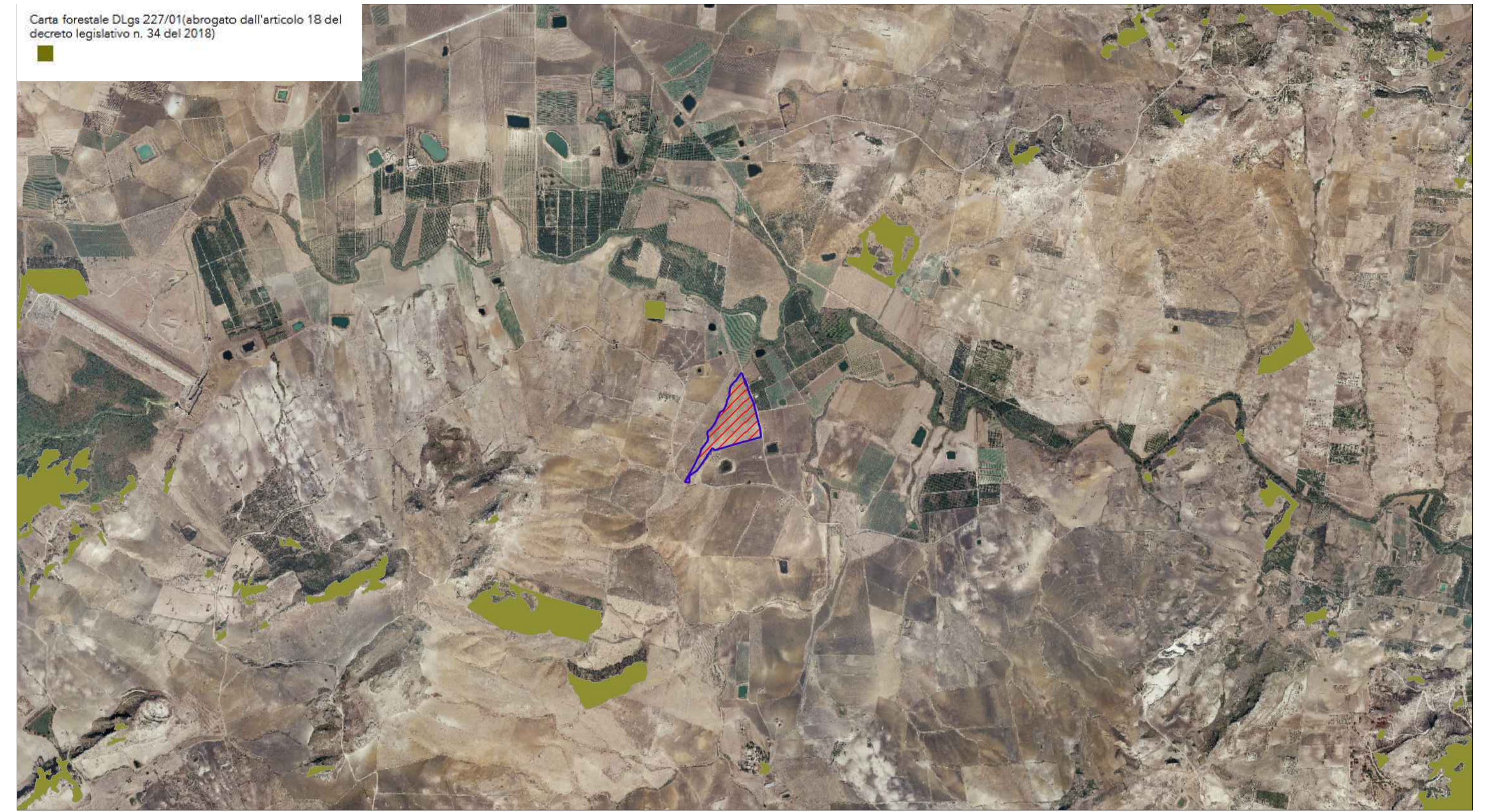
STRALCIO CARTA FORESTALE D. LGS. 227/01 SCALA 1:25.000

Carta forestale DLgs 227/01 (abrogato dall'articolo 18 del decreto legislativo n. 34 del 2018)