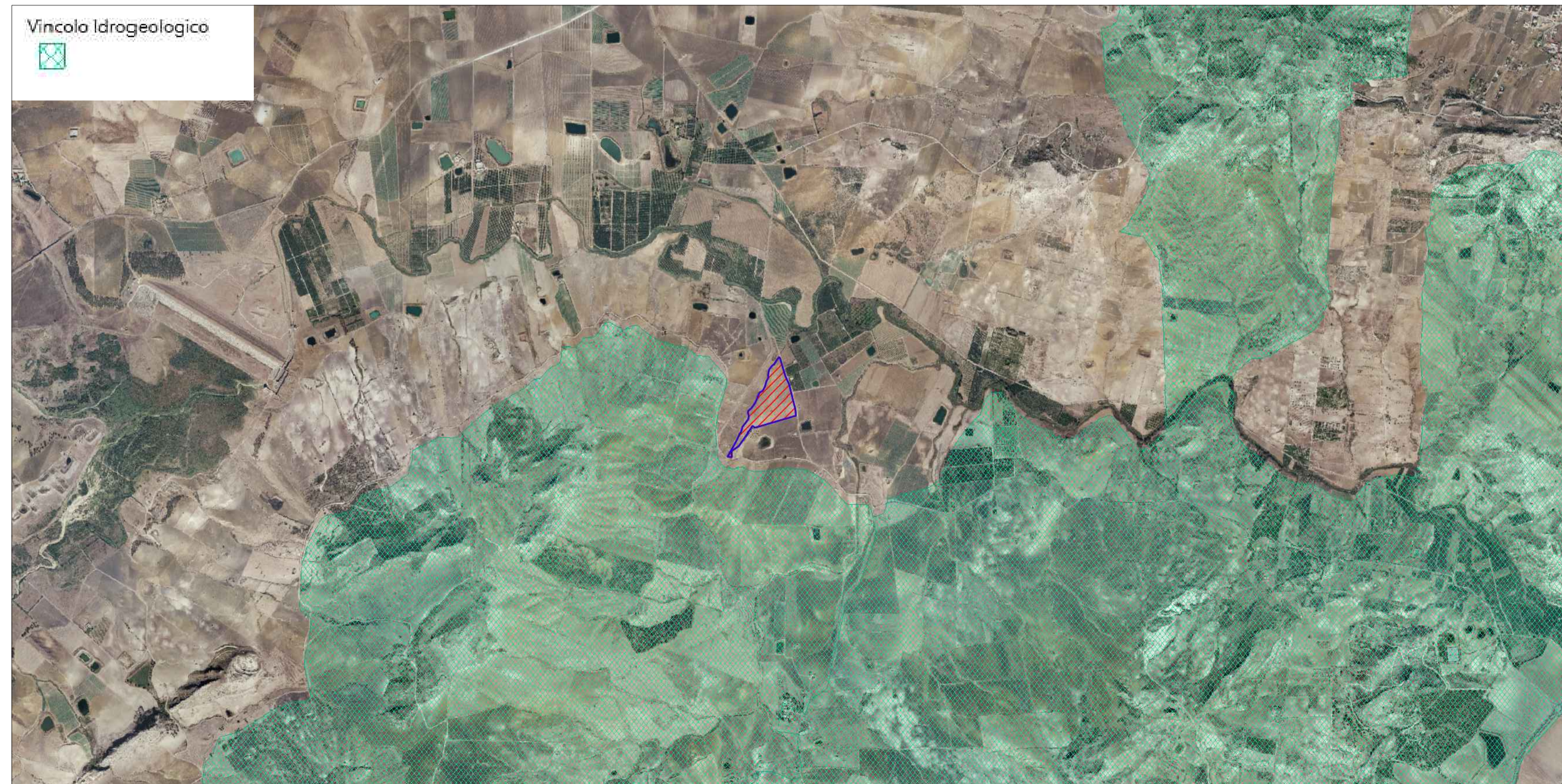
STRALCIO MAPPA VINCOLO IDROGEOLOGICO SCALA 1:25.000