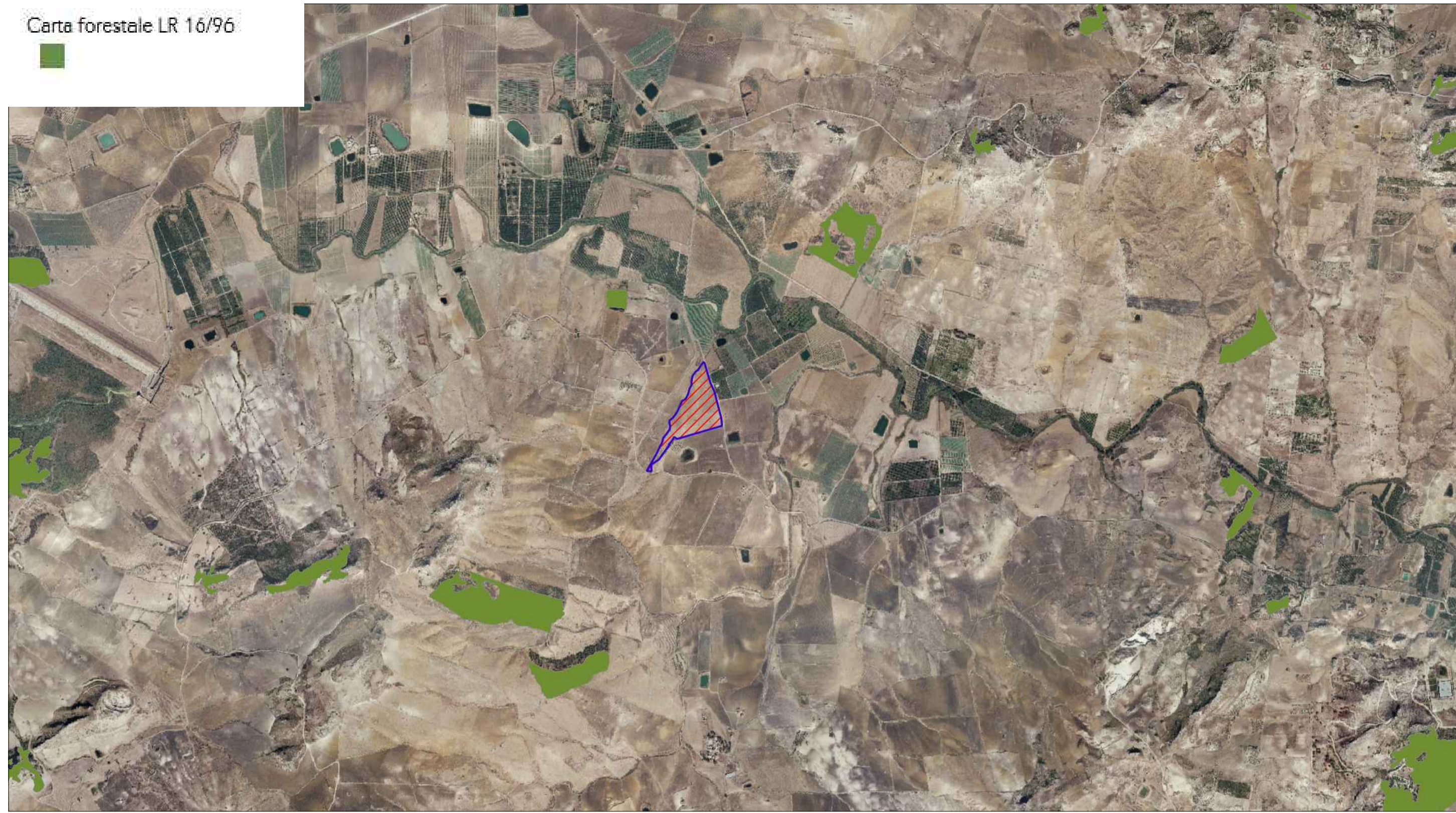
STRALCIO CARTA FORESTALE L.R. 16/96 SCALA 1:25.000

Carta forestale DLgs 227/01 (abrogato dall'articolo 18 del decreto legislativo n. 34 del 2018)