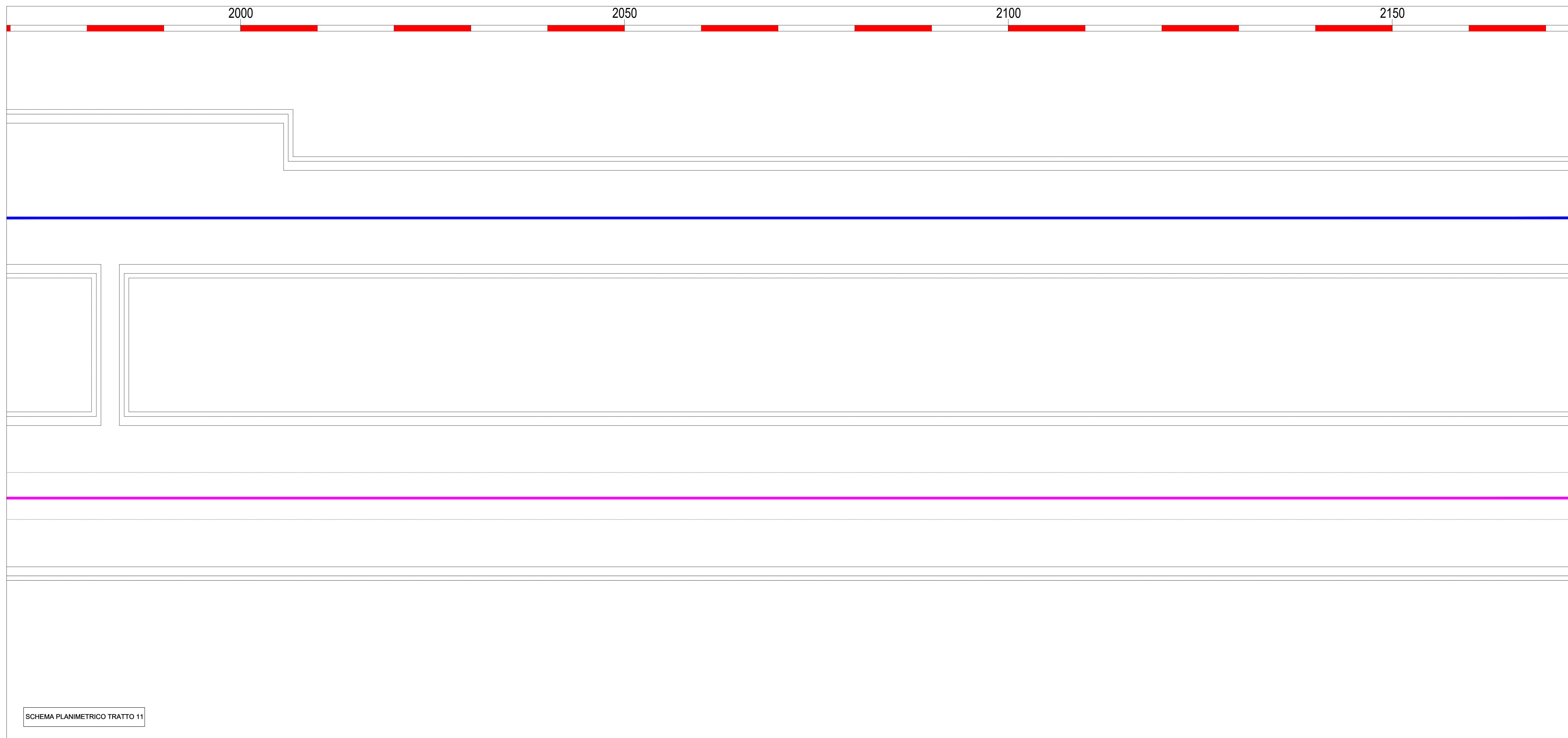
SCHEMA PLANIMETRICO TRATTO 11