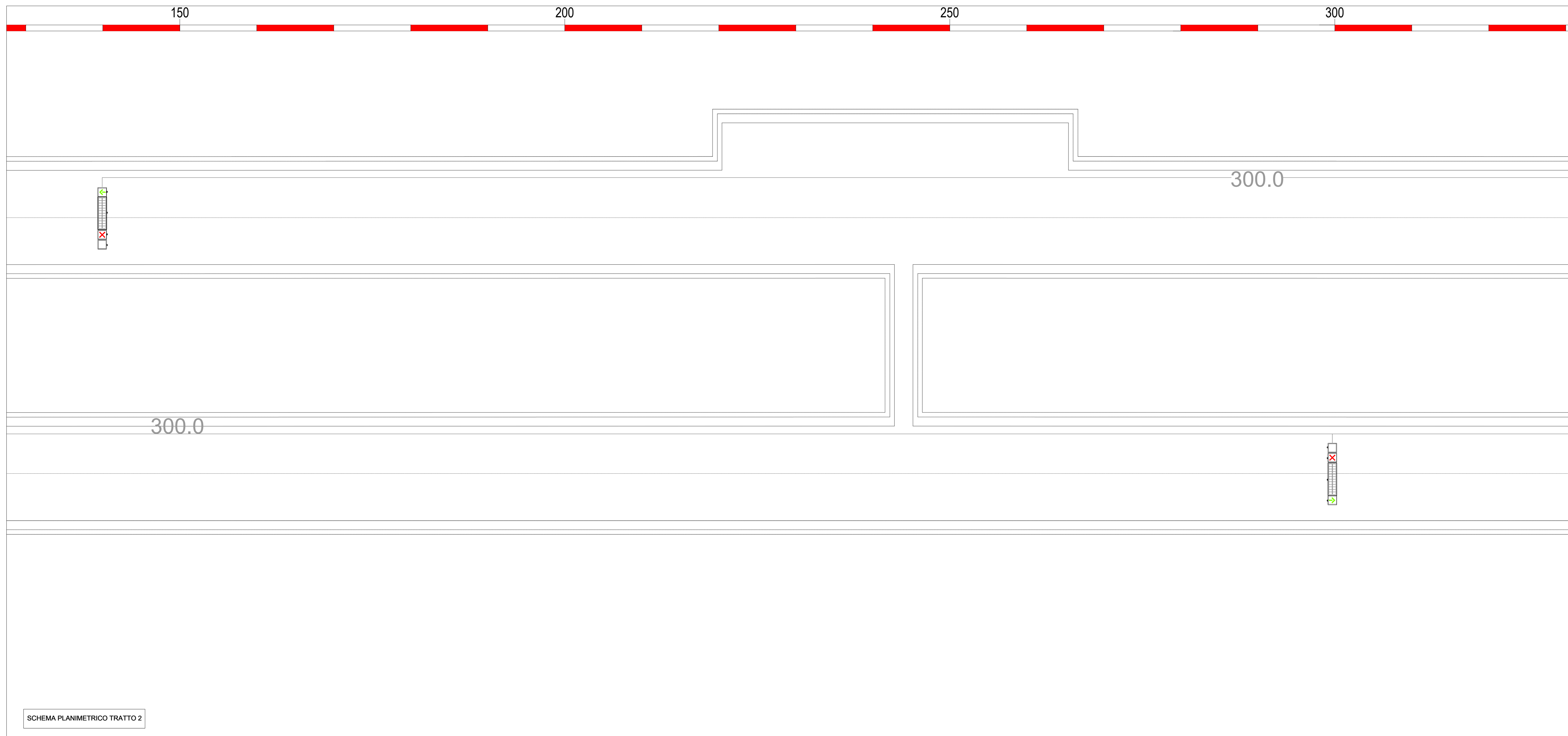
SCHEMA PLANIMETRICO TRATTO 2