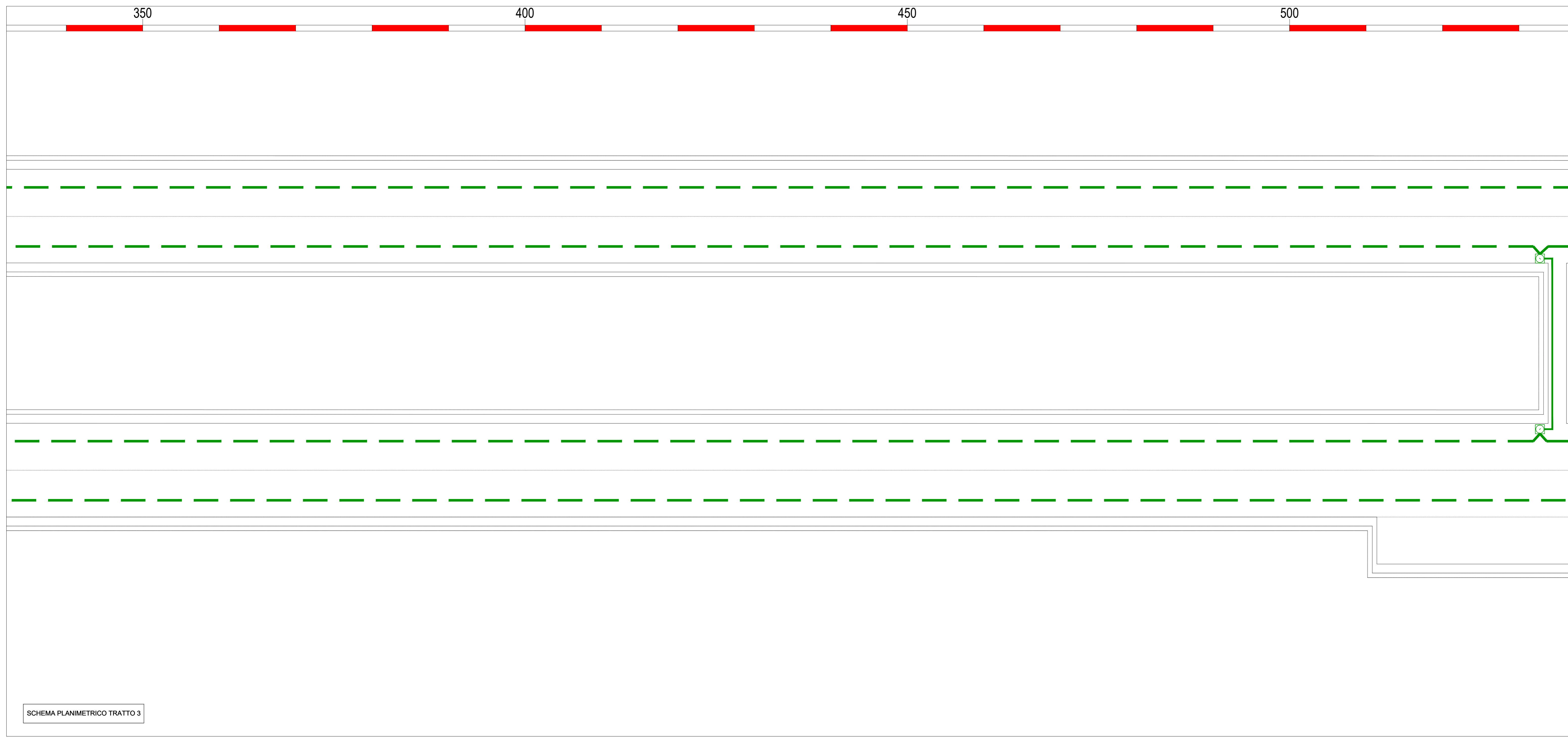
SCHEMA PLANIMETRICO TRATTO 3