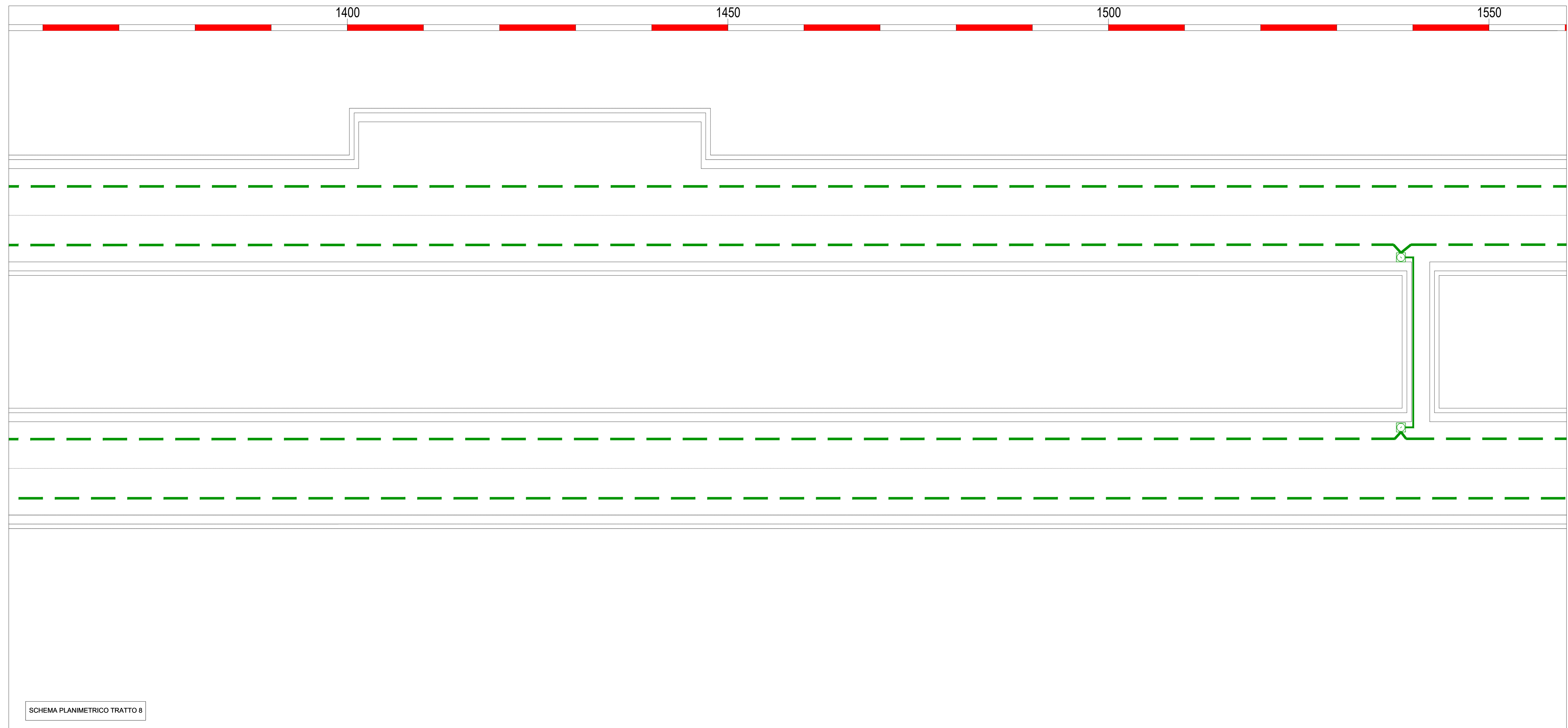
SCHEMA PLANIMETRICO TRATTO 8