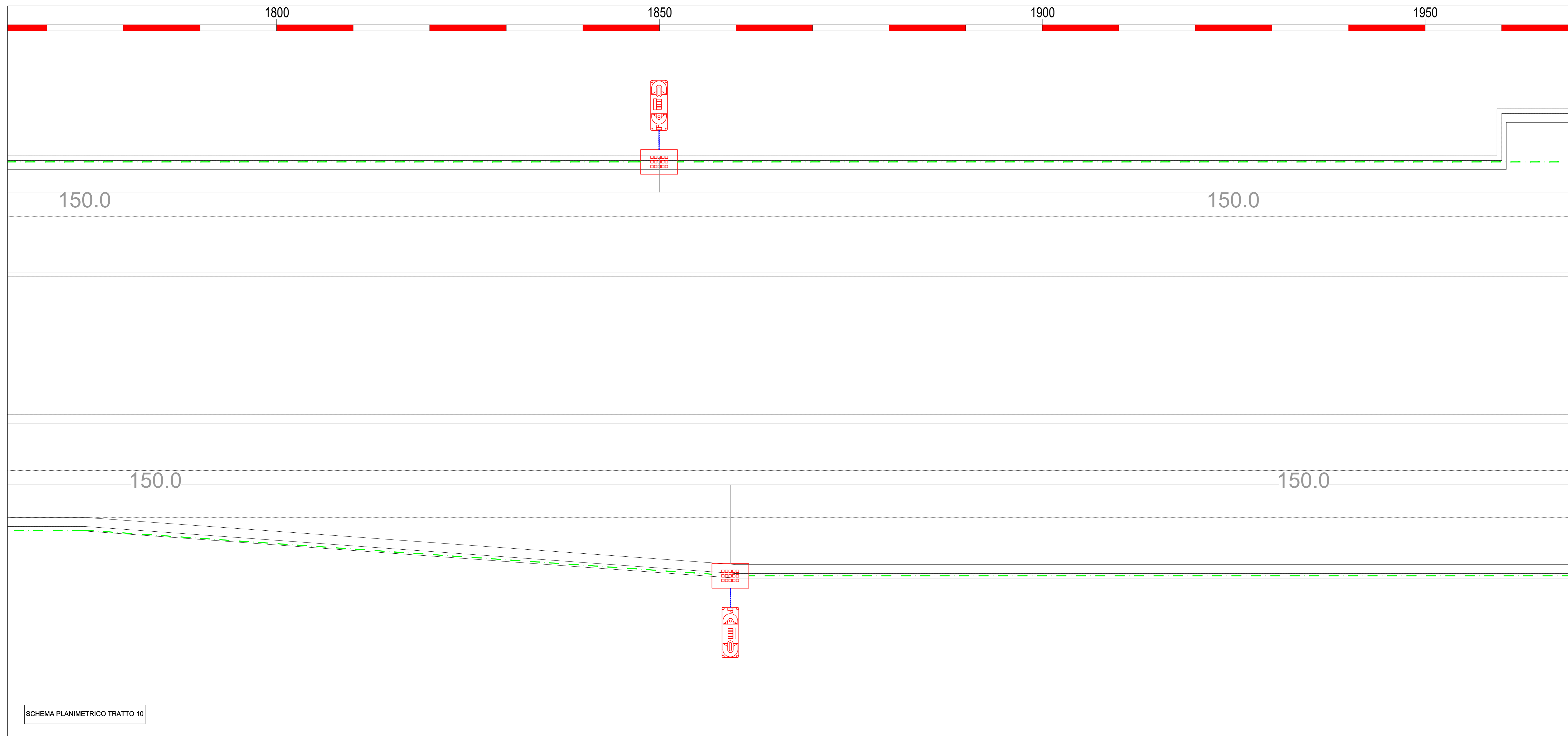
SCHEMA PLANIMETRICO TRATTO 10