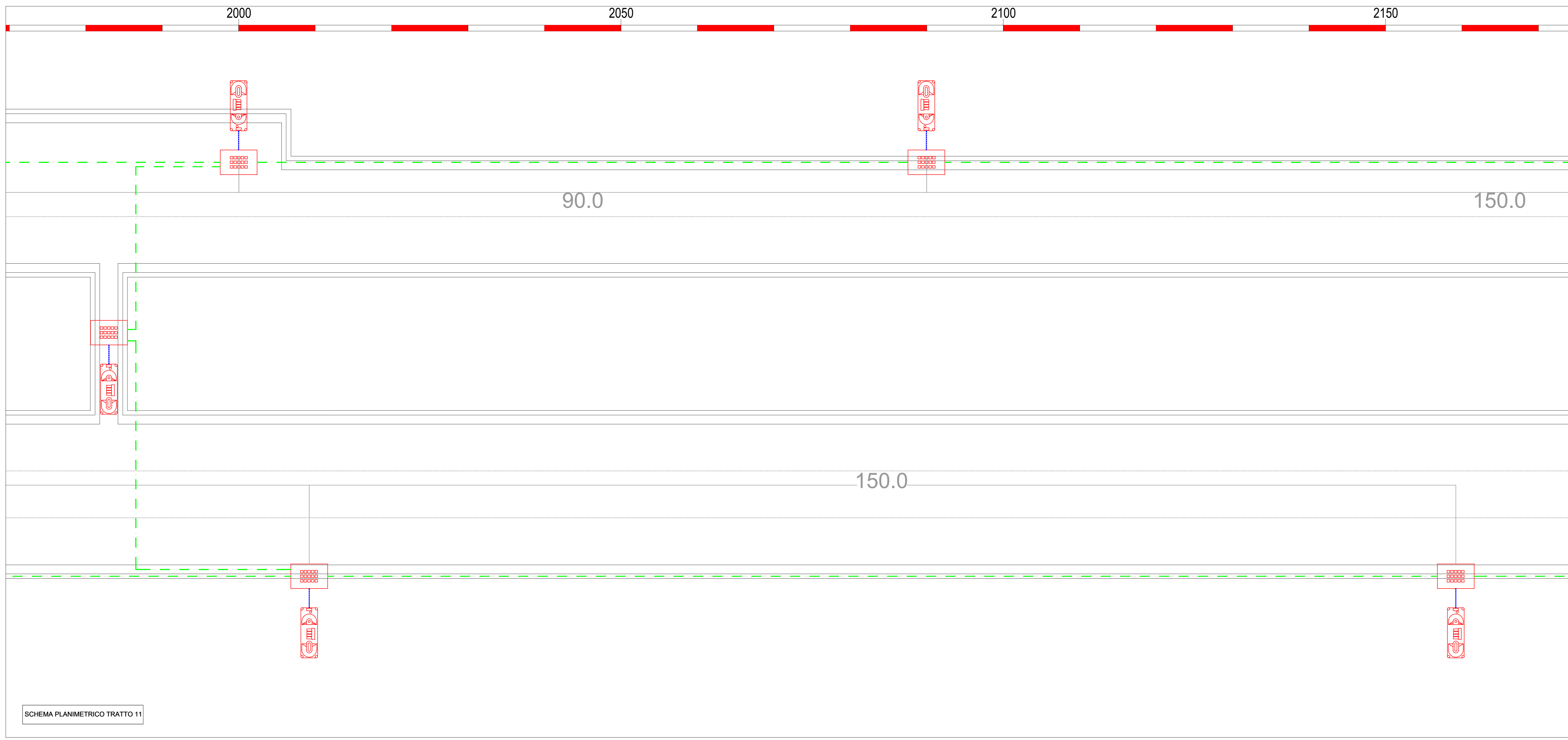
SCHEMA PLANIMETRICO TRATTO 11