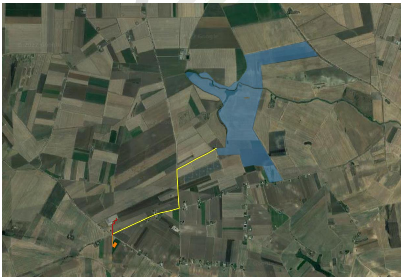
Fig. 1-1: Localizzazione area di intervento, in blu la perimetrazione del sito, in giallo il tracciato della connessione

Le opere di rete interessano anche l'agro di Ascoli Satriano (FG) in considerazione della posizione della Stazione Elettrica di Smistamento a 150 kV denominata "Valle" , di cui uno stallo del futuro ampliamento è stato indicato dal gestore come punto di connessione dell'impianto.