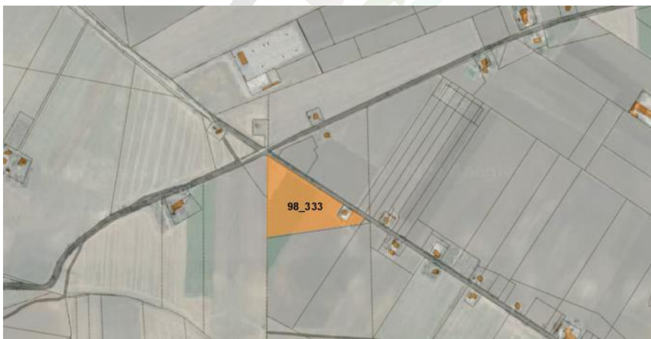
Fig. 1-3: Localizzazione area SSEU su ortofoto catastale, in arancio la perimetrazione dell'Area