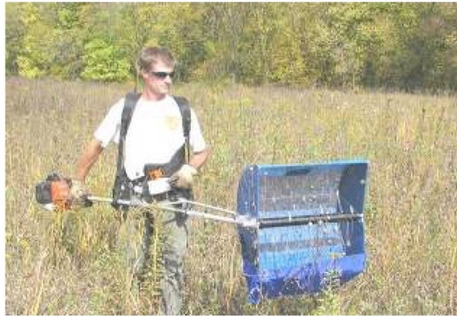
Figura 3 - Esempio di macchina spazzolatrice a spalla

specie perenni a maturazione più tardiva (agosto-settembre). In entrambi i casi, la finestra temporale più adatta va stabilita in campo e durante la direzione dei lavori.