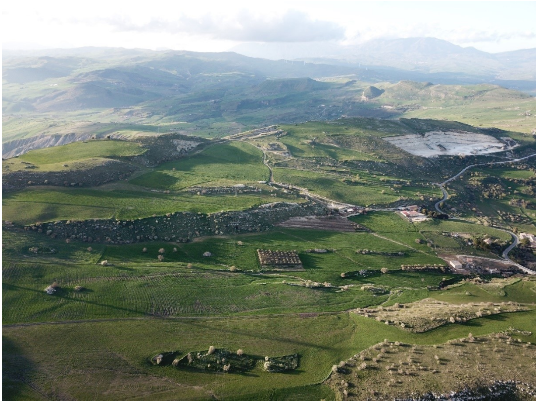
Figura 4 - foto ante operam area di impianto