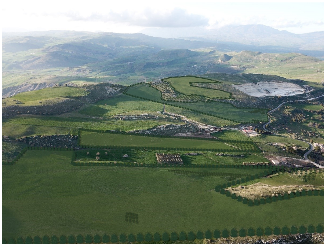
Figura 5 - Simulazione post dismissione impianto.