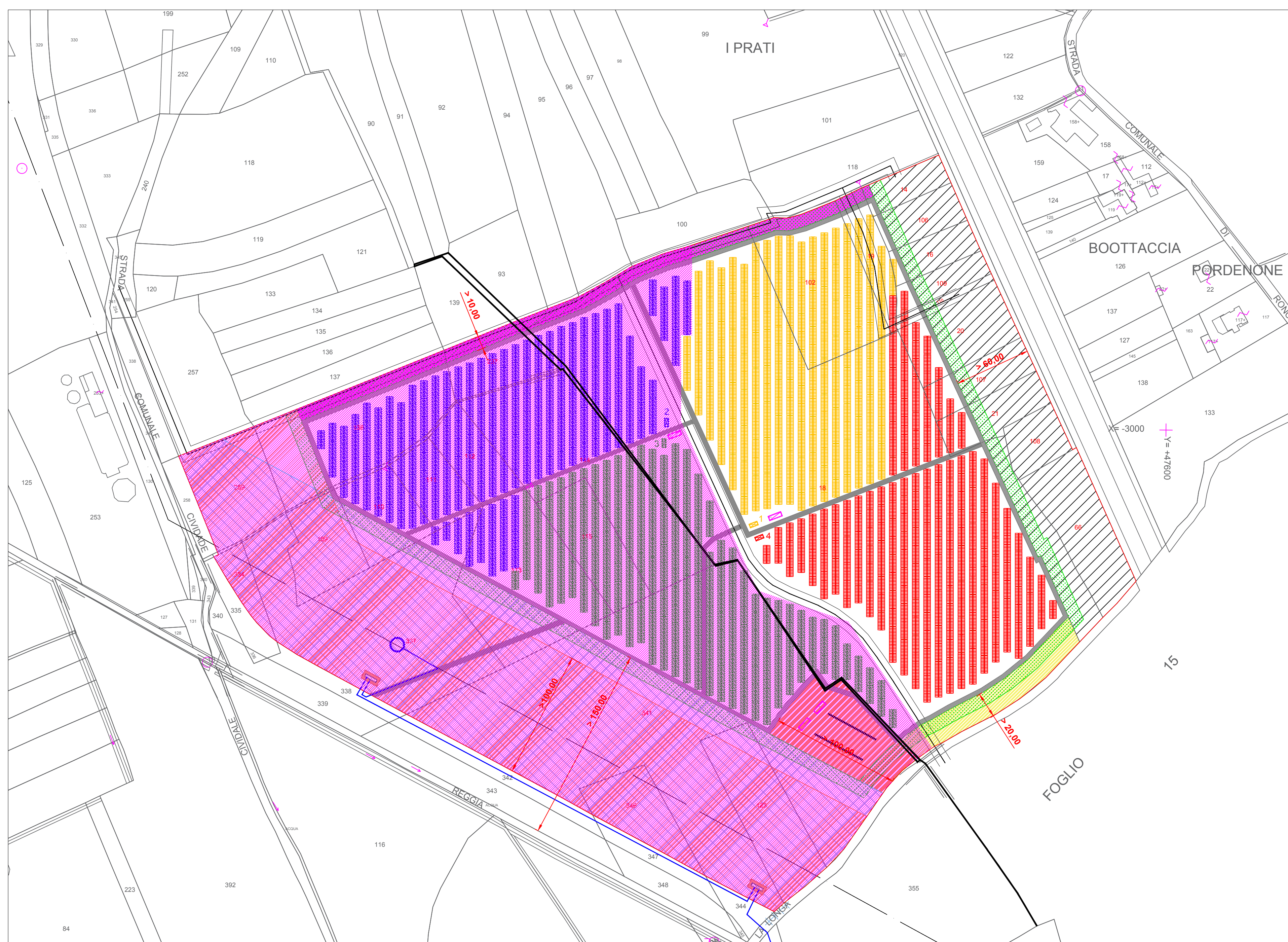
PLANIMETRIA CAMPO AGRIVOLTAICO E VINCOLI " BICINICCO 2" - Scala 1:2.000