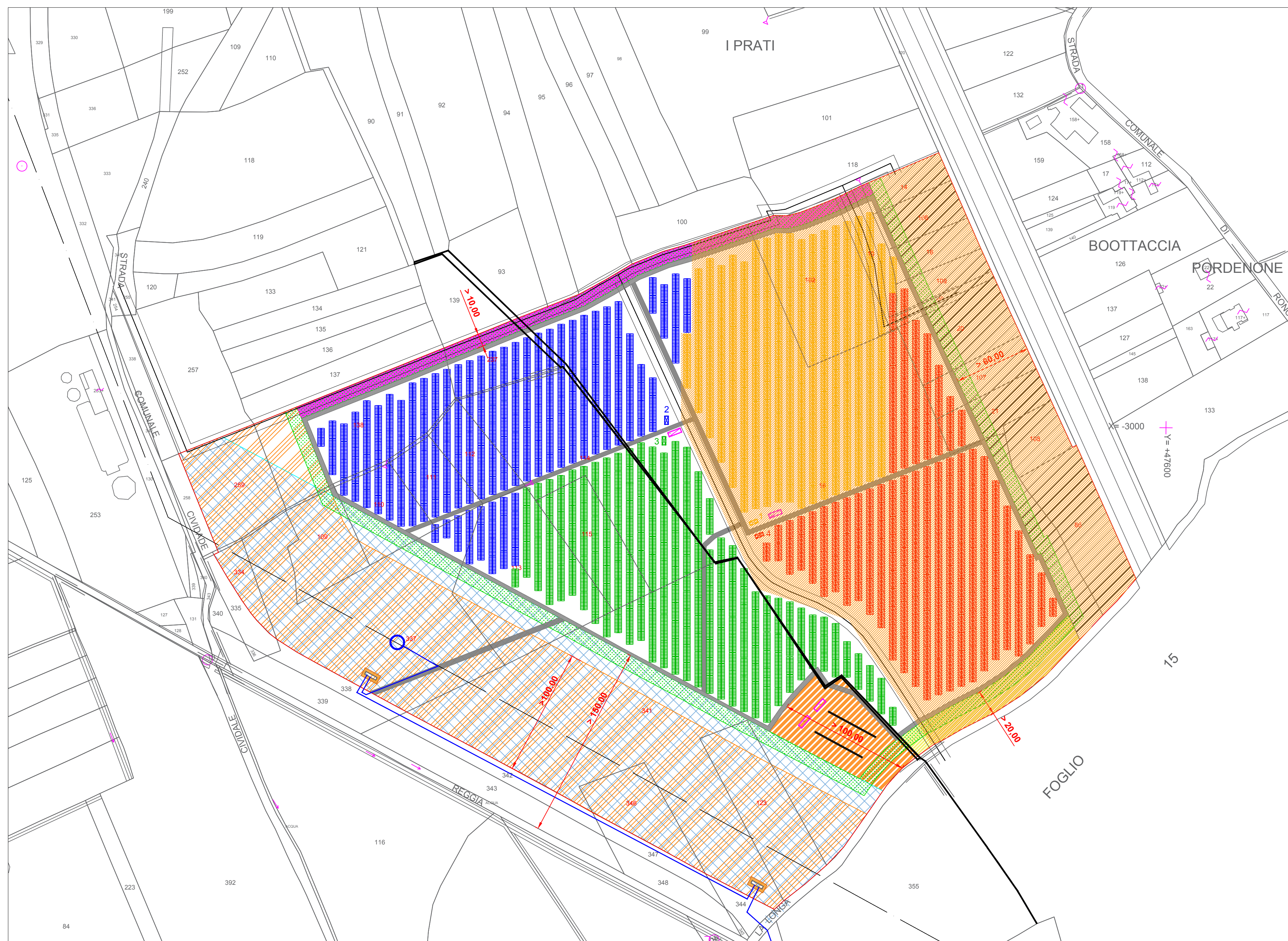
PLANIMETRIA CAMPO AGRIVOLTAICO E VINCOLI " BICINICCO 1" - Scala 1:2.000