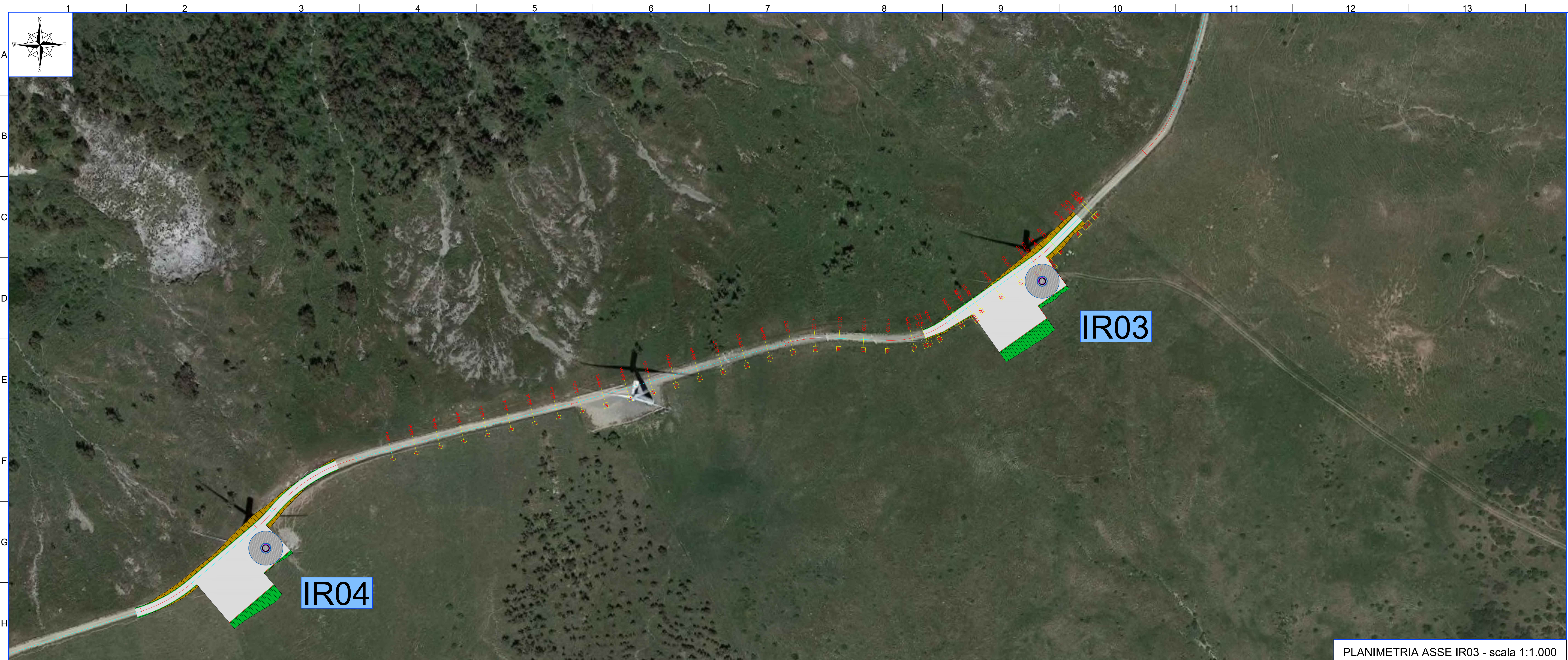
PLANIMETRIA ASSE IR03 - scala 1:1.000