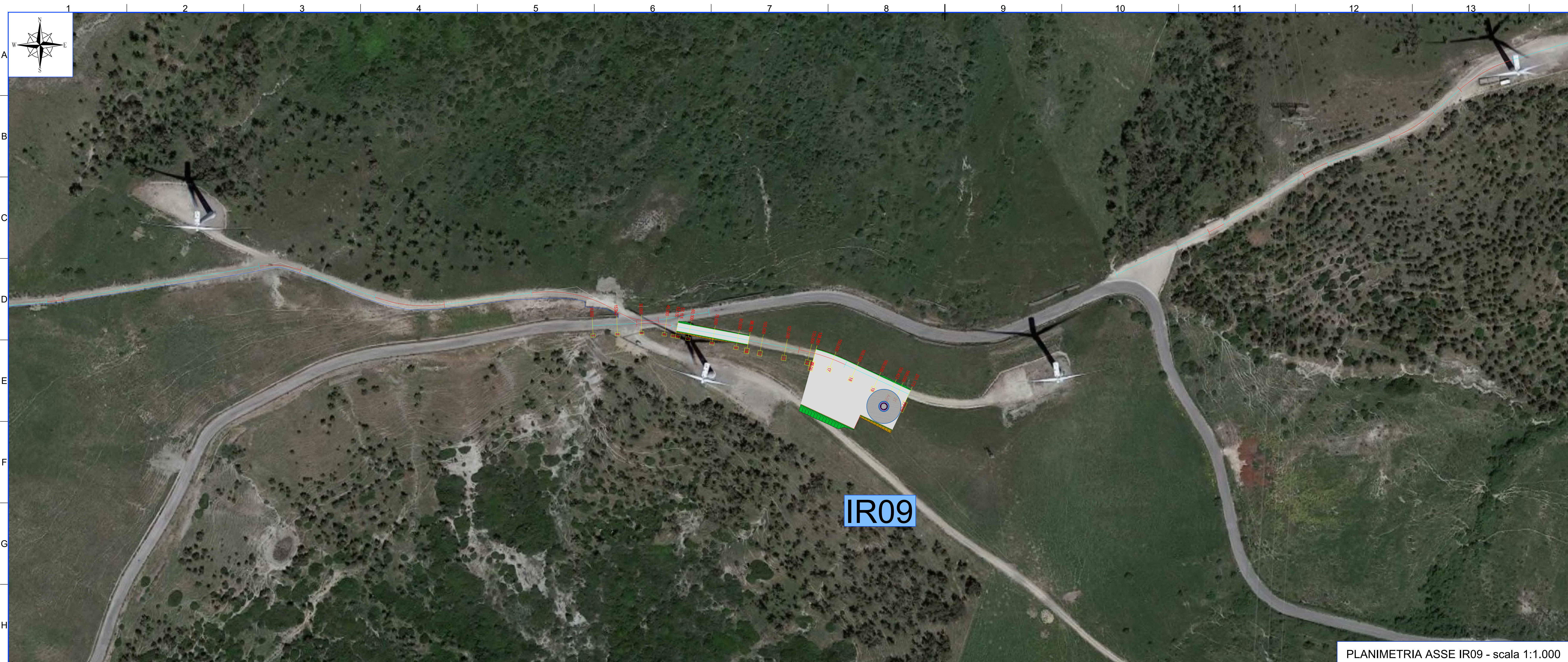
PLANIMETRIA ASSE IR09 - scala 1:1.000