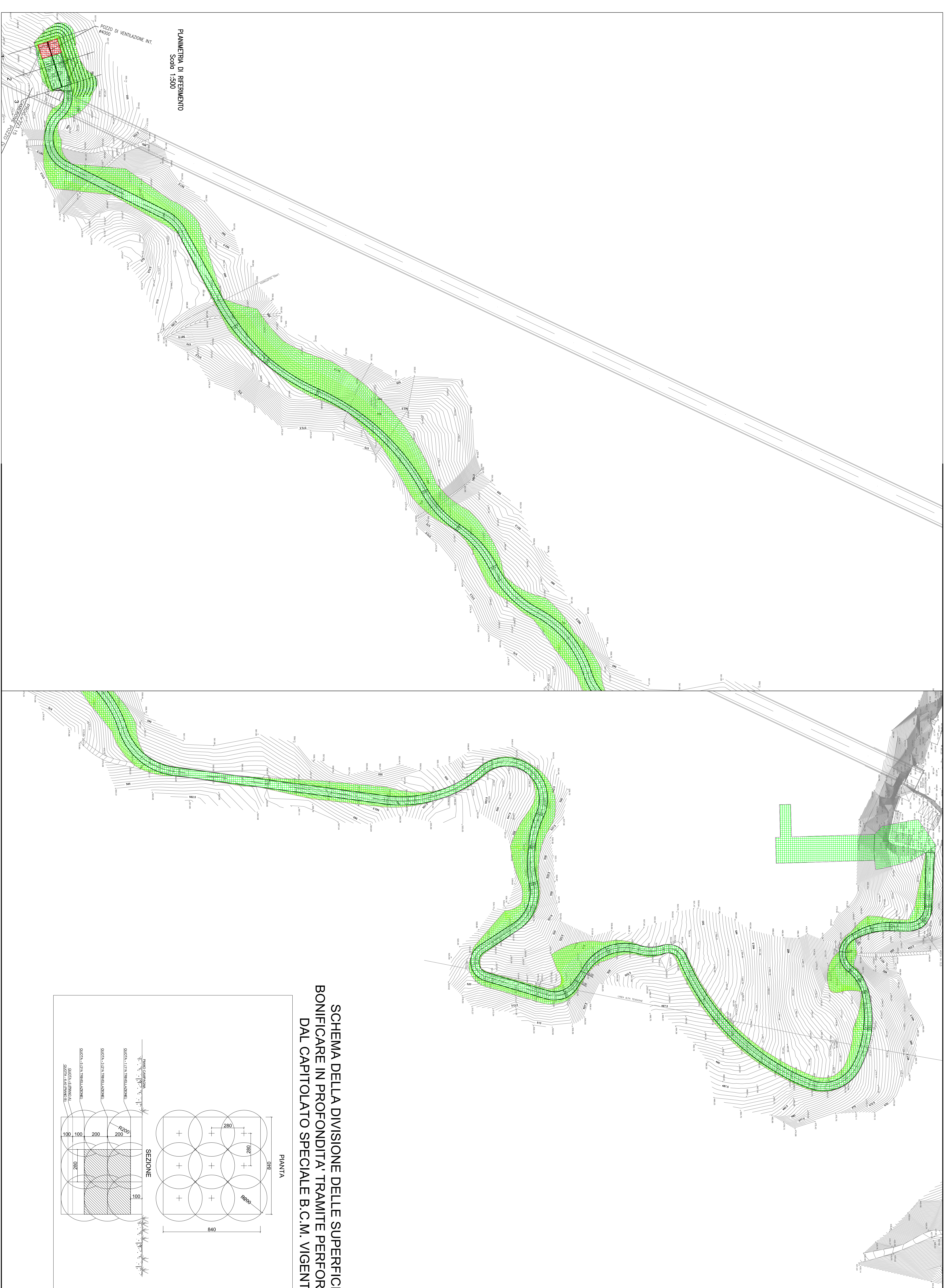
PIANTINA DI RIFERIMENTO Scala: 1:200