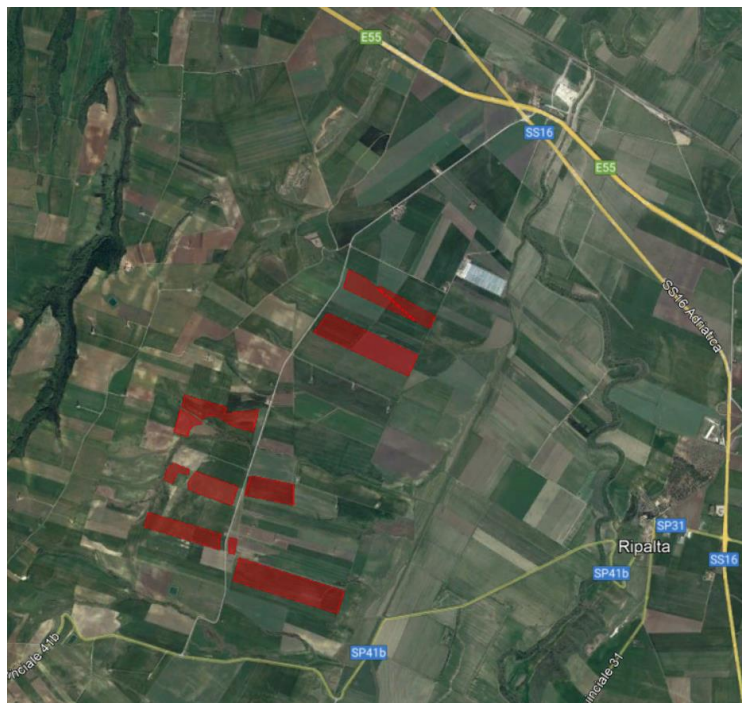
Figura 2.1: Localizzazione dell'area d'intervento. In rosso le sottoaree di progetto.

L'area di intervento complessivamente risulta essere pari a circa 104 ettari complessivi di cui circa 100 ha recintati.