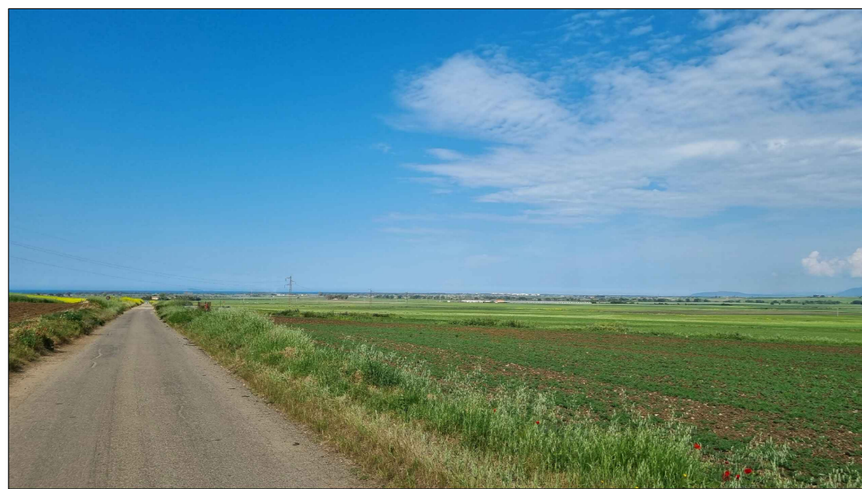
FOTOINSERIMENTO 12 - STATO DI FATTO