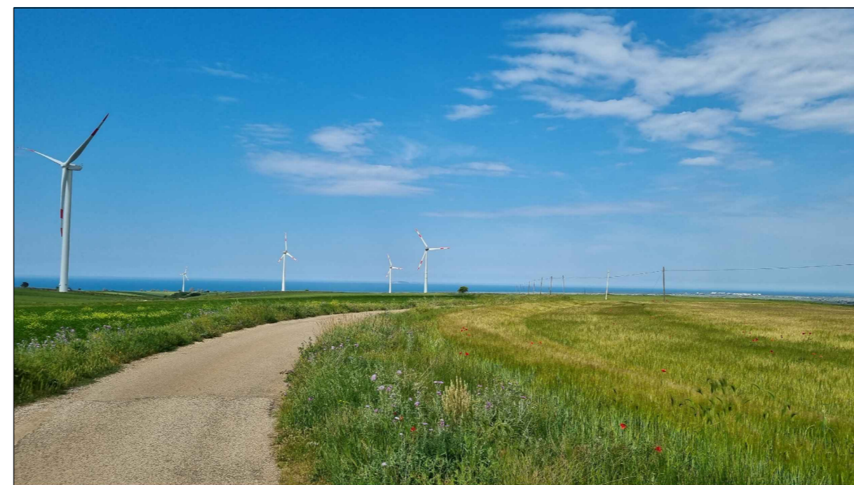
PUNTO DI PRESA FOTOGRAFICA 33