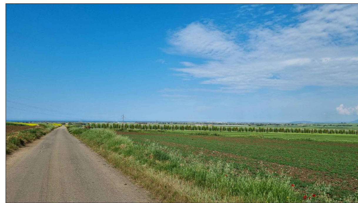
FOTOINSERIMENTO 12 - STATO DI PROGETTO