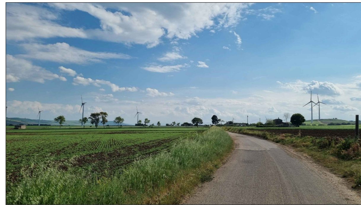
FOTOINSERIMENTO 10 - STATO DI FATTO