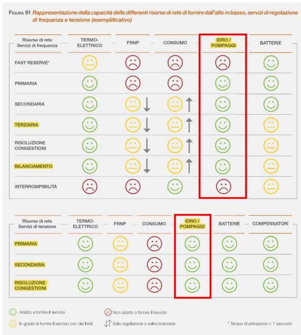
Figura 1: Rappresentazione della capacità delle differenti risorse di rete di fornire dall'alto in basso, servizi di regolazione di frequenza e tensione (esemplificativo), [PdS 2020, p.163]

In tale contesto, lo sviluppo di sistemi di accumulo può fornire un contributo significativo alla mitigazione degli impatti attesi, rappresentando di fatto uno degli strumenti chiave per abilitare la transizione energetica. Nel PdS 2020 si afferma che: