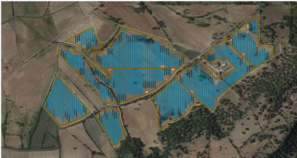
Figura 1. Inquadramento territoriale su ortofoto