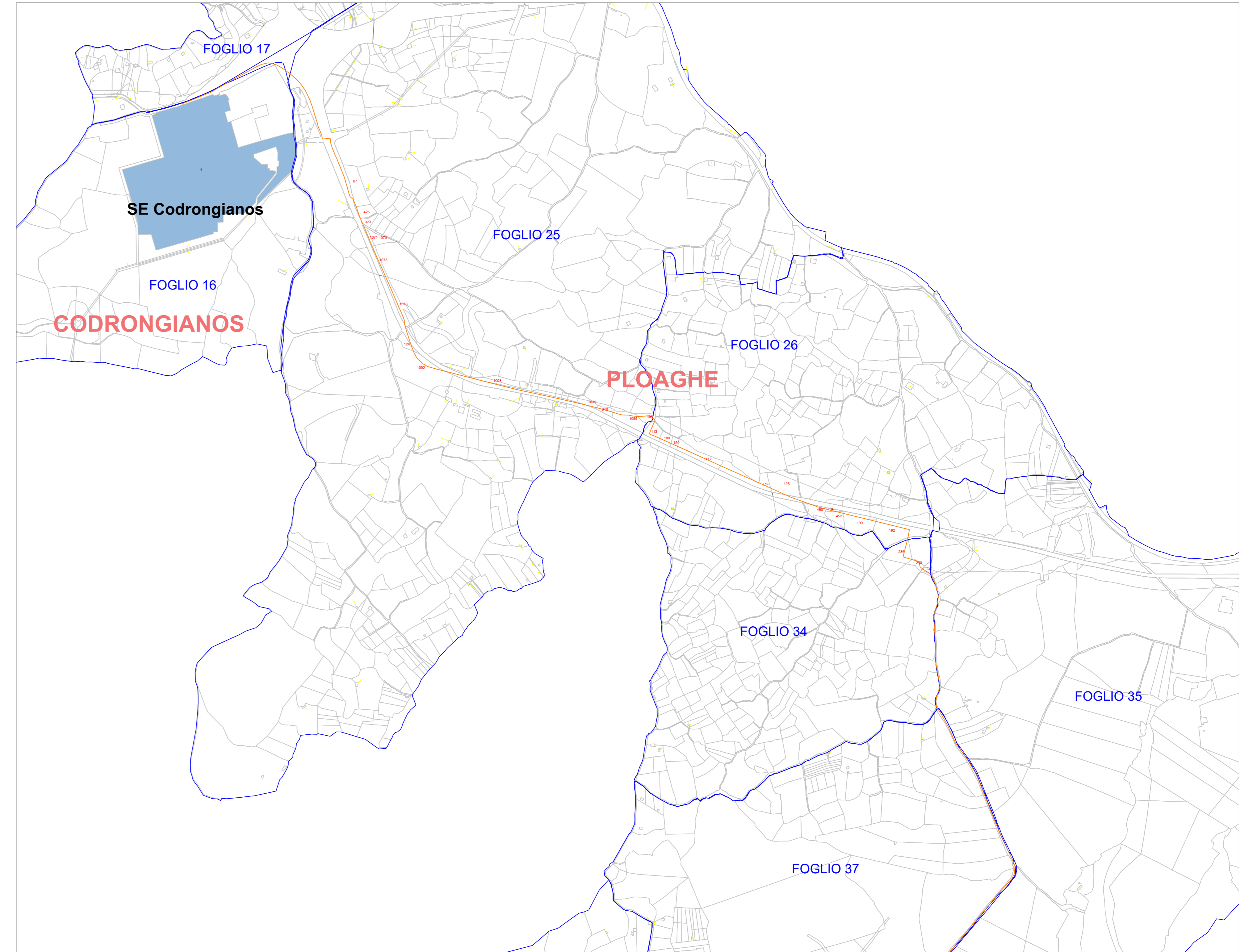
QUADRO B - Scala 1:9000