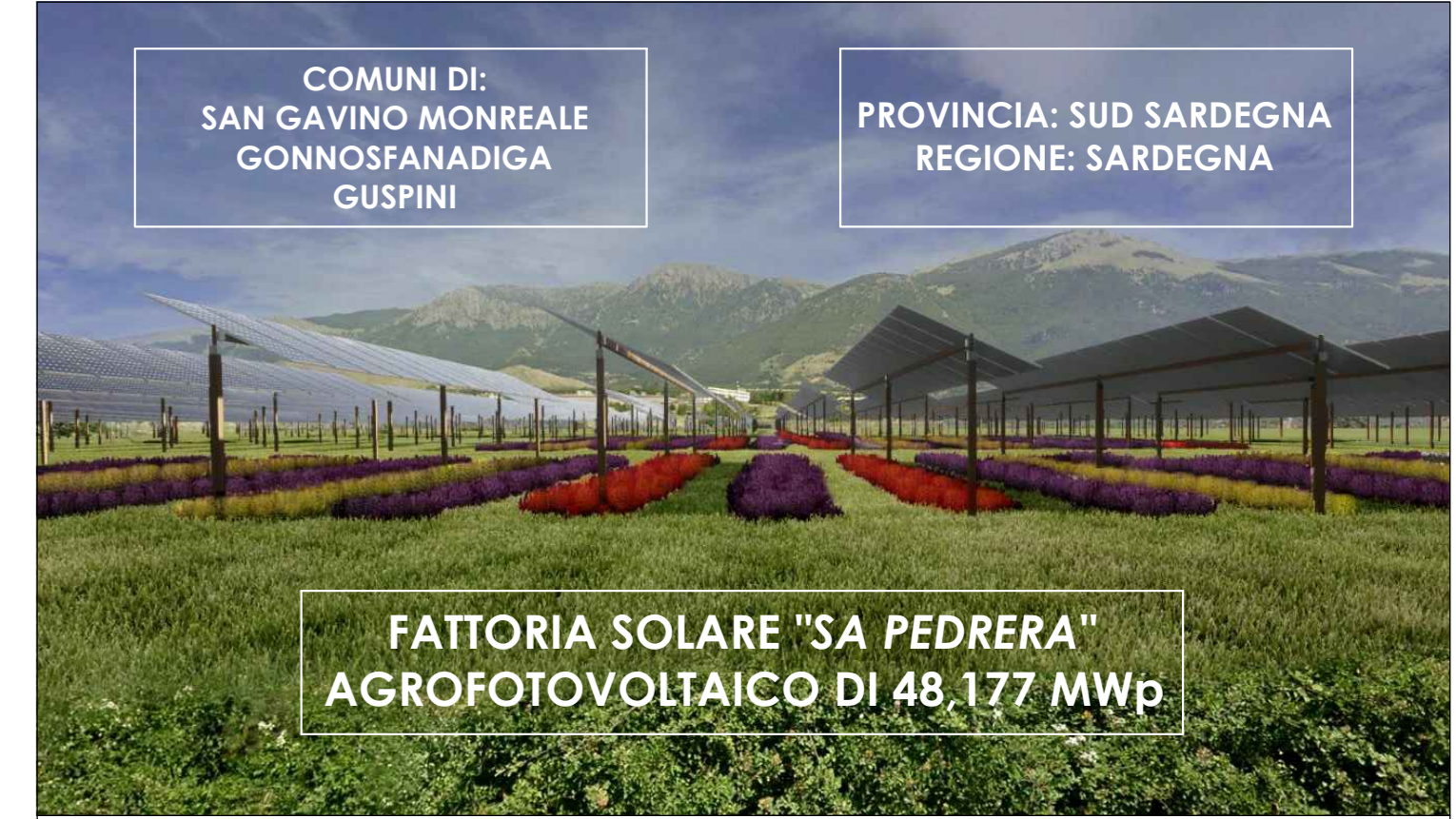
FATTORIA SOLARE "SA PEDRERA" AGROFOTOVOLTAICO DI 48,177 MWp

PROGETTO DEFINITIVO INQUADRAMENTO CAVIDOTTO SU CATASTALE