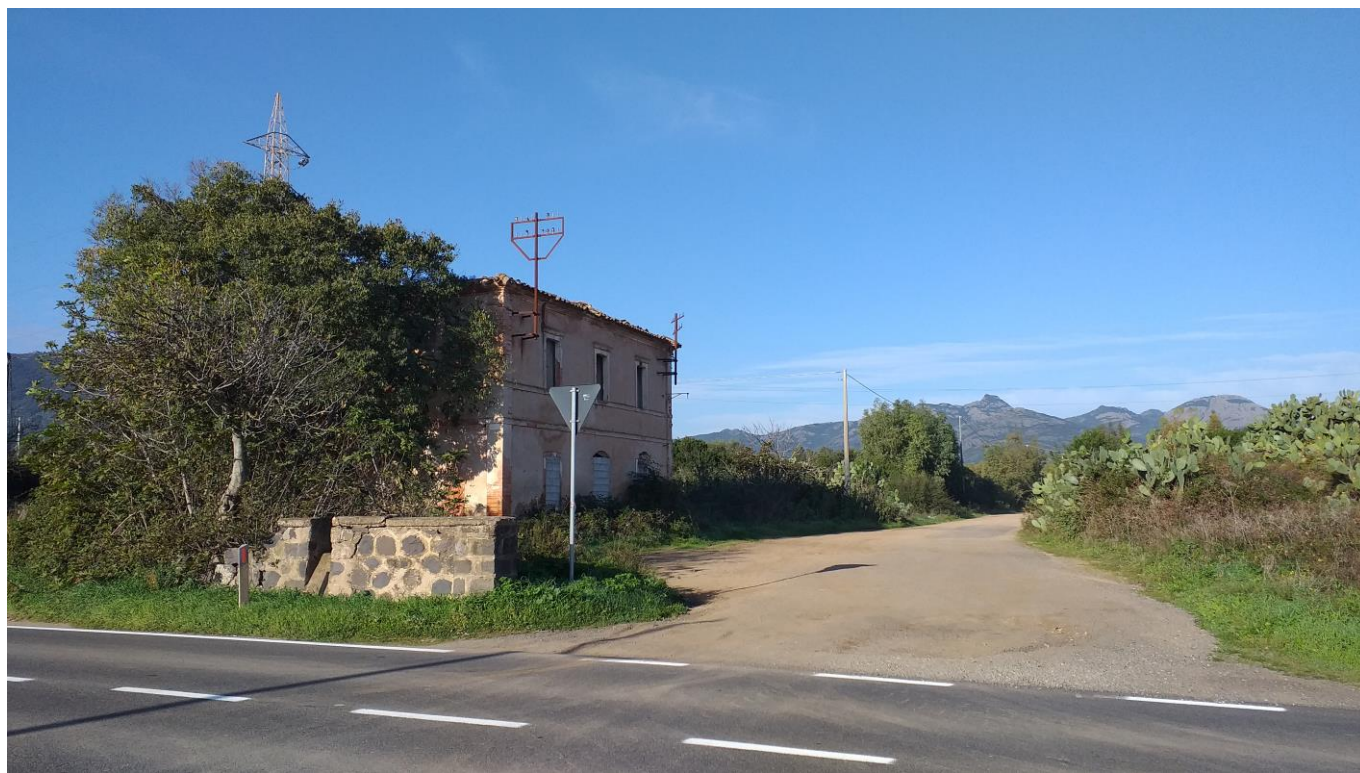
Strada Statale 126 KM 92+500

Oggetto: Strada Statale 126 – punto di intersezione tra la SS126 e l'ingresso della nuova strada che conduce alla nuova stazione elettrica