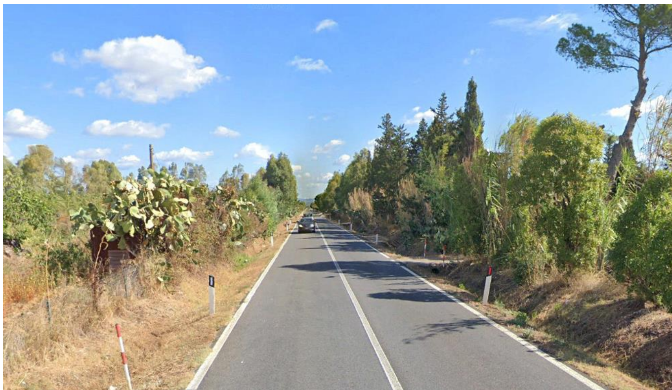
Strada Statale 126 KM 92+900

Oggetto: Strada Statale 126 – Campata tra i sostegni 41 e 42 della linea “Villacidro-Guspini”