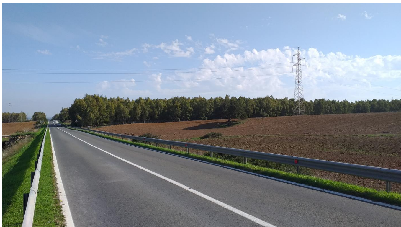
Strada Statale 197, KM 9+70

Oggetto: Strada Statale 197 – Campata tra i sostegni 15 e 16 della linea “Villacidro-Guspini”