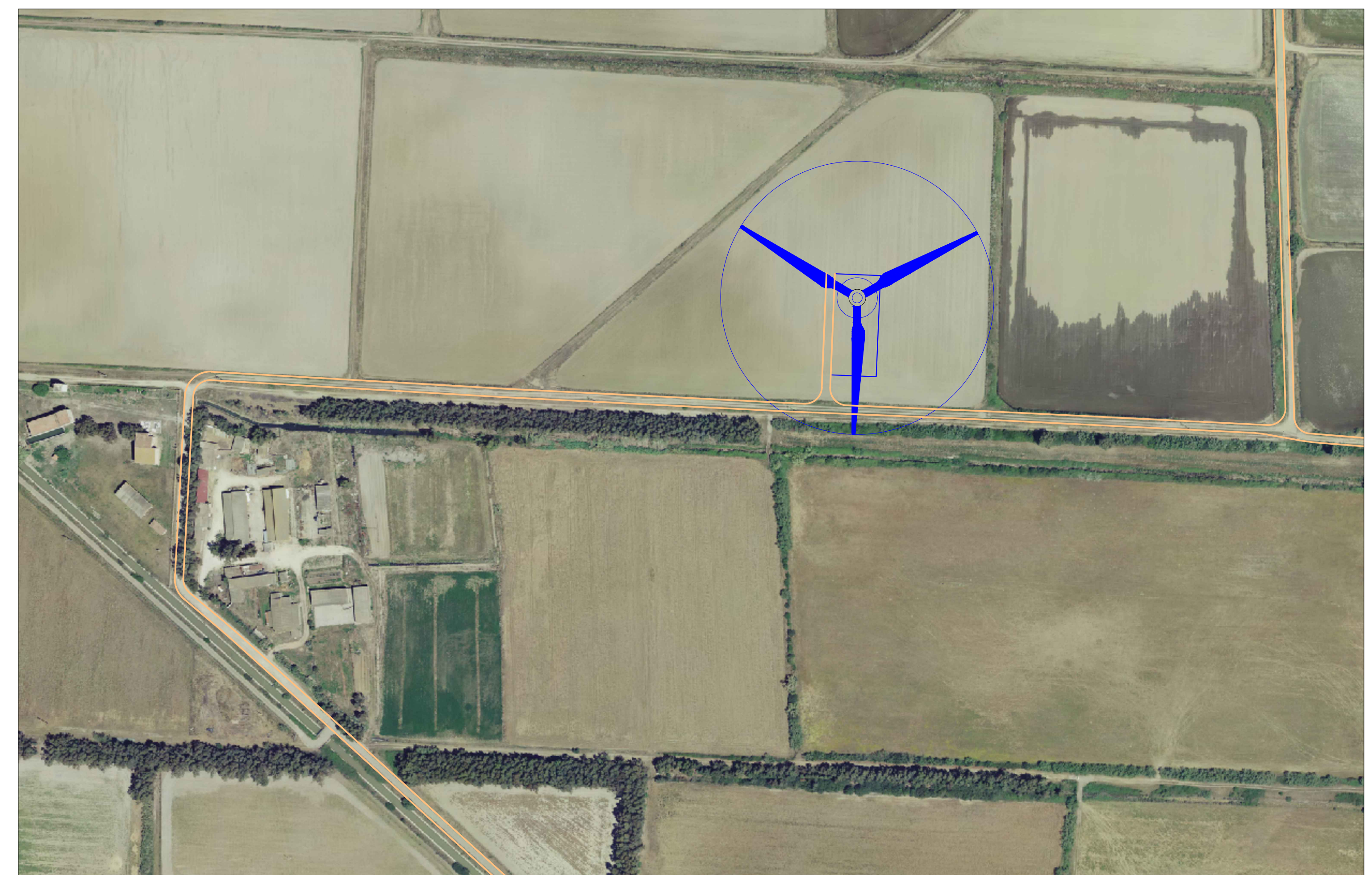
AG02 - PIAZZOLA E VIABILITA' IN FASE DI ESERCIZIO