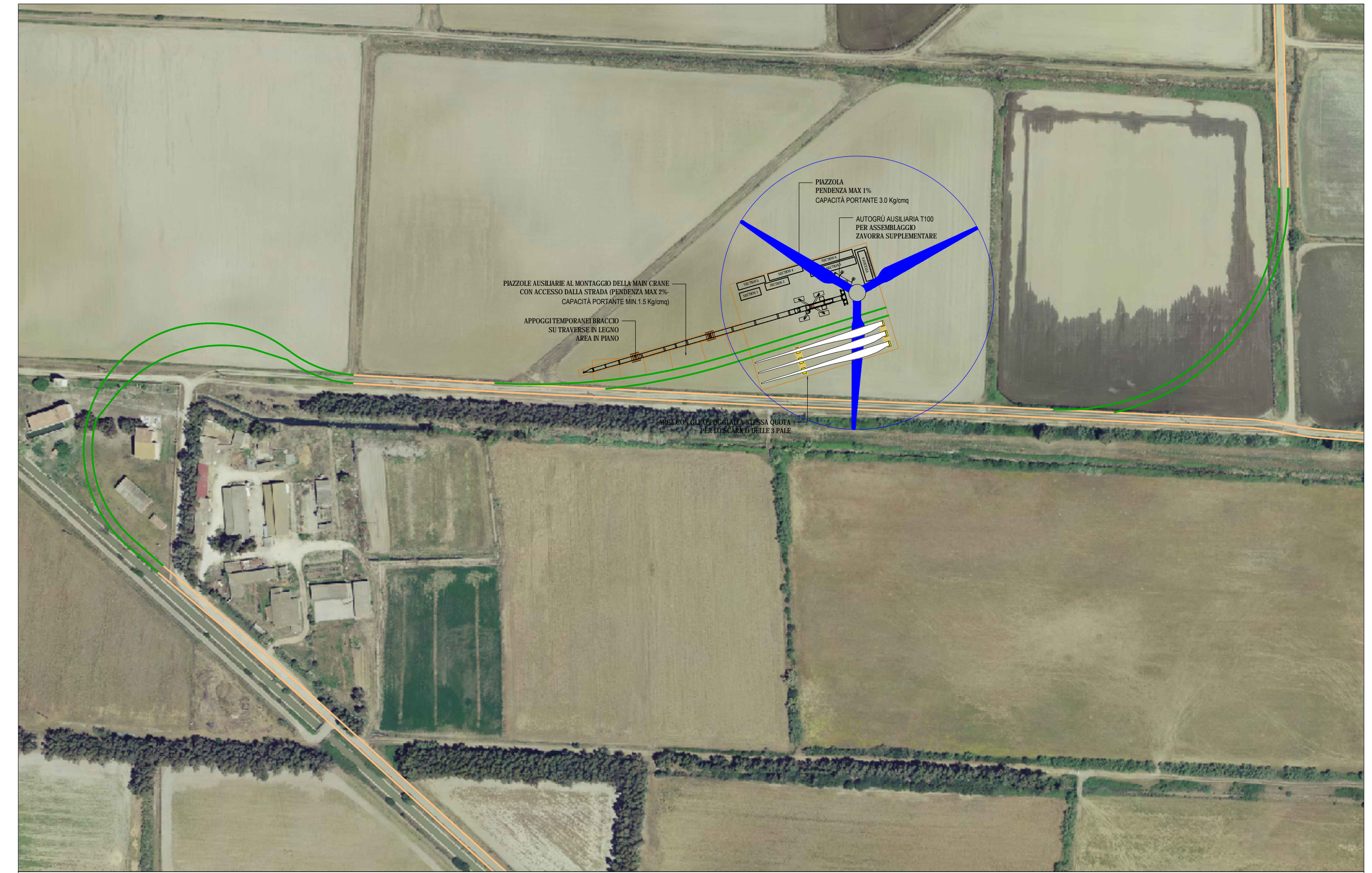
AG02 - PIAZZOLA E VIABILITA' IN FASE DI MONTAGGIO