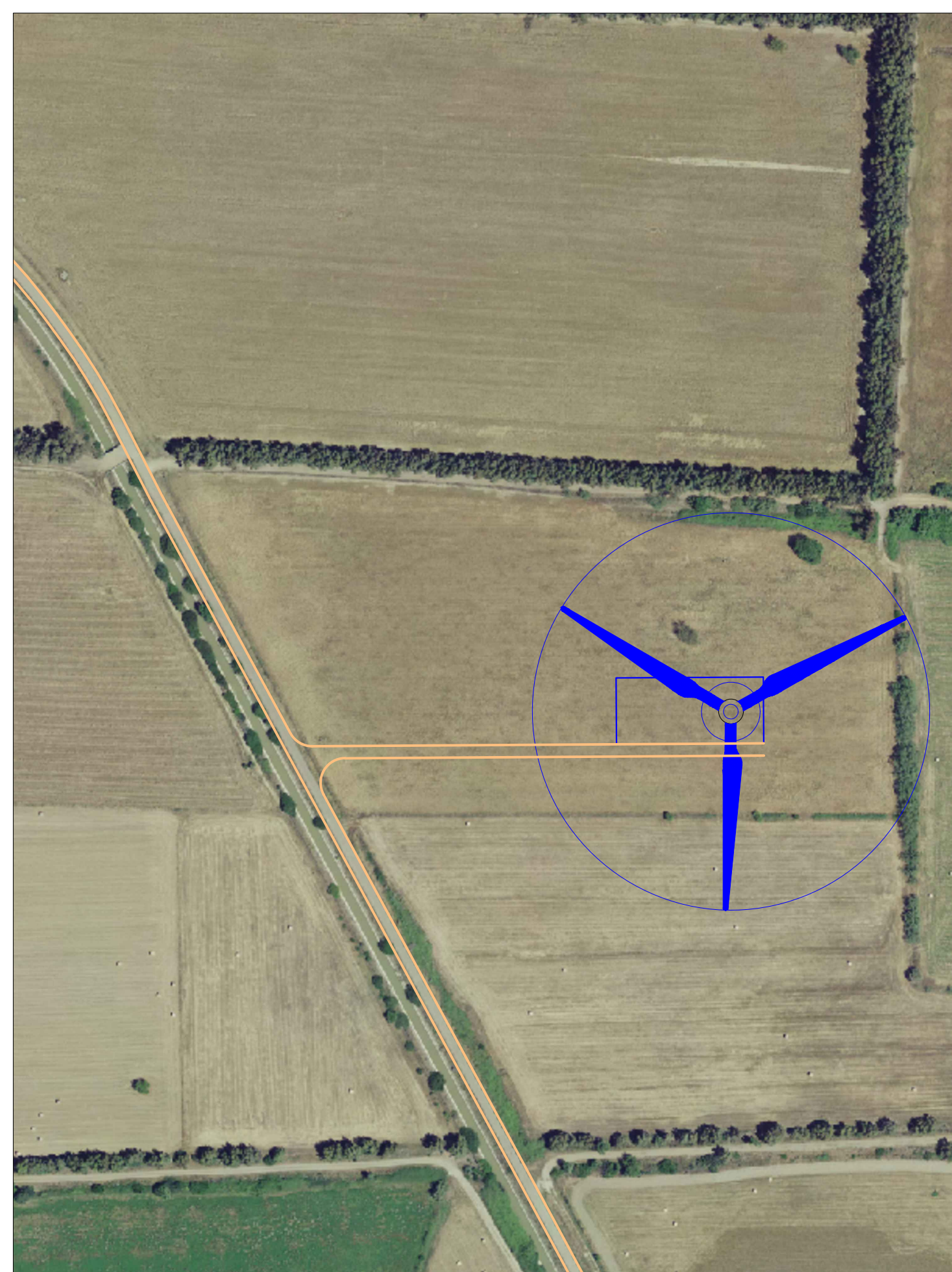
AG01 - PIAZZOLA E VIABILITA' IN FASE DI ESERCIZIO