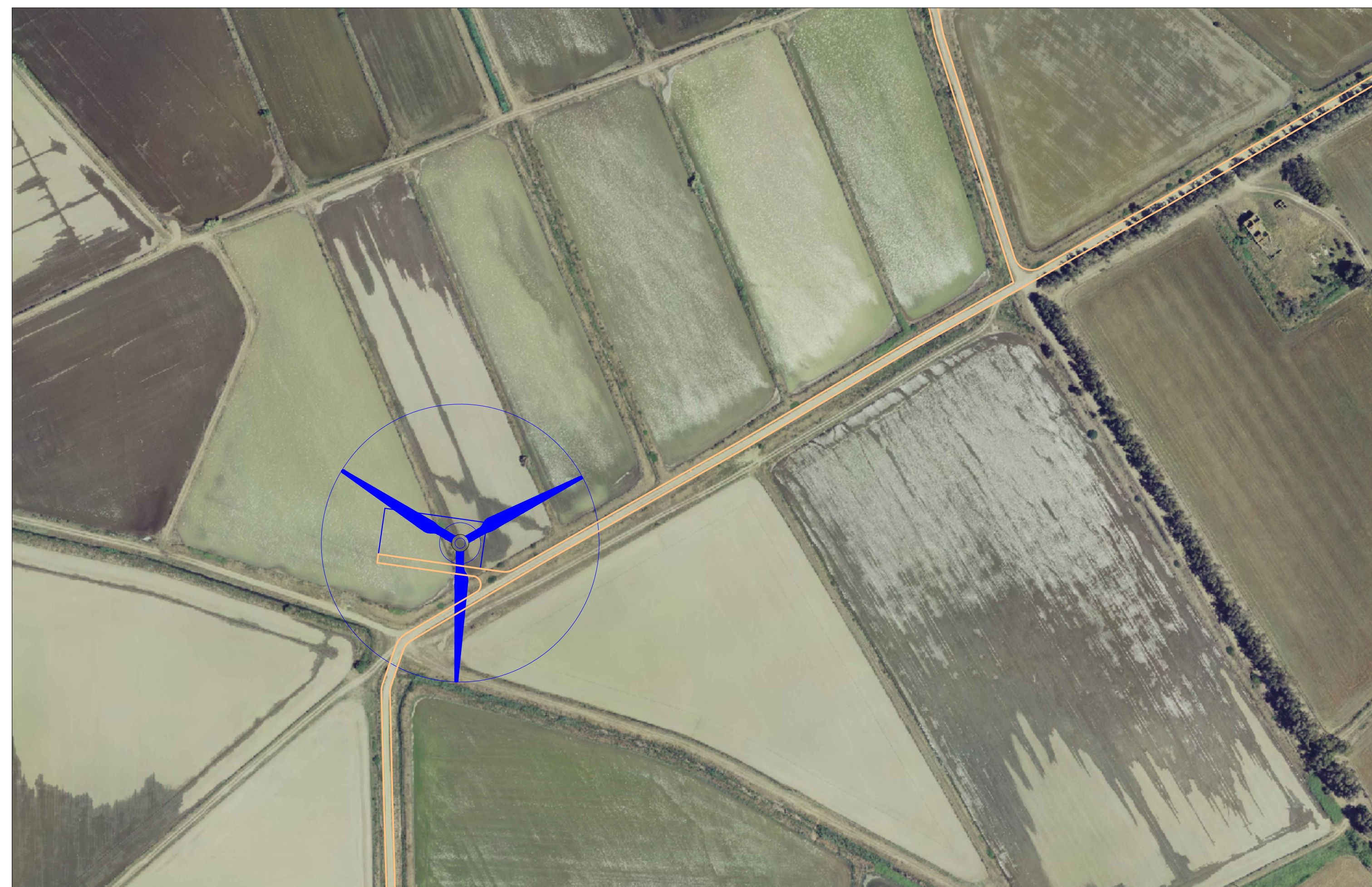
AG03 - PIAZZOLA E VIABILITA' IN FASE DI ESERCIZIO

Studio di Ingegneria Viale Trieste, 58 09037 San Gavino Monreale (SU) Tel. +39 070 252042 Mob. +39 347 1327339 e-mail: studio@sergiolai.com