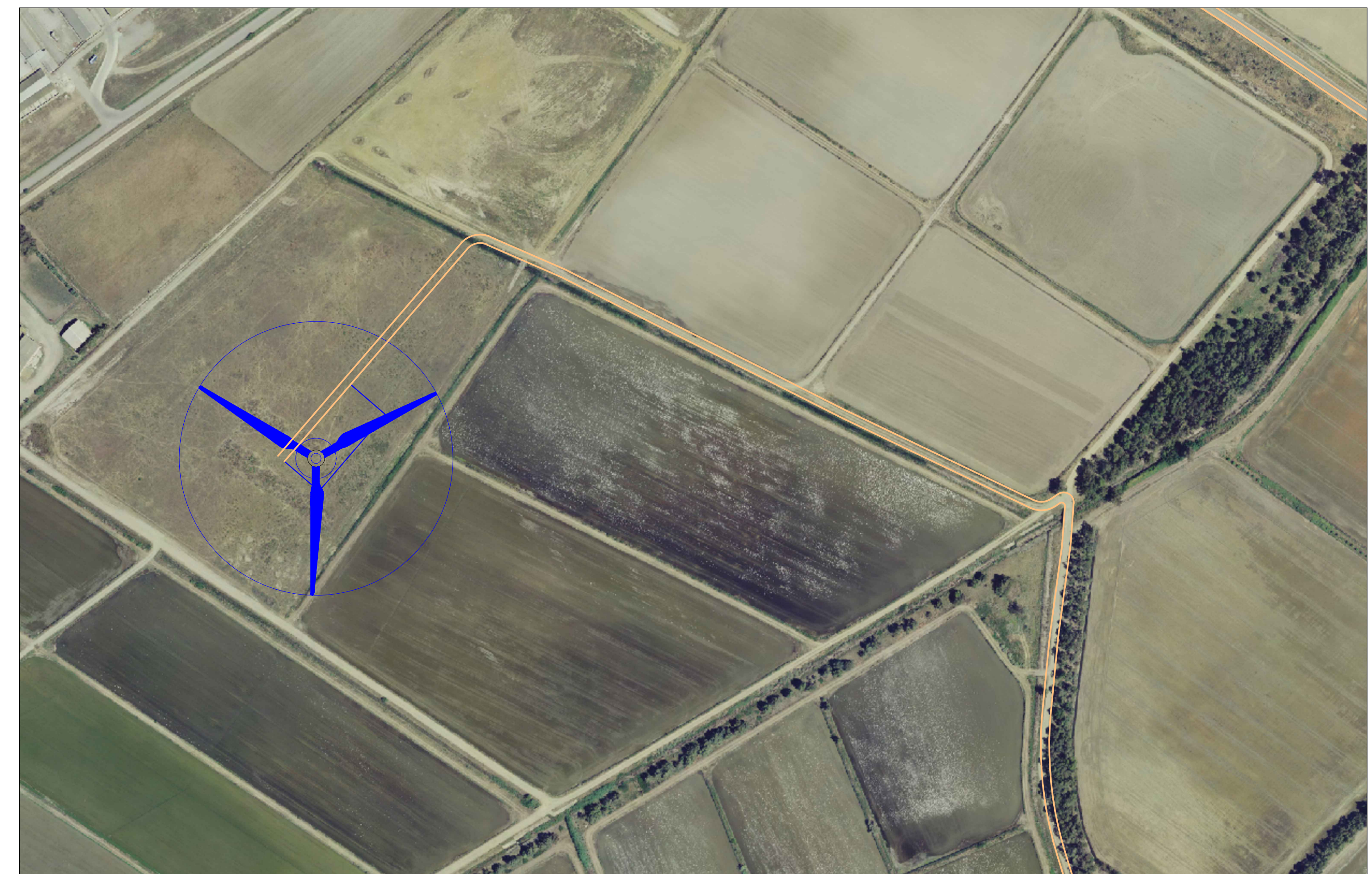
AG04 - PIAZZOLA E VIABILITA' IN FASE DI ESERCIZIO