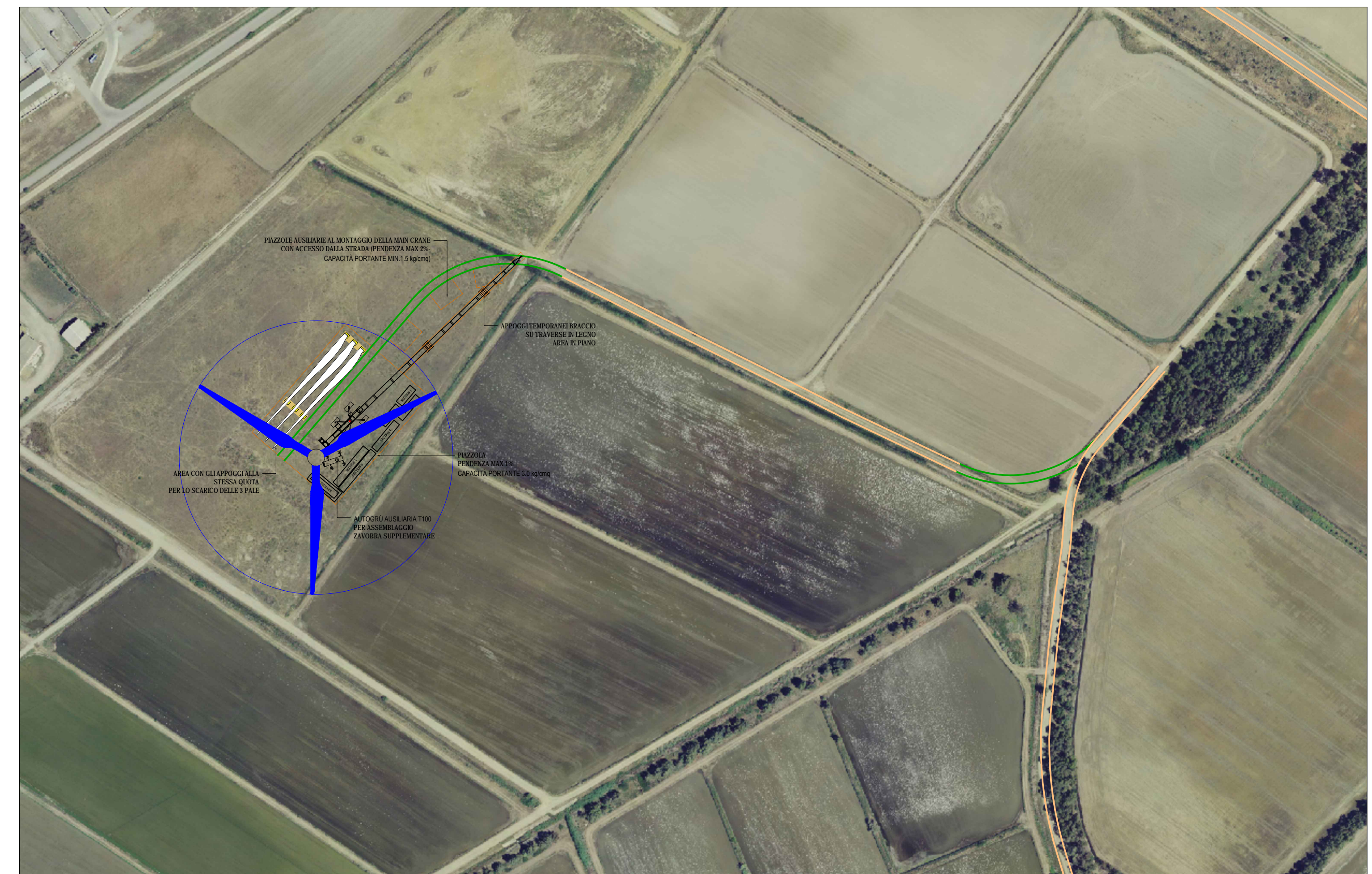
AG04 - PIAZZOLA E VIABILITA' IN FASE DI MONTAGGIO