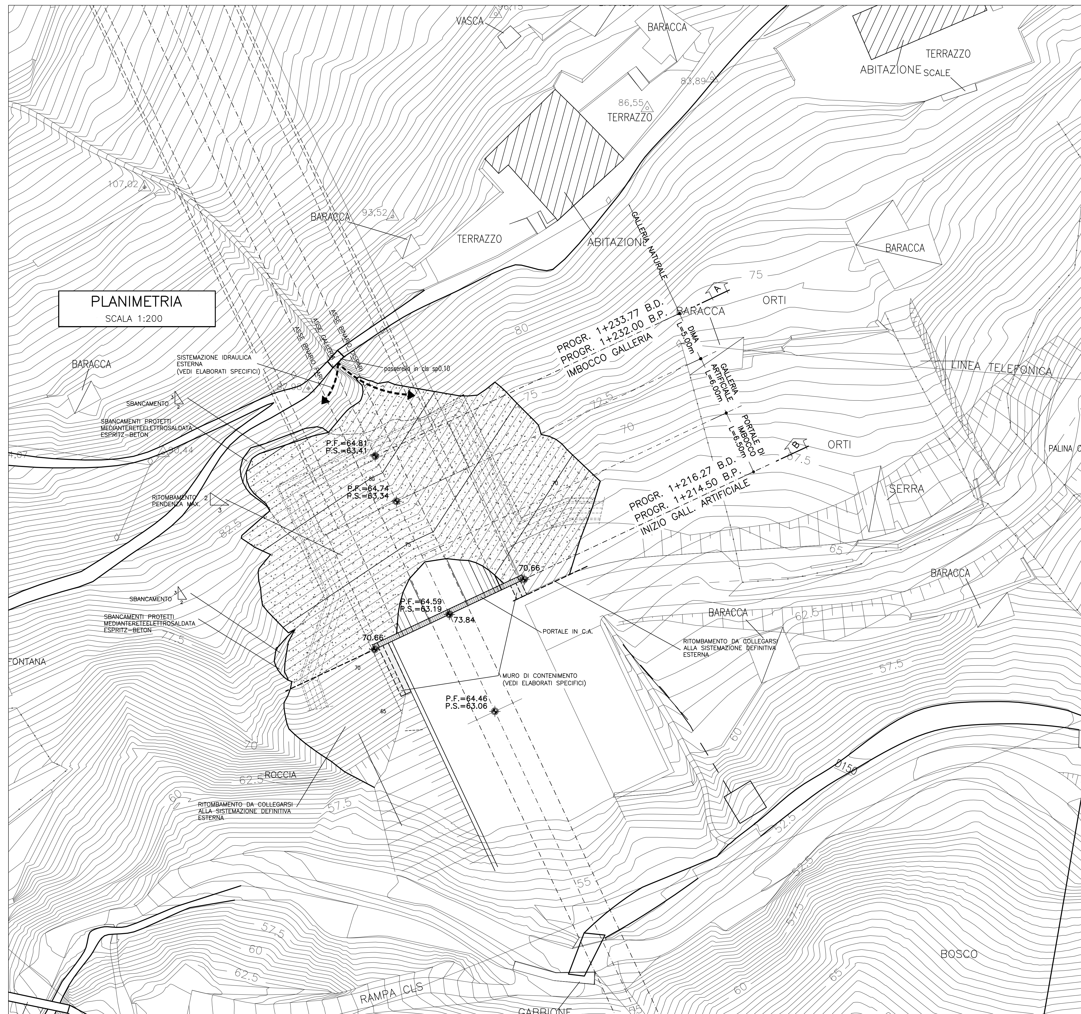
PLANIMETRIA SCALA 1:200

NOTA PER LA SISTEMAZIONE IDRAULICA SI RIMANDA AGLI ELABORATI SPECIFICI