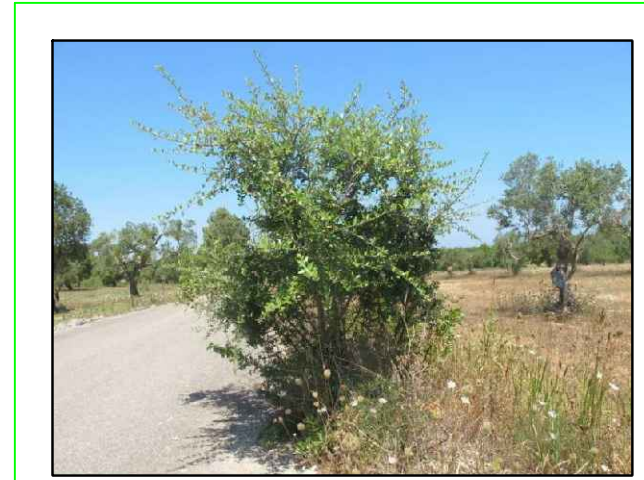
OLIVASTRO OLEA EUROPEAE