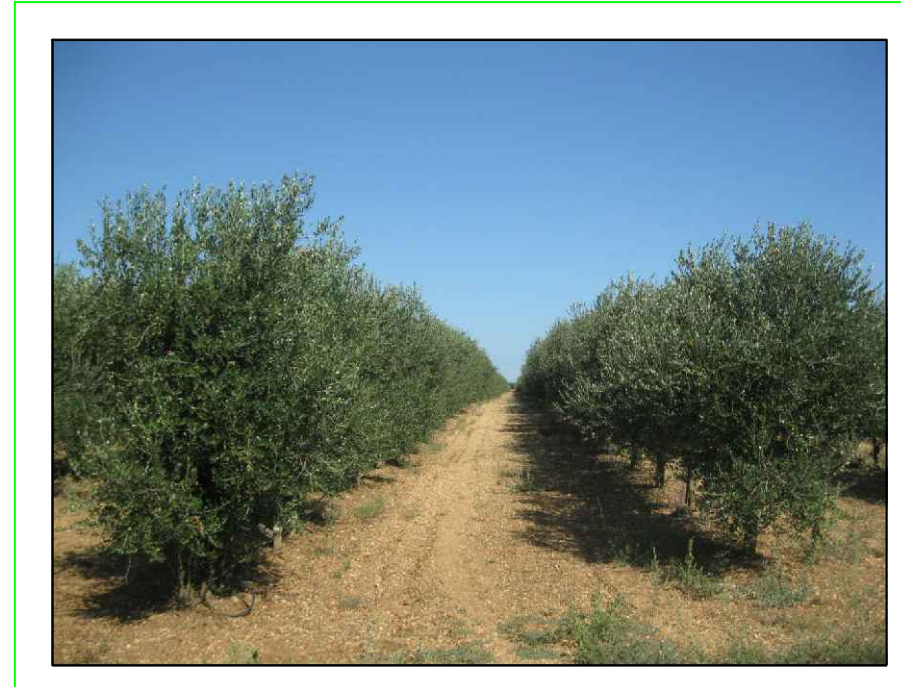
LA FAVOLOSA - VARIETA' FS-17

FASCIA DI MITIGAZIONE Vista Laterale - Scala di Riproduzione 1:50