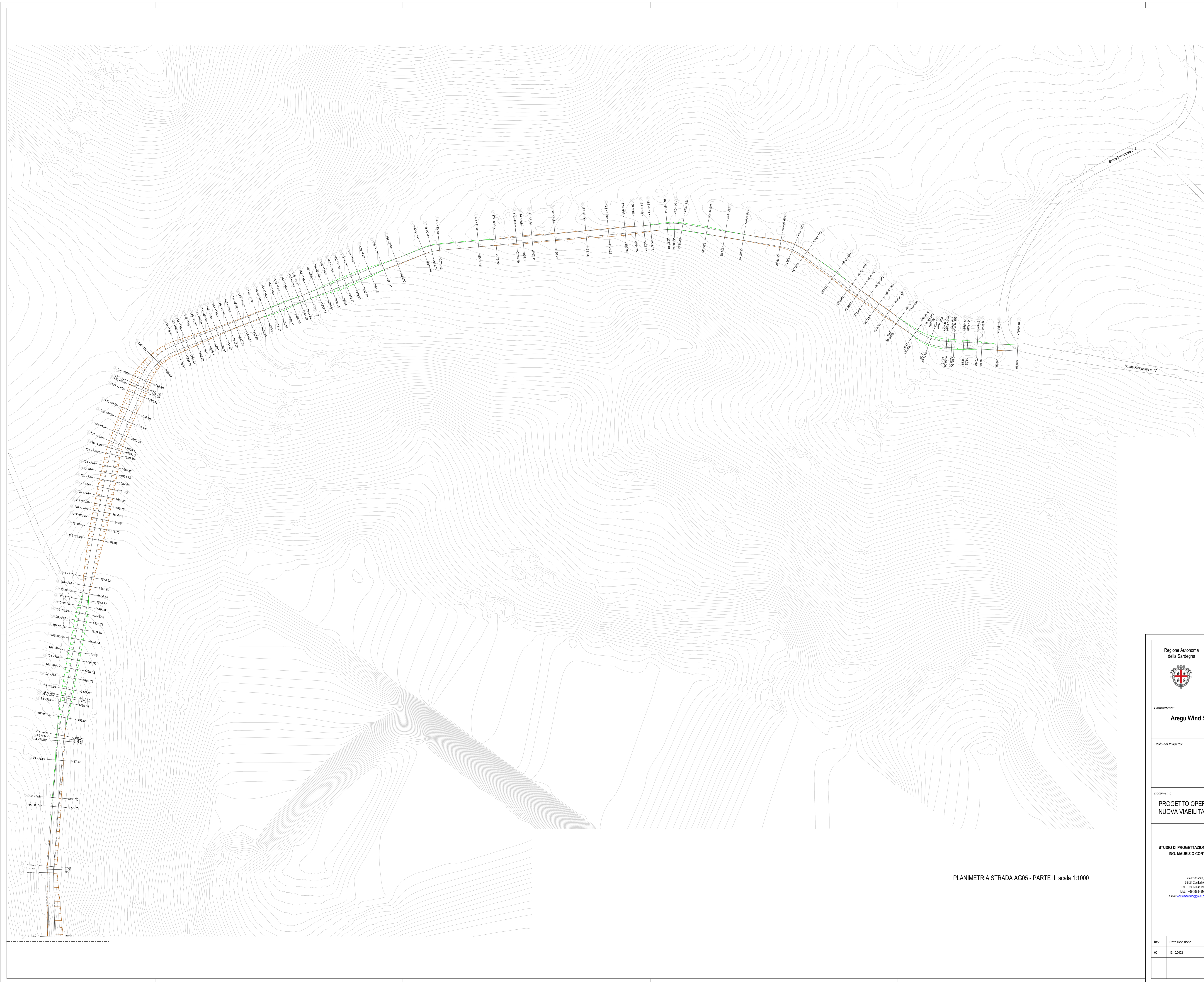
PLANIMETRIA STRADA AG05 - PARTE II scala 1:1000