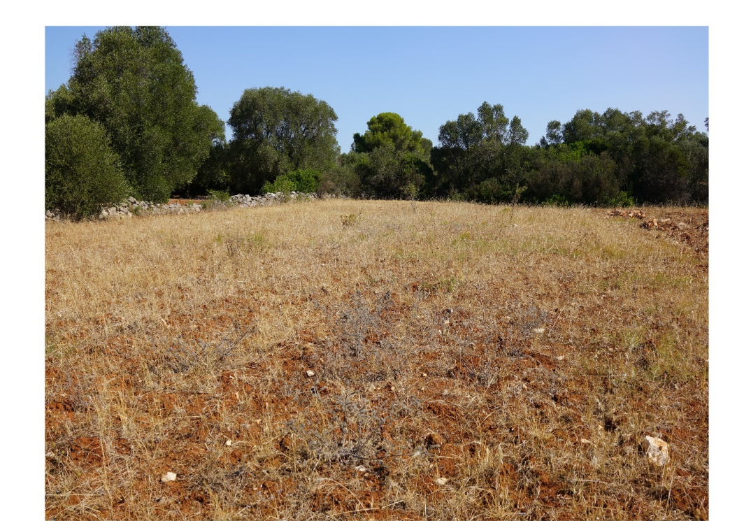
Comunità erbacee degli incolti