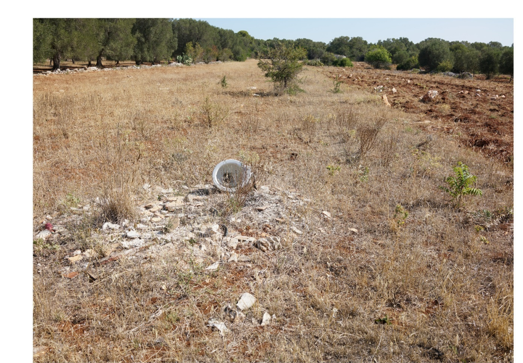
Comunità di erbe infestanti delle aree coltivate