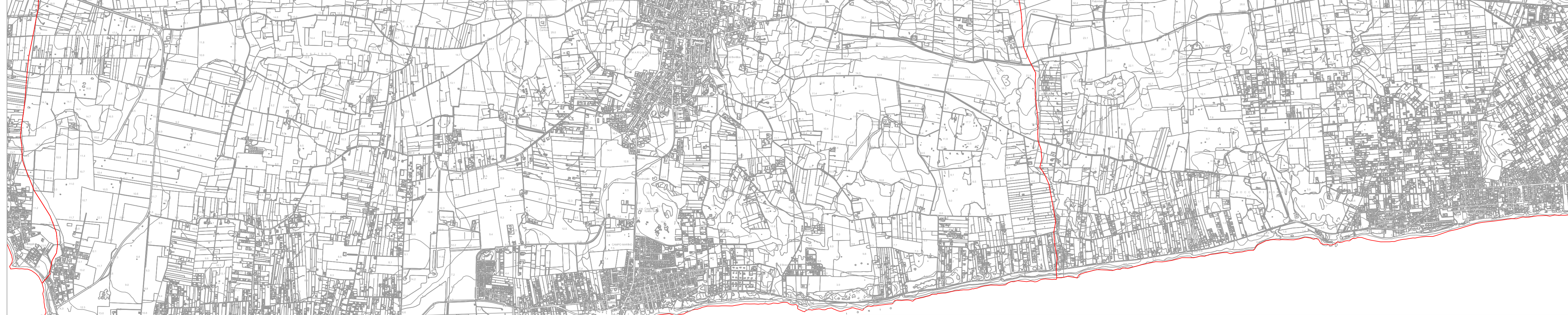
Dati geografici e catastali degli aerogeneratori - WGS 84-33N