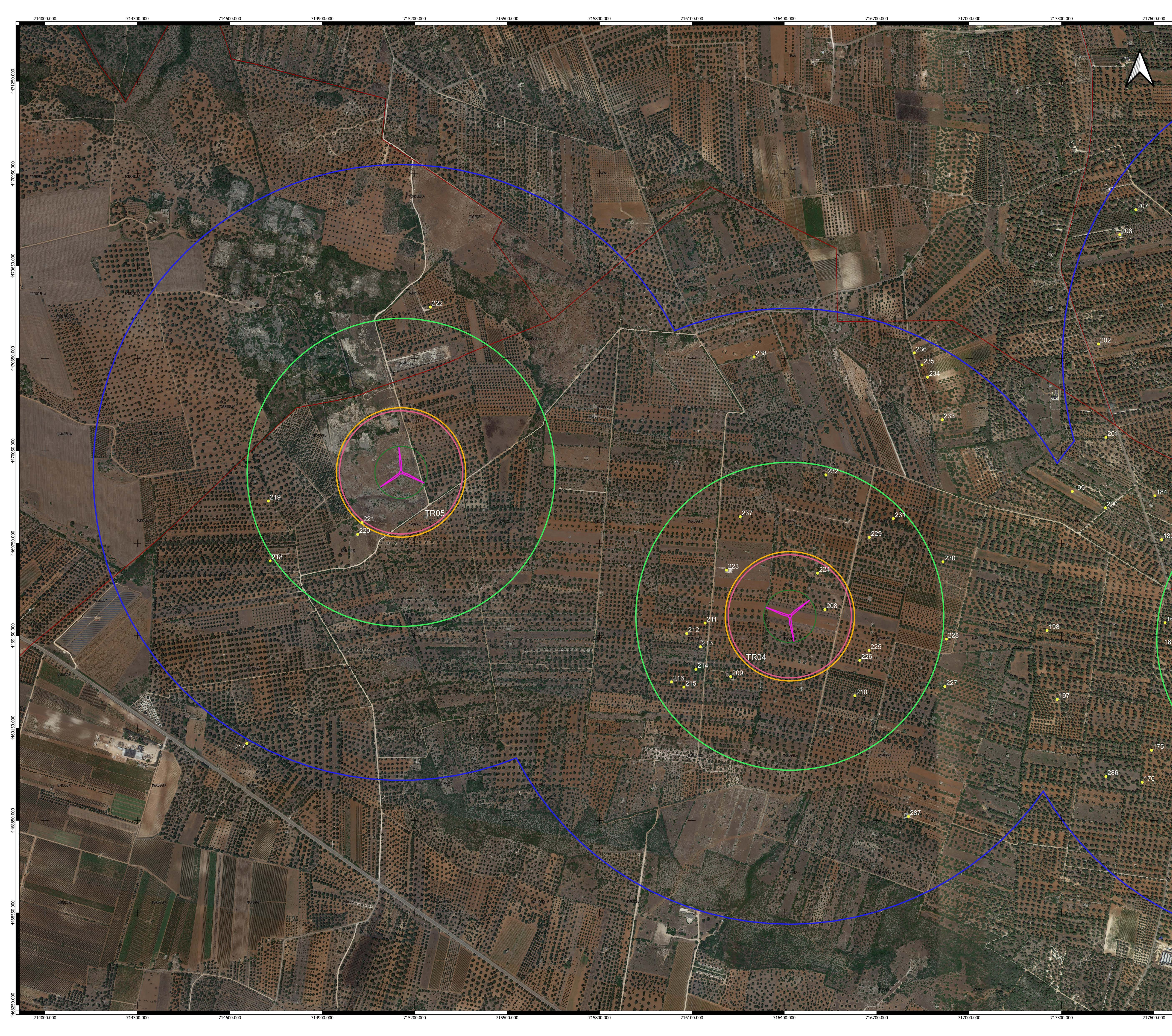
TABELLA RECETTORI CENSITI NEL RAGGIO DI 200 m DALLA WTG