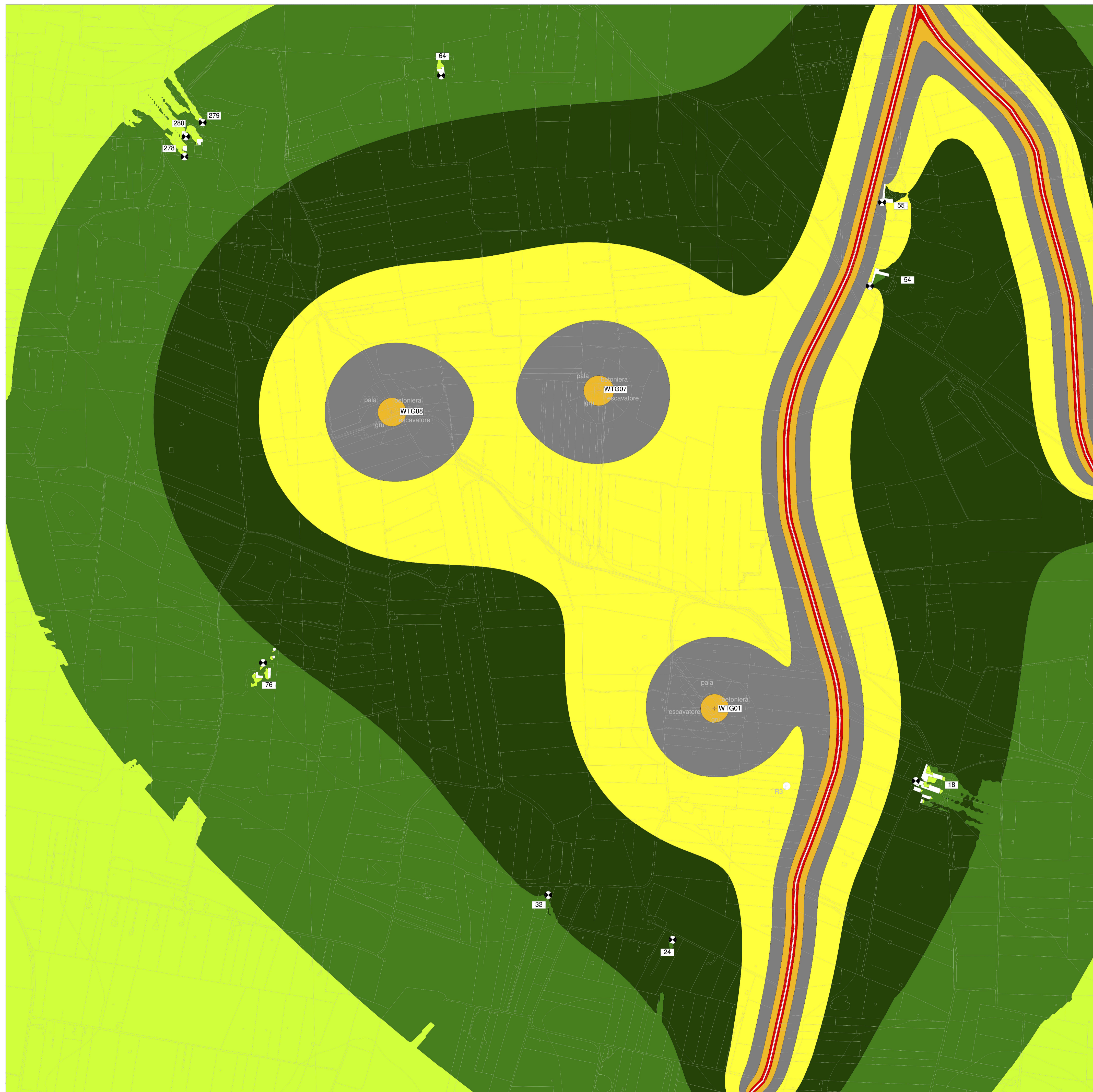
MAPPA A COLORI CON ISOFONICHE - LIVELLI DI IMMISSIONE DIURNI - SETTORE 2