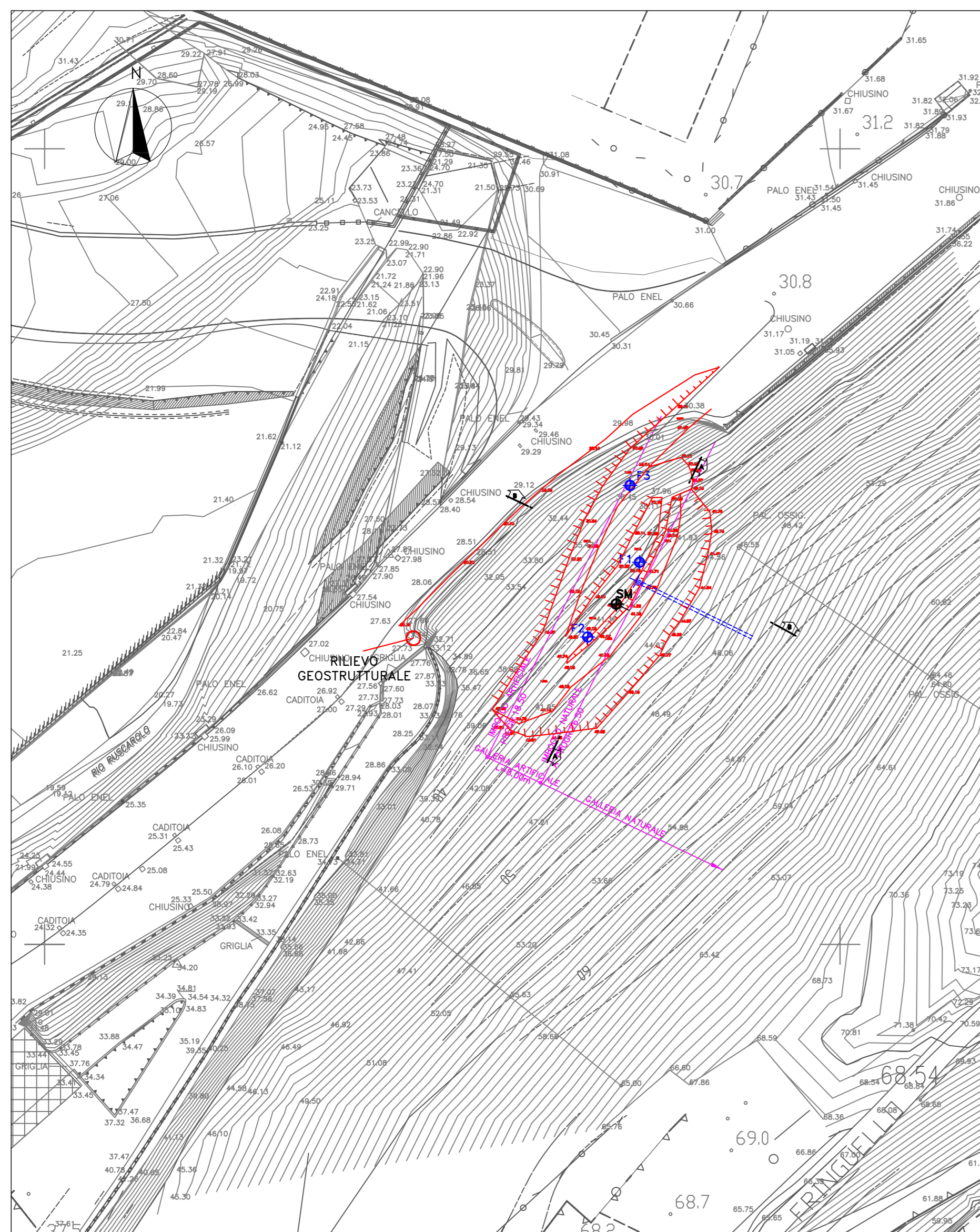
UBICAZIONE FORI A DISTRUZIONE E SONDAGGIO A CAROTAGGIO scala 1:500