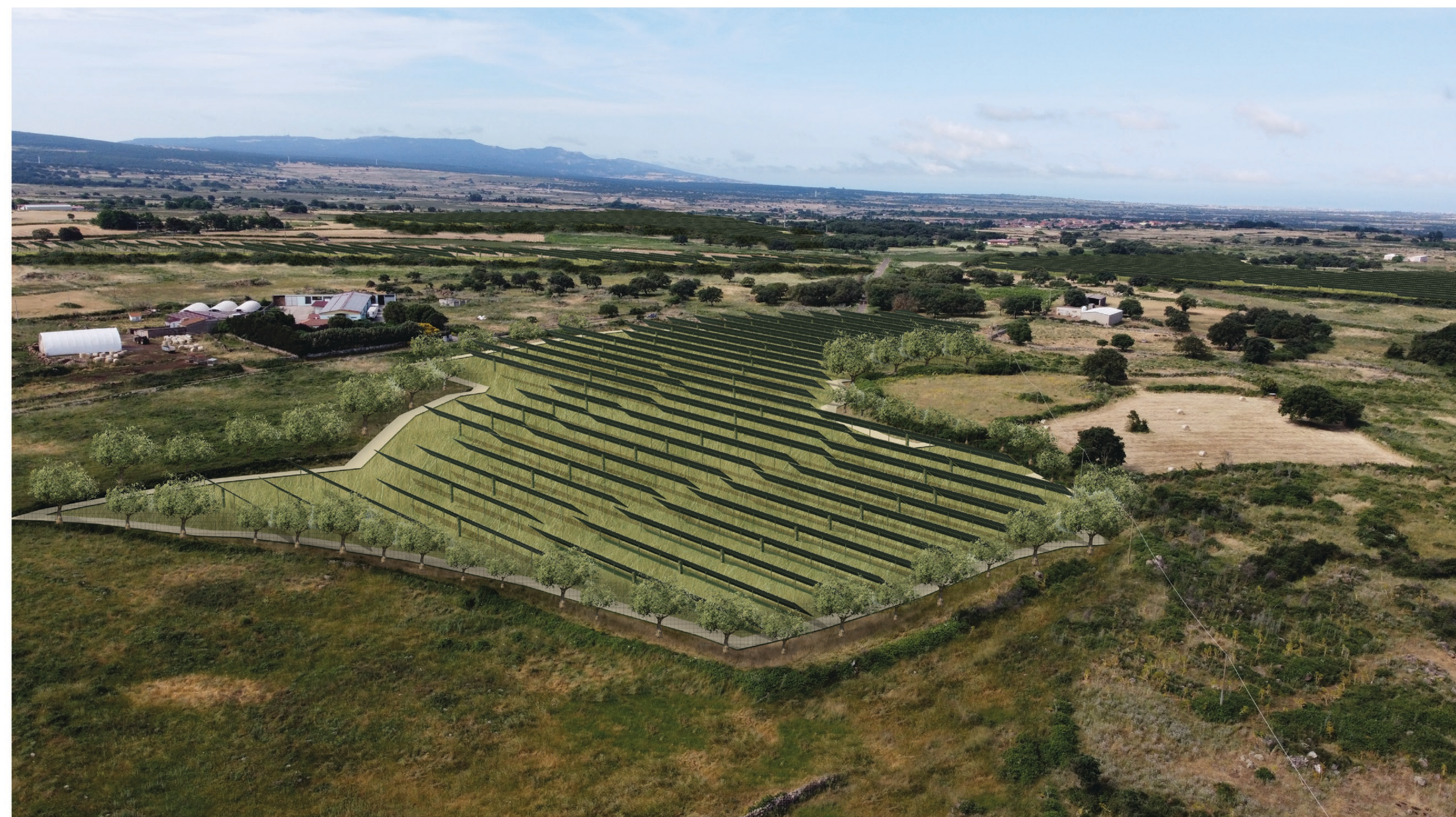
FOTOSIMULAZIONE DA STRADA DELL'IMPIANTO VISTA B