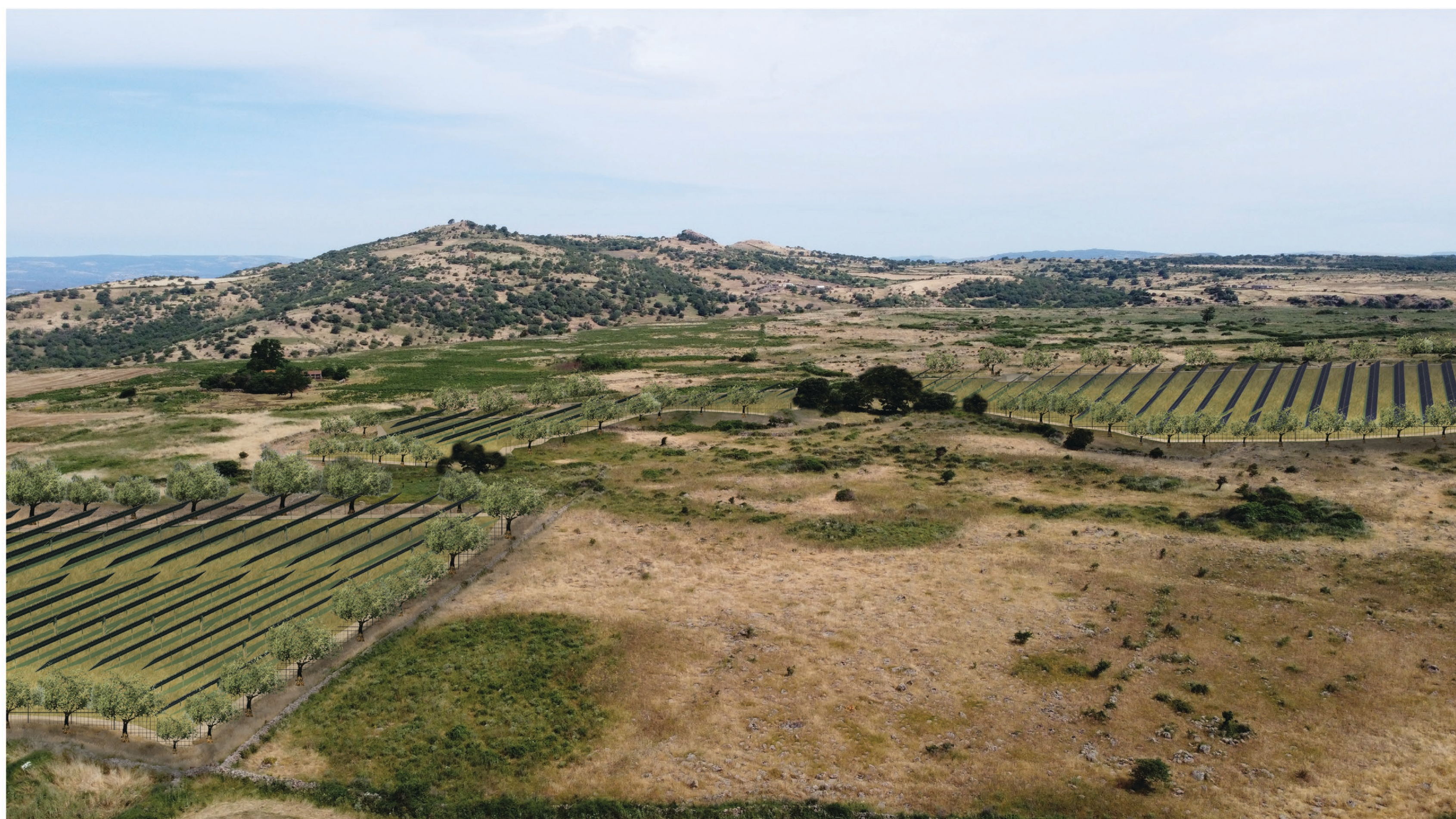
FOTOSIMULAZIONE PROSPETTICA DELL'IMPIANTO VISTA C