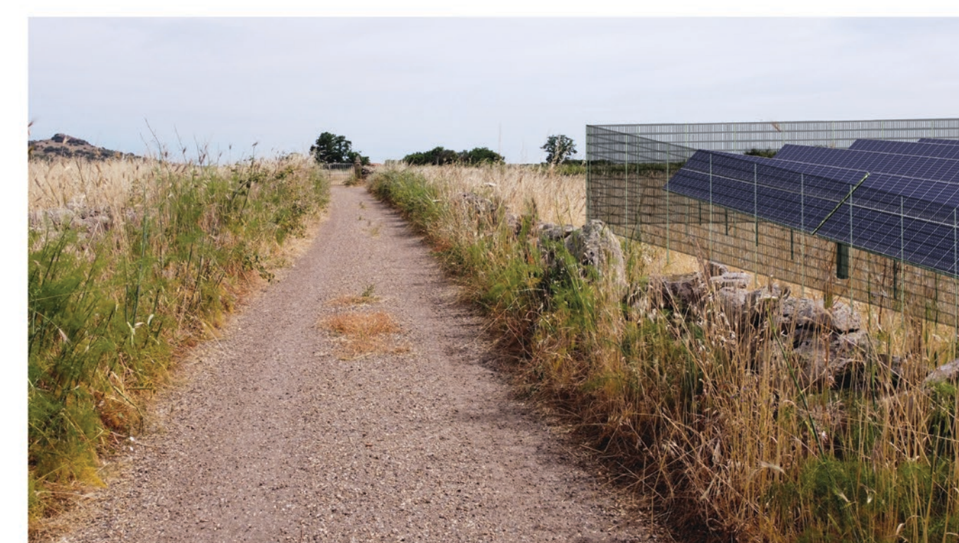
FOTOSIMULAZIONE DA STRADA SENZA E CON MITIGAZIONE VISTA F