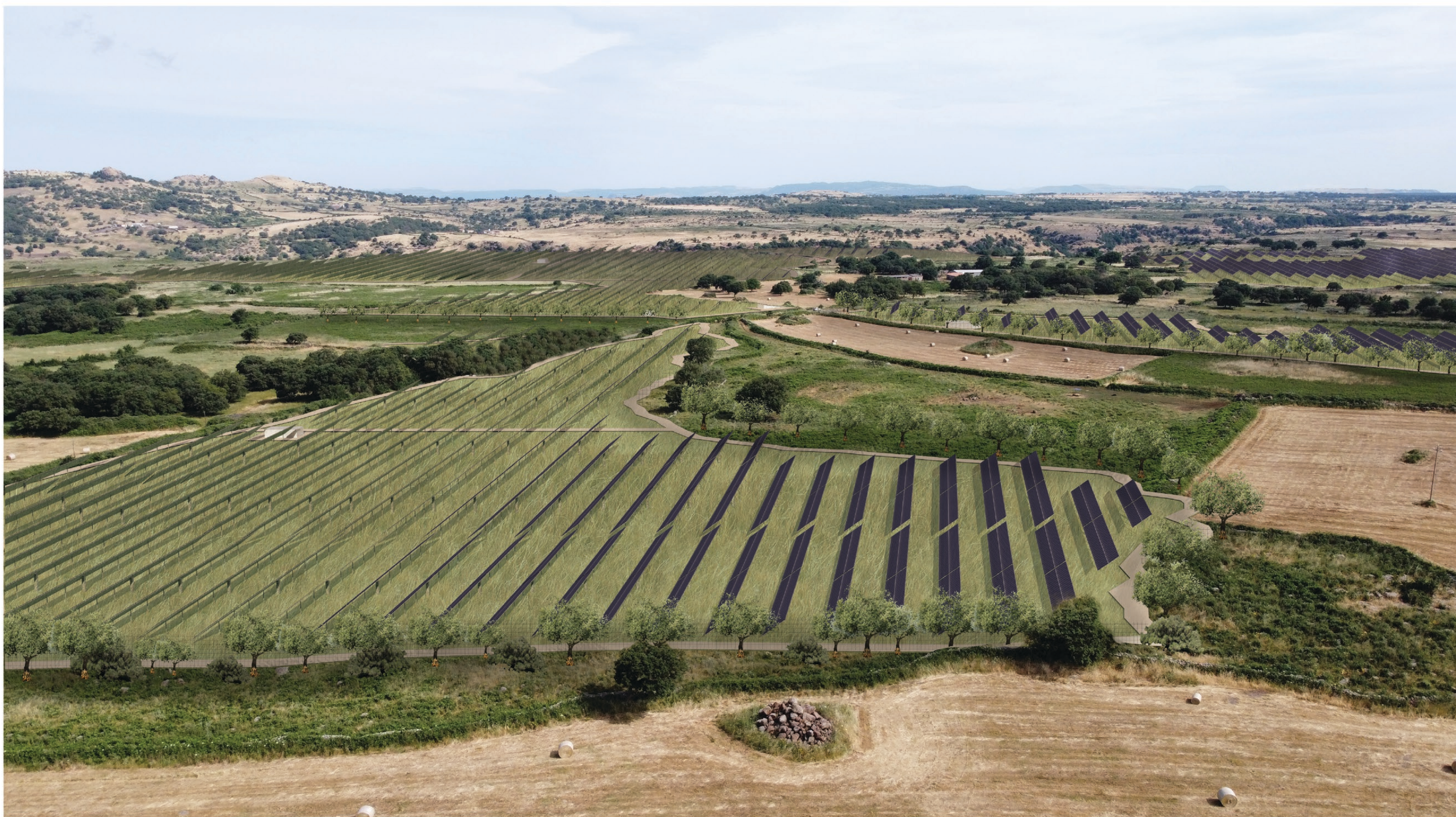
FOTOSIMULAZIONE PROSPETTICA DELL'IMPIANTO VISTA A