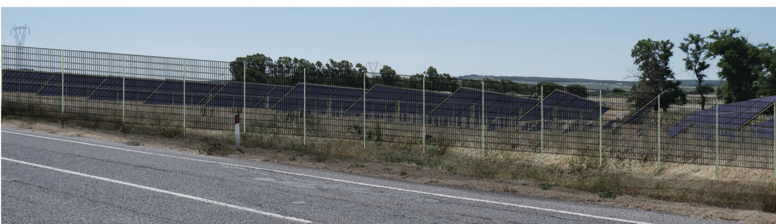
FOTOSIMULAZIONE DA STRADA SENZA E CON MITIGAZIONE VISTA E