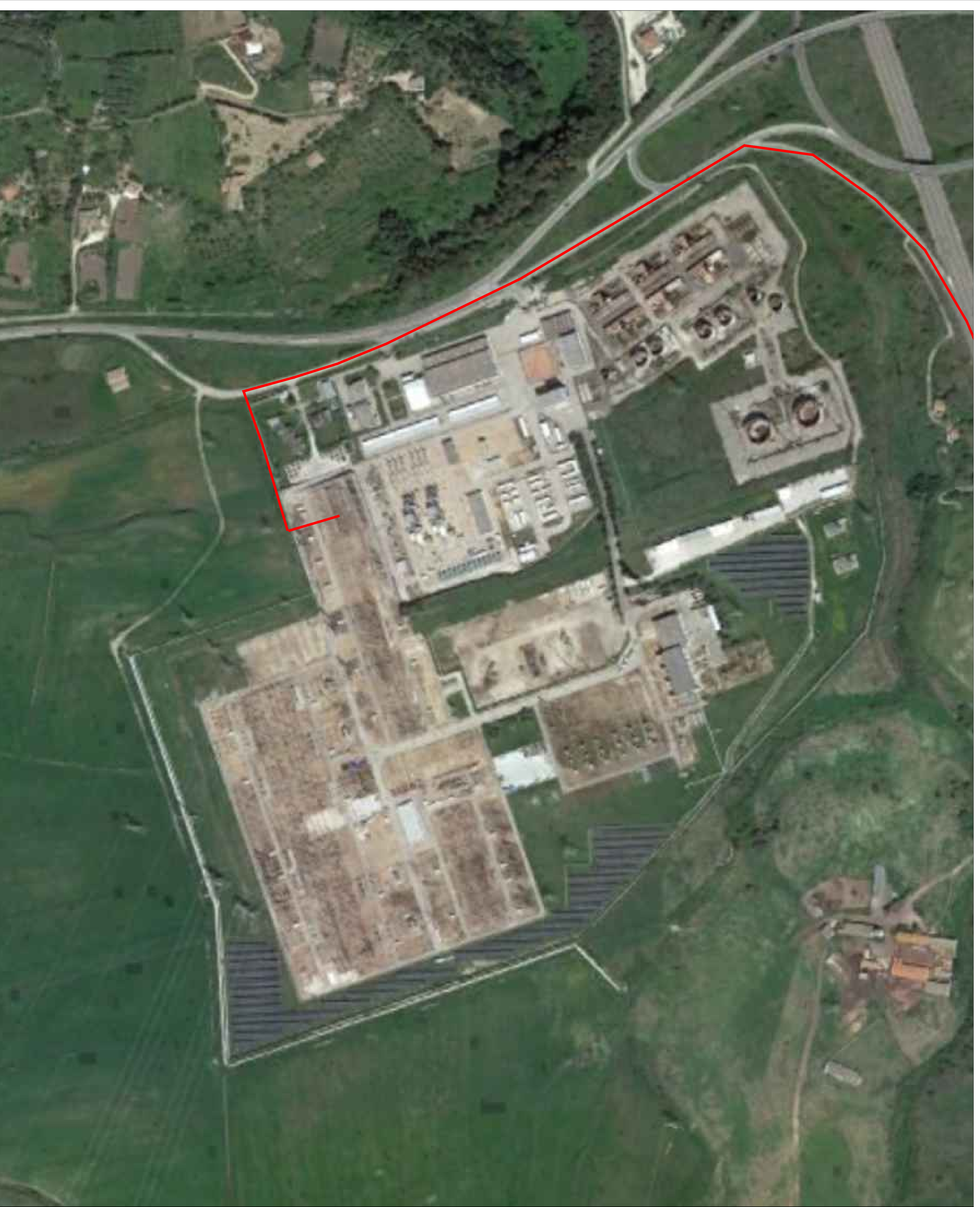
S.E. TERNA "CODROGIANOS - SU BASE ORTOFOTO SCALA 1:2.000