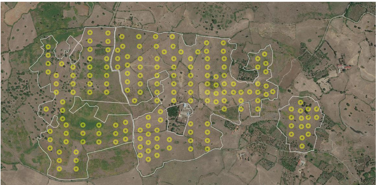
Figura 4. Stralcio Ortofoto – Punti di monitoraggio

Per una superficie dell'area d'impianto di circa 87,35 ettari, ne deriva che i punti da sottoporre ad indagine saranno 181.