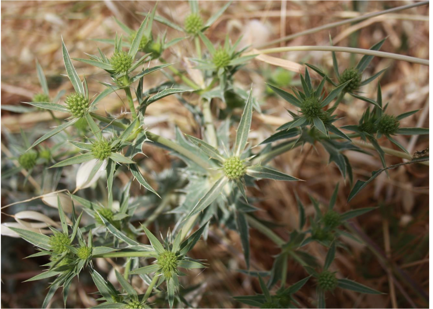
Figura 5: Eryngium campestre.