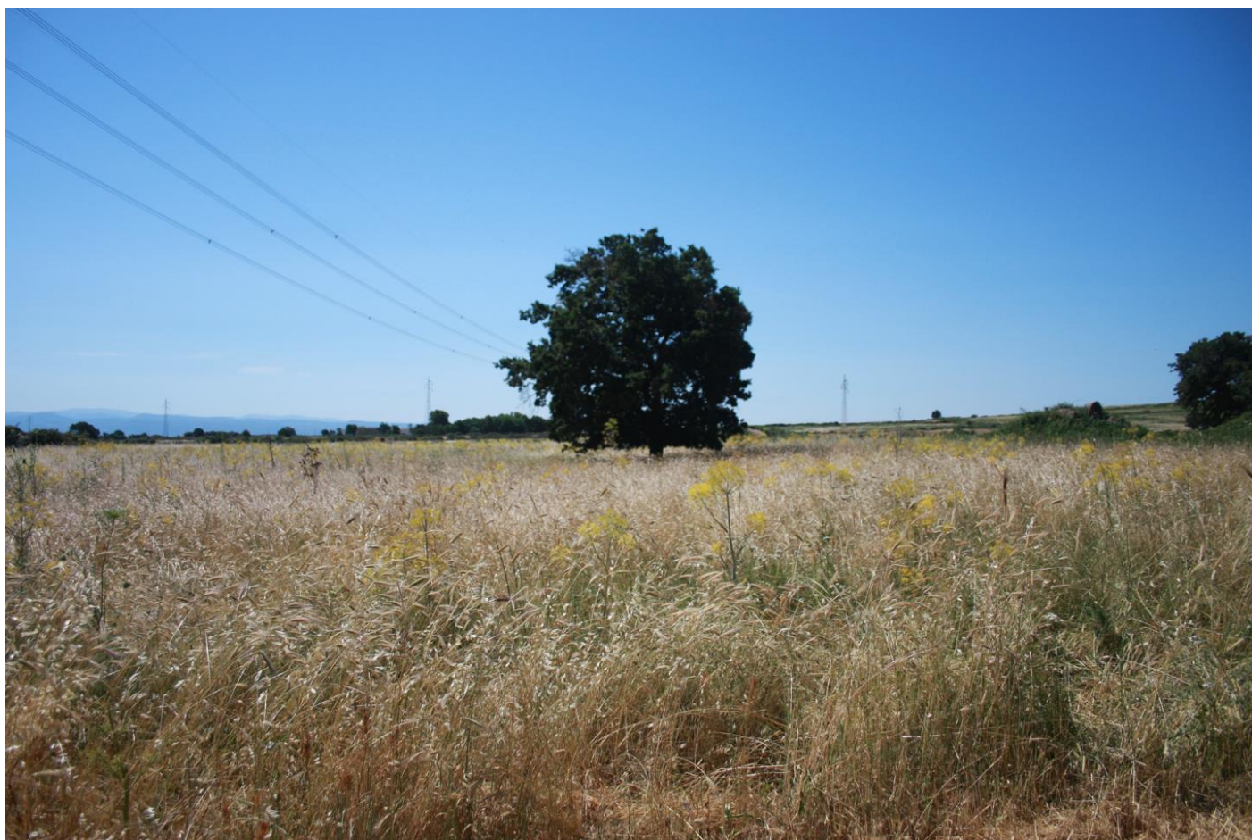
Figura 9: Vista dell'area oggetto di studio.