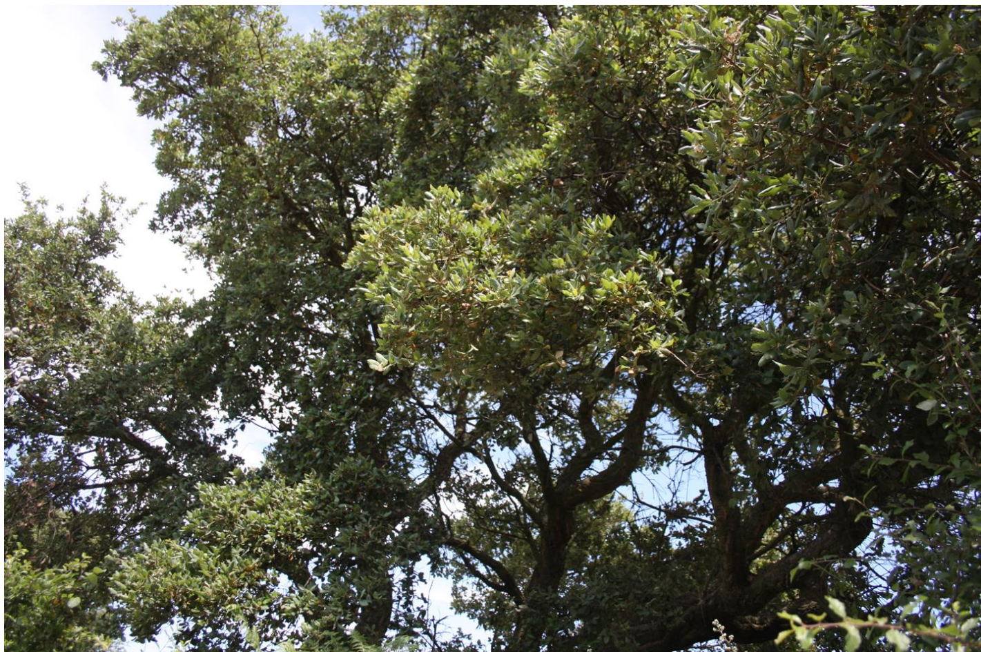
Figura 17: Quercus suber.