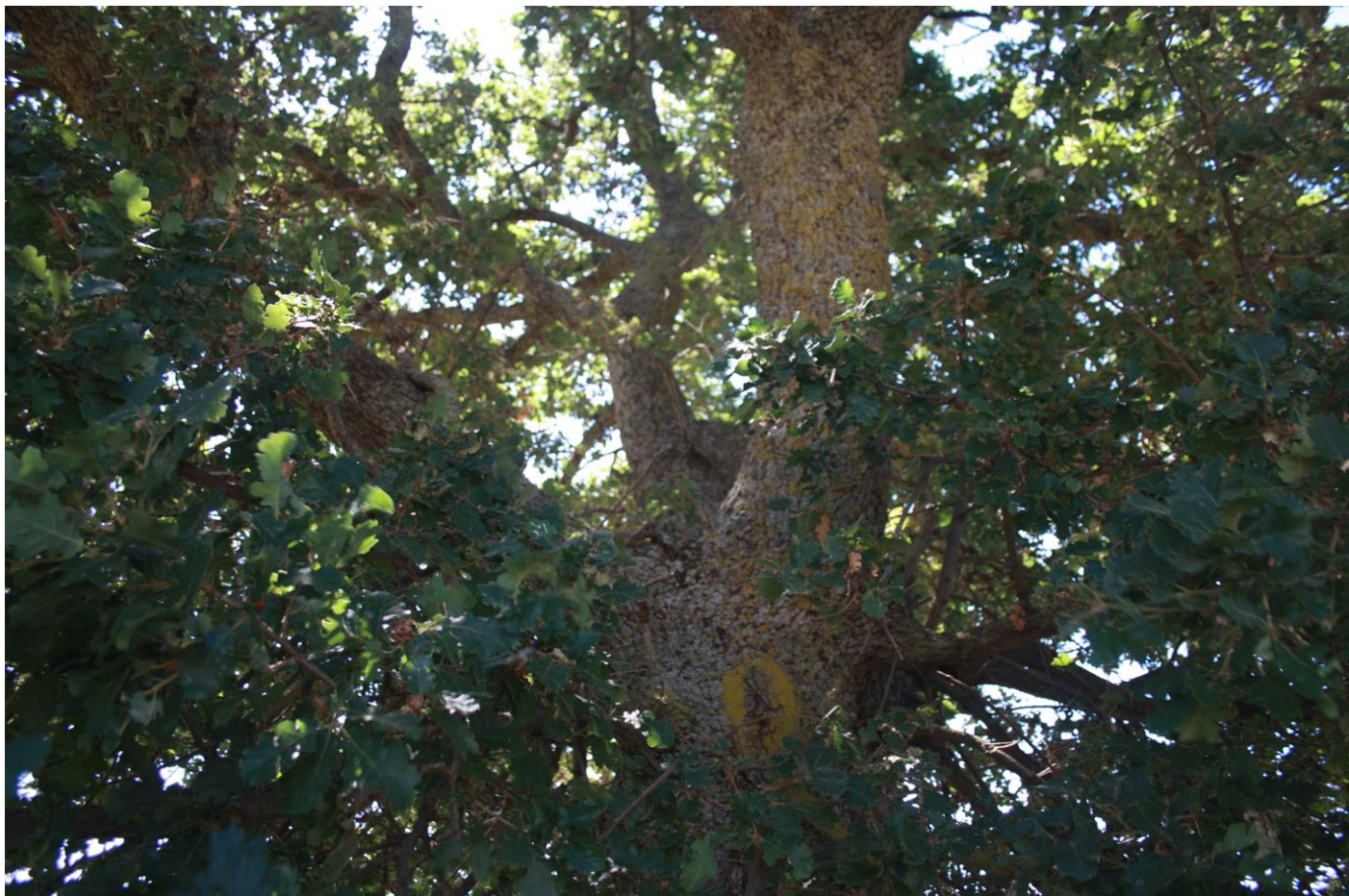
Figura 16: Quercus pubescens.