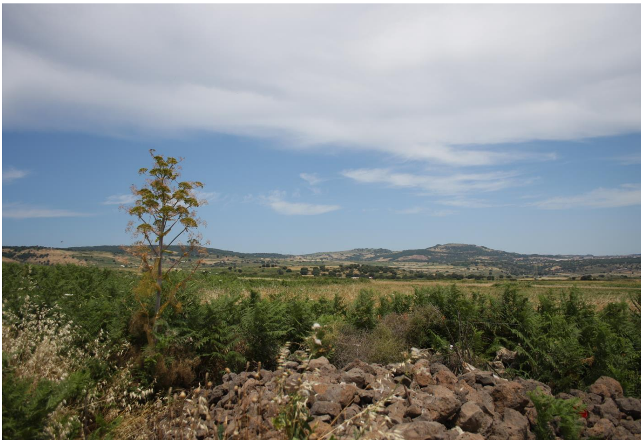
Figura 10: Visione di una parte dell'area di progetto.