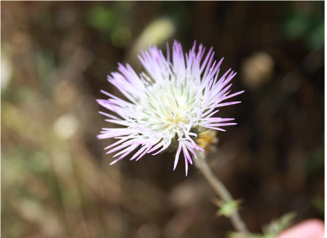
Figura 7: fiore di Galactites tomentosus .