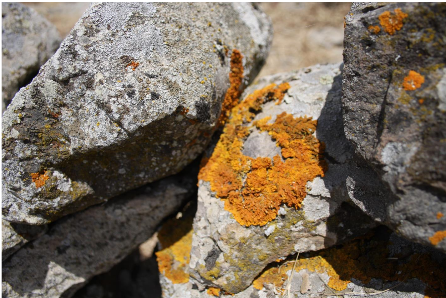
Figura 11: Licheni cresciuti su substrato roccioso.