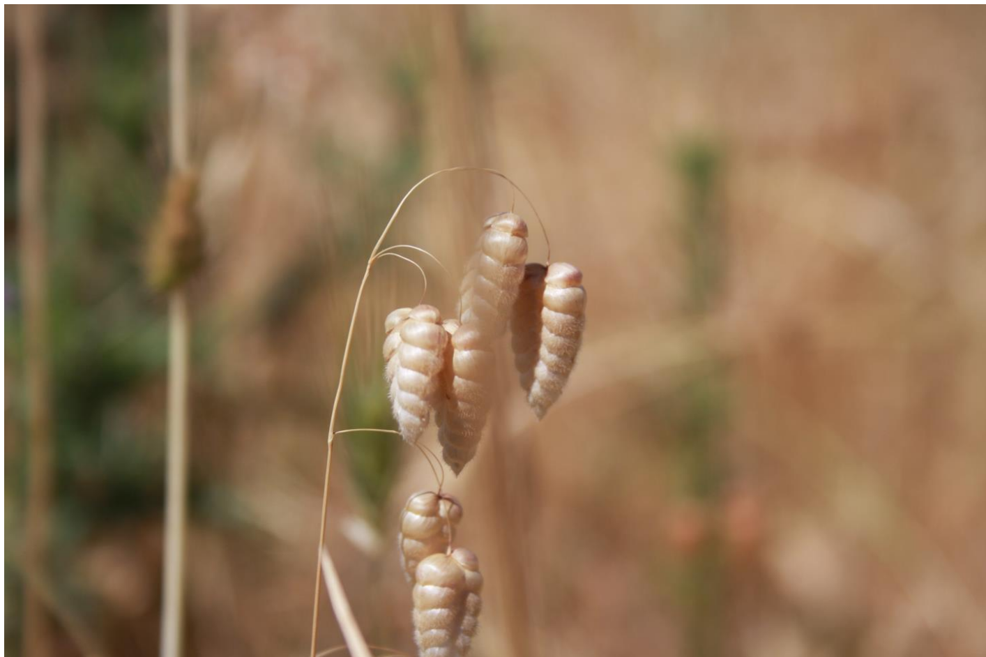
Figura 2: Briza maxima.