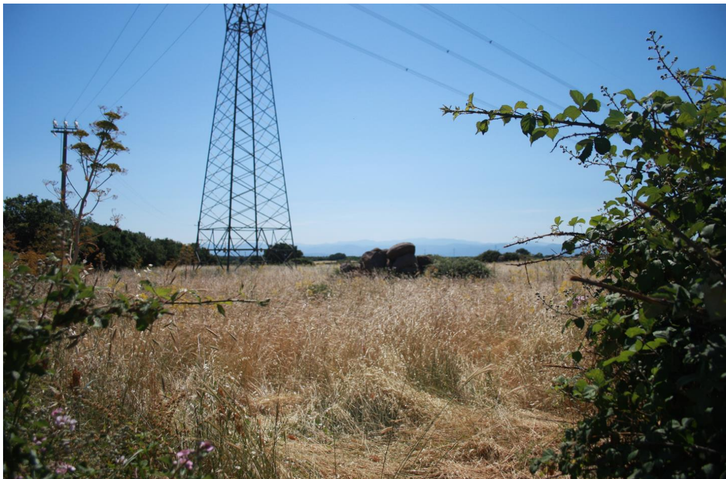
Figura 8: Visione di una delle aree di progetto.