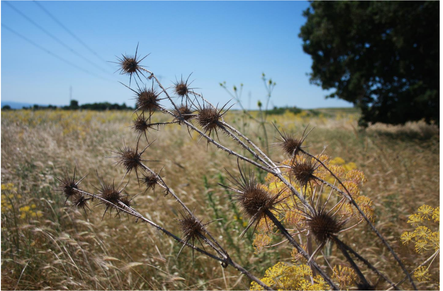
Figura 4: Dipsacus ferox.