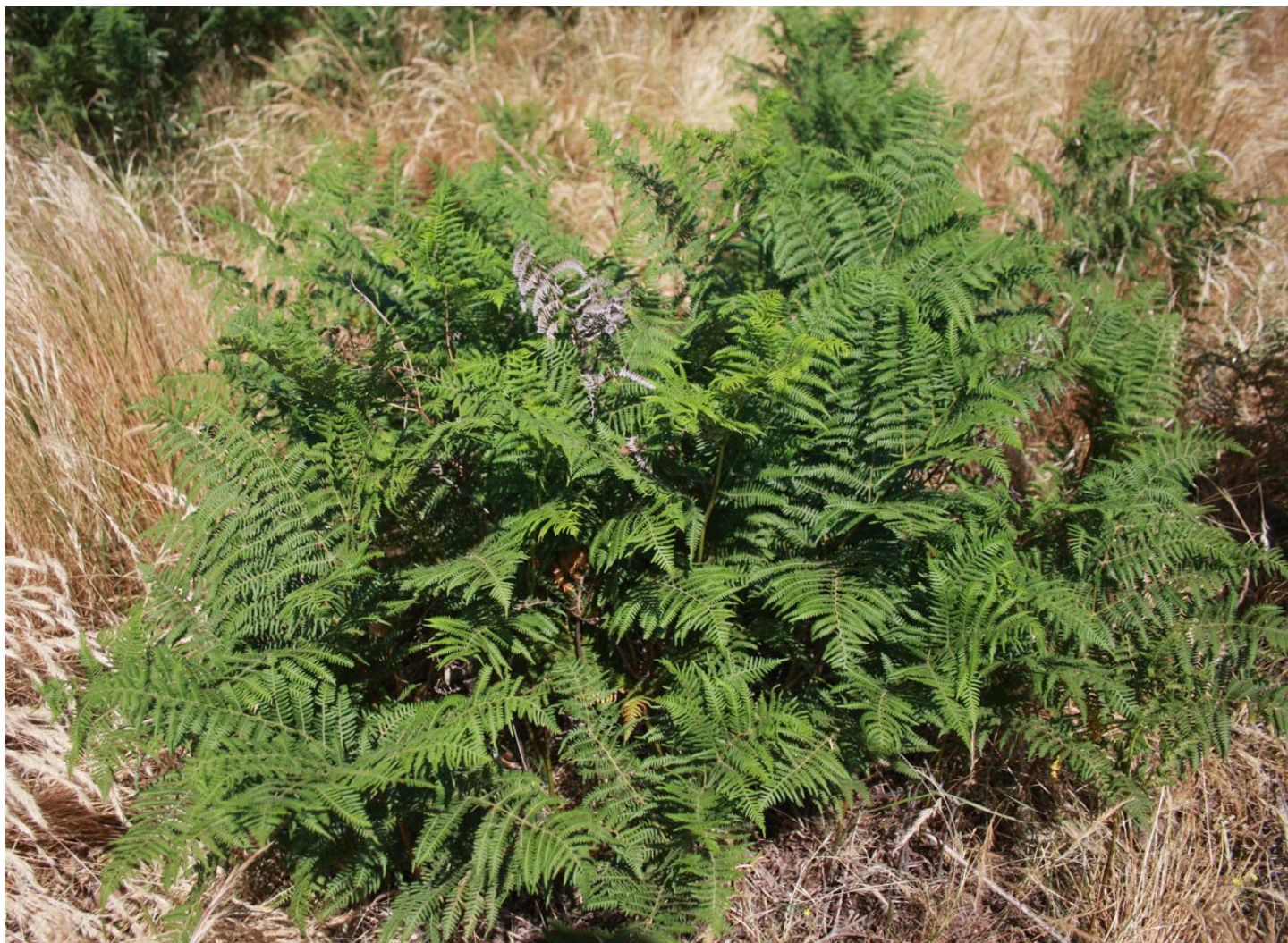
Figura 14: Pteridium aquilinum.