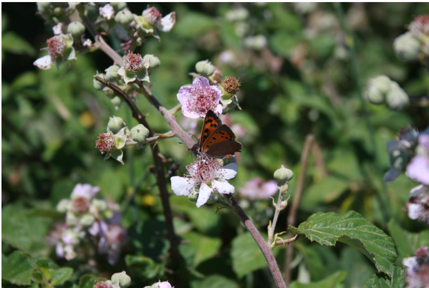
Figura 12: farfalla Lycaena phlaeas su fiori di Rubus ulmifolius .