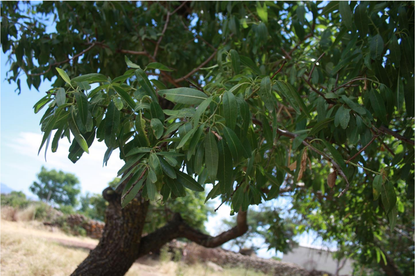
Figura 13: Albero di Prunus dulcis .