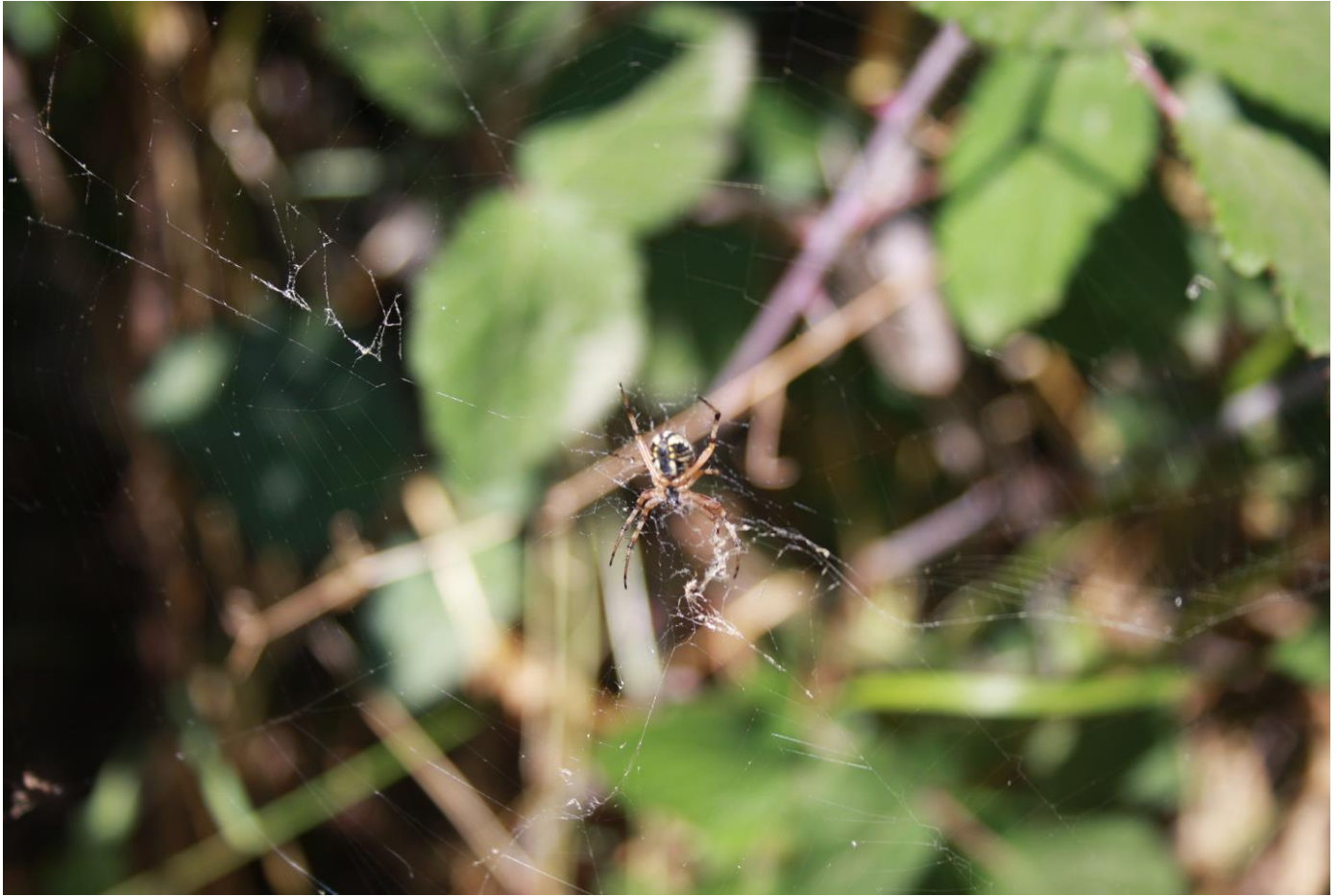
Figura 6: Organismo appartenente alla Famiglia Araneidae.