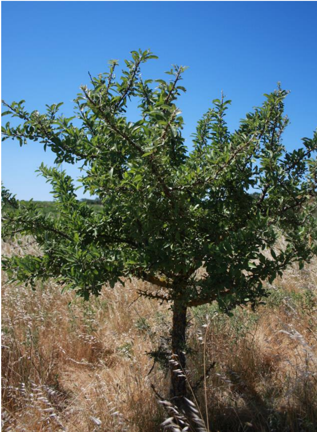
Figura 15: Pyrus spinosa.