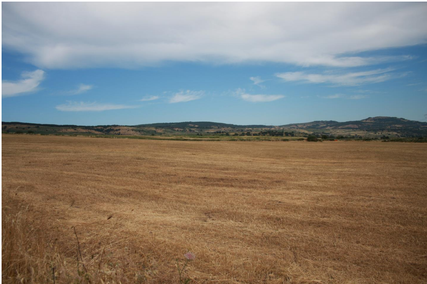
Figura 1: Vista dell'area oggetto di studio.