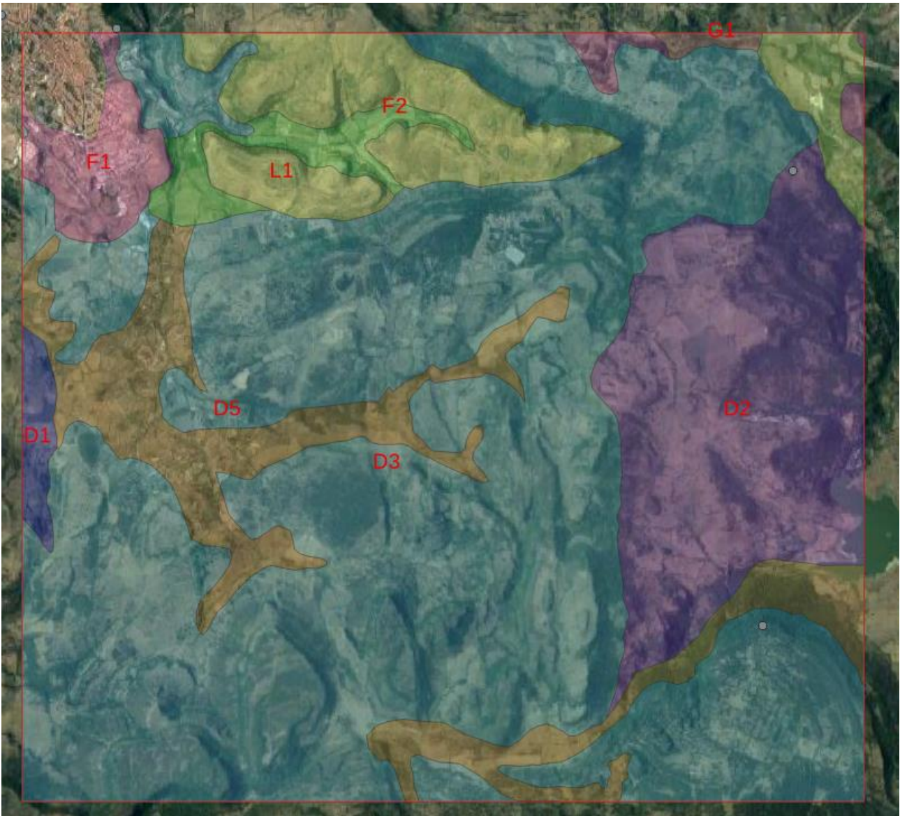
Figura 3 - Sono riportate le unità cartografiche