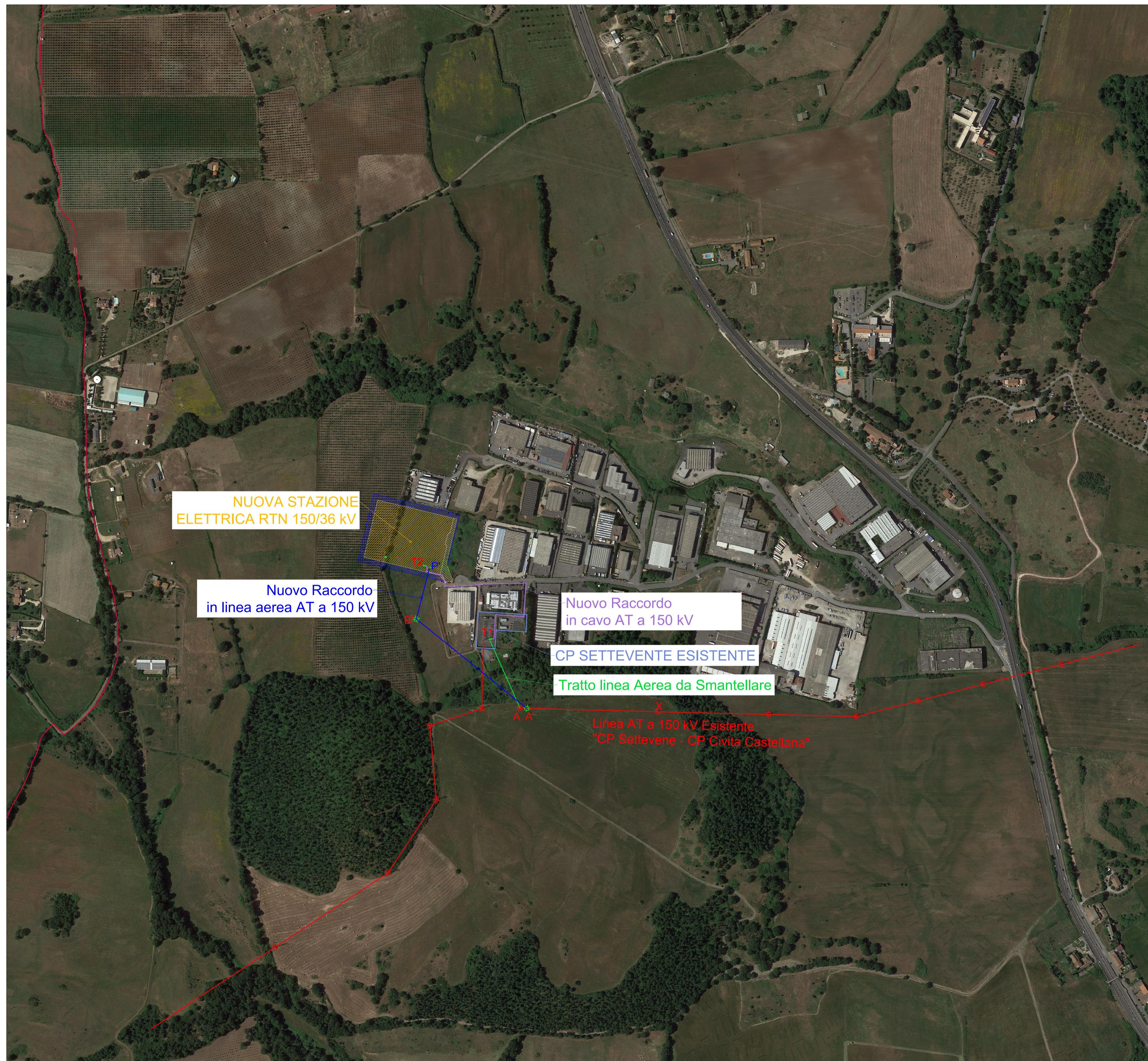
Inquadramento su CTR n. 364041 (Monterosi), 355162 (Lago di Monterosi), 365014 (Plan delle Rose), 356133 (Monte Corone)