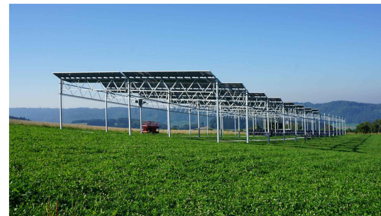
PARTICOLARE STRUTTURA DI SOSTEGNO DEI MODULI FOTOVOLTAICI (vista laterale)