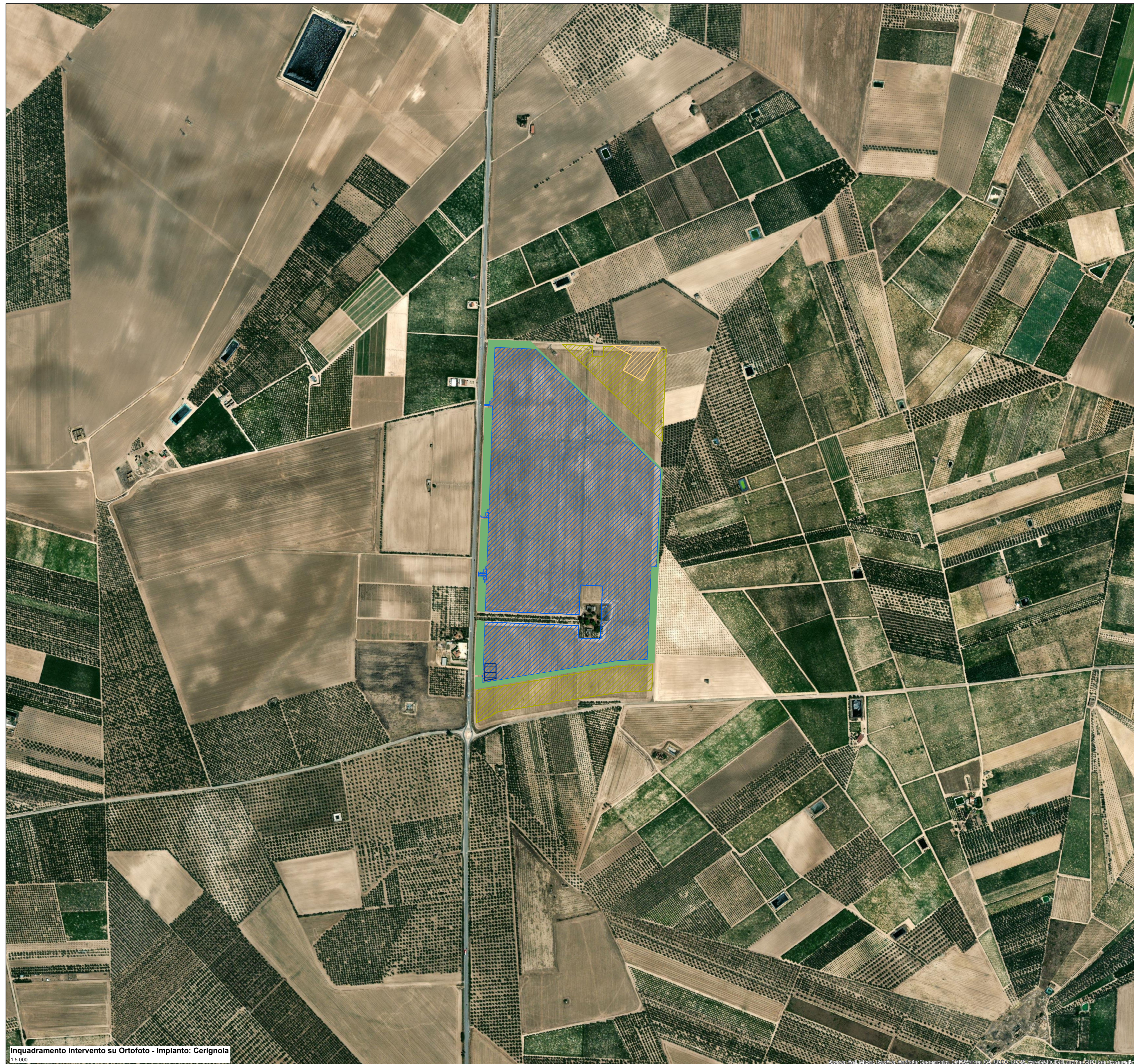
Inquadramento intervento su Ortofoto - Impianto: Cerignola 1:5.000