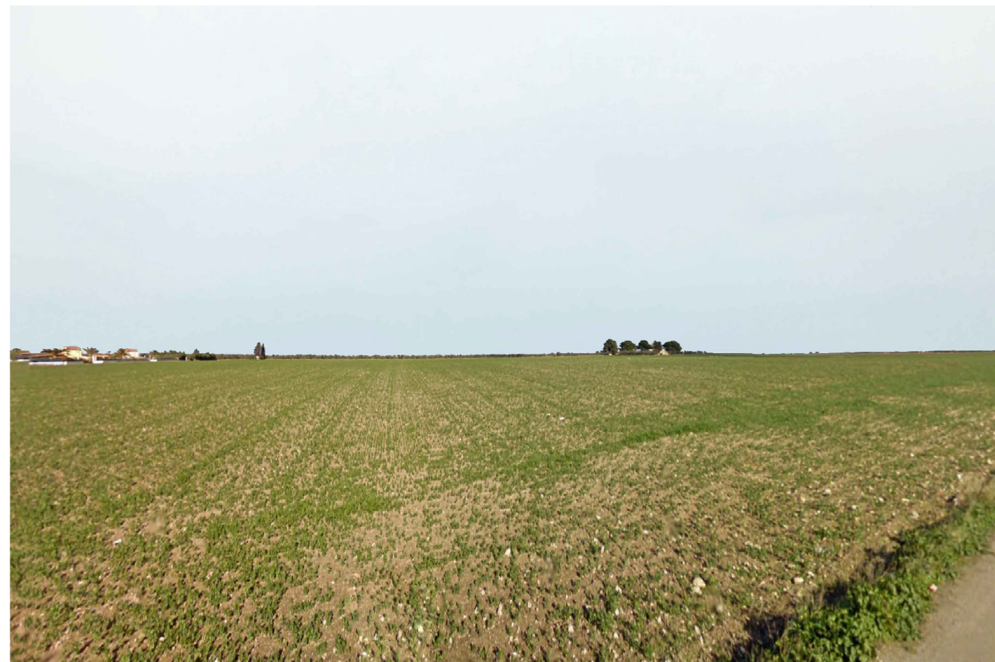
Cerignola. Inquadatura 2 - Stato di fatto.