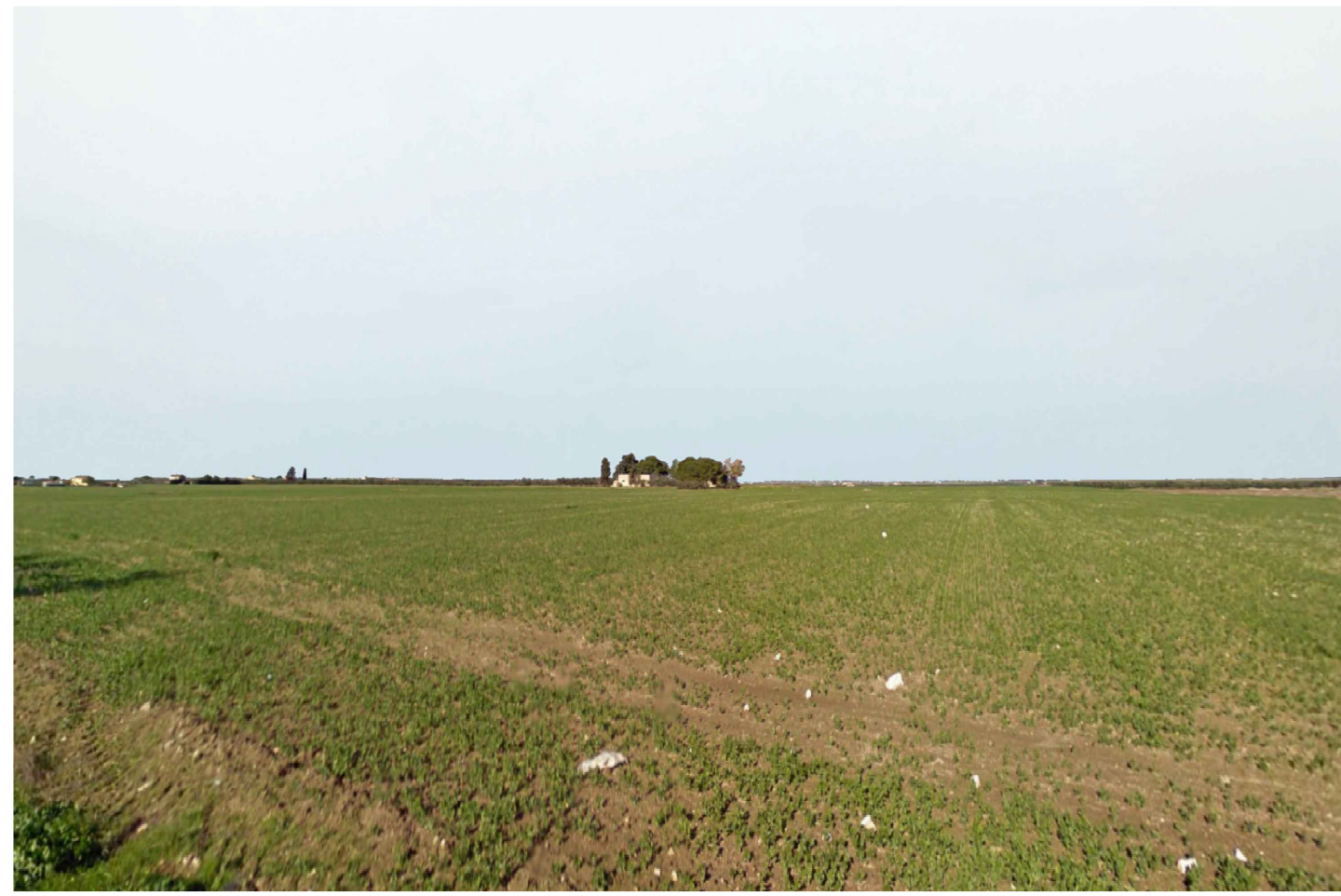
Cerignola. Inquadatura 1 - Stato di fatto.