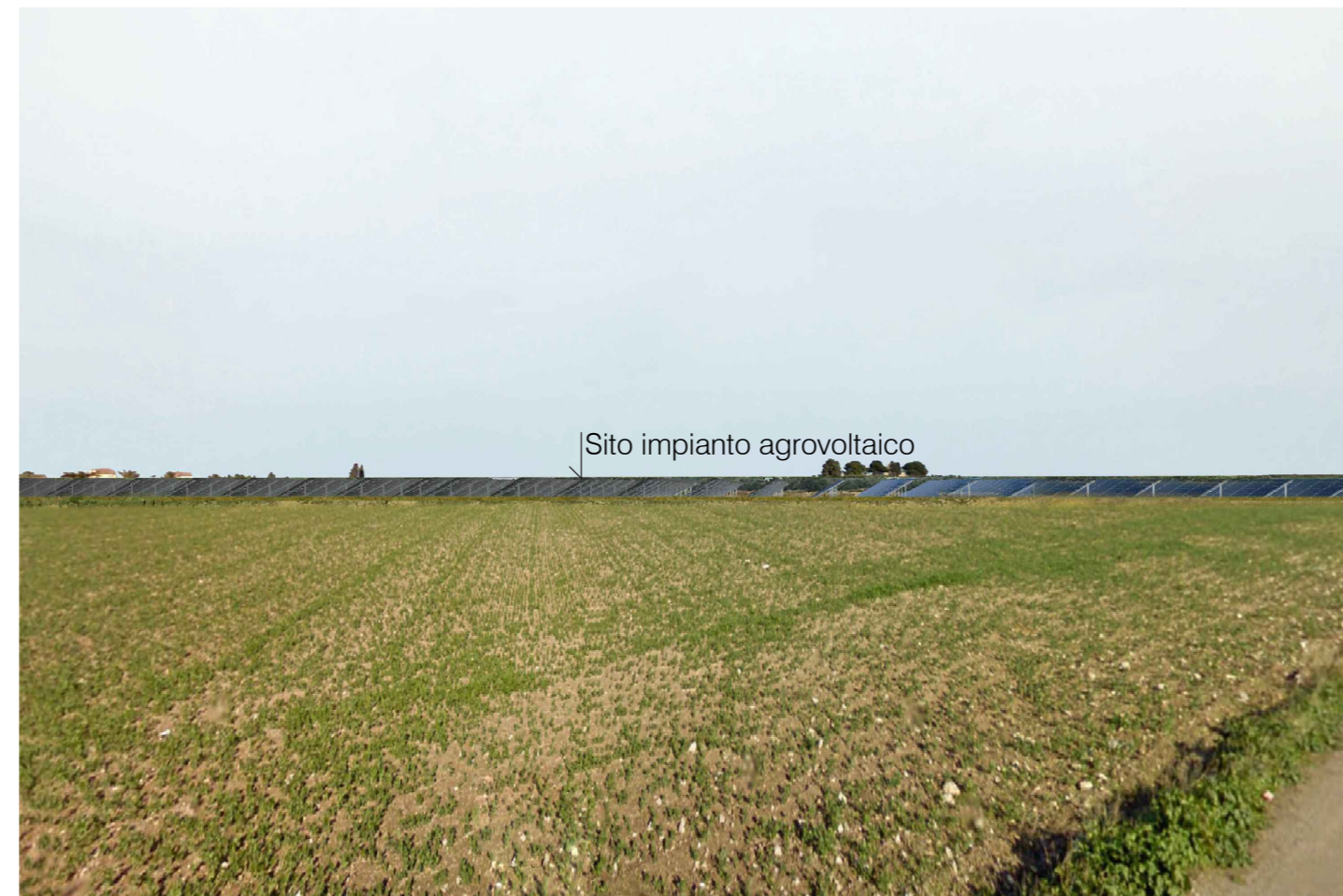
Cerignola. Inquadatura 2 - Stato di progetto. Vista impianto senza fascia di mitigazione e senza componente agricola esterna all'impianto.