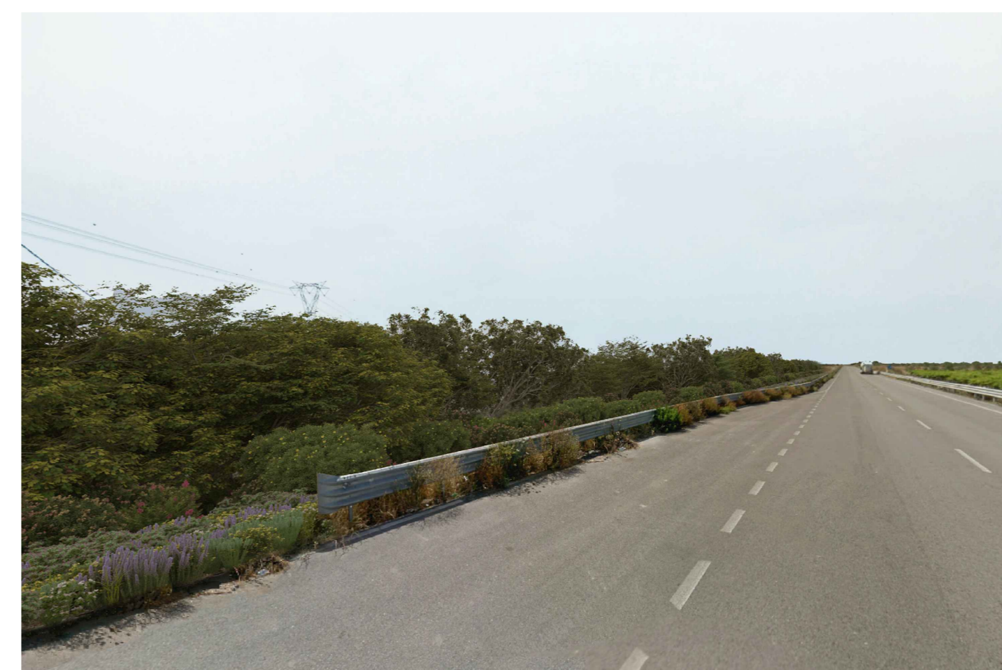
Cerignola. Inquadatura 6 - Stato di progetto. Vista impianto con fascia di mitigazione.