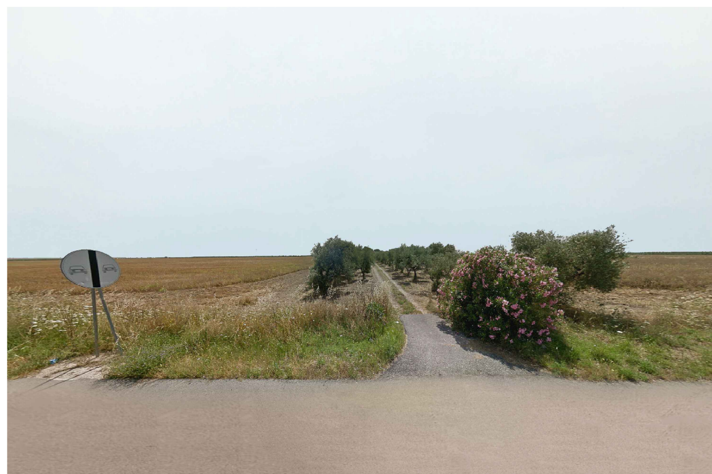
Cerignola. Inquadatura 4 - Stato di fatto.