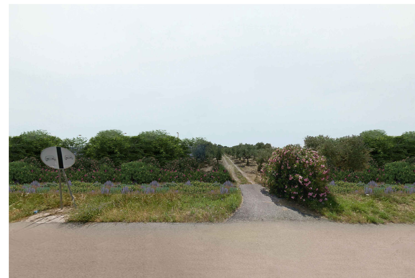
Cerignola. Inquadatura 4 - Stato di progetto. Vista impianto con fascia di mitigazione.