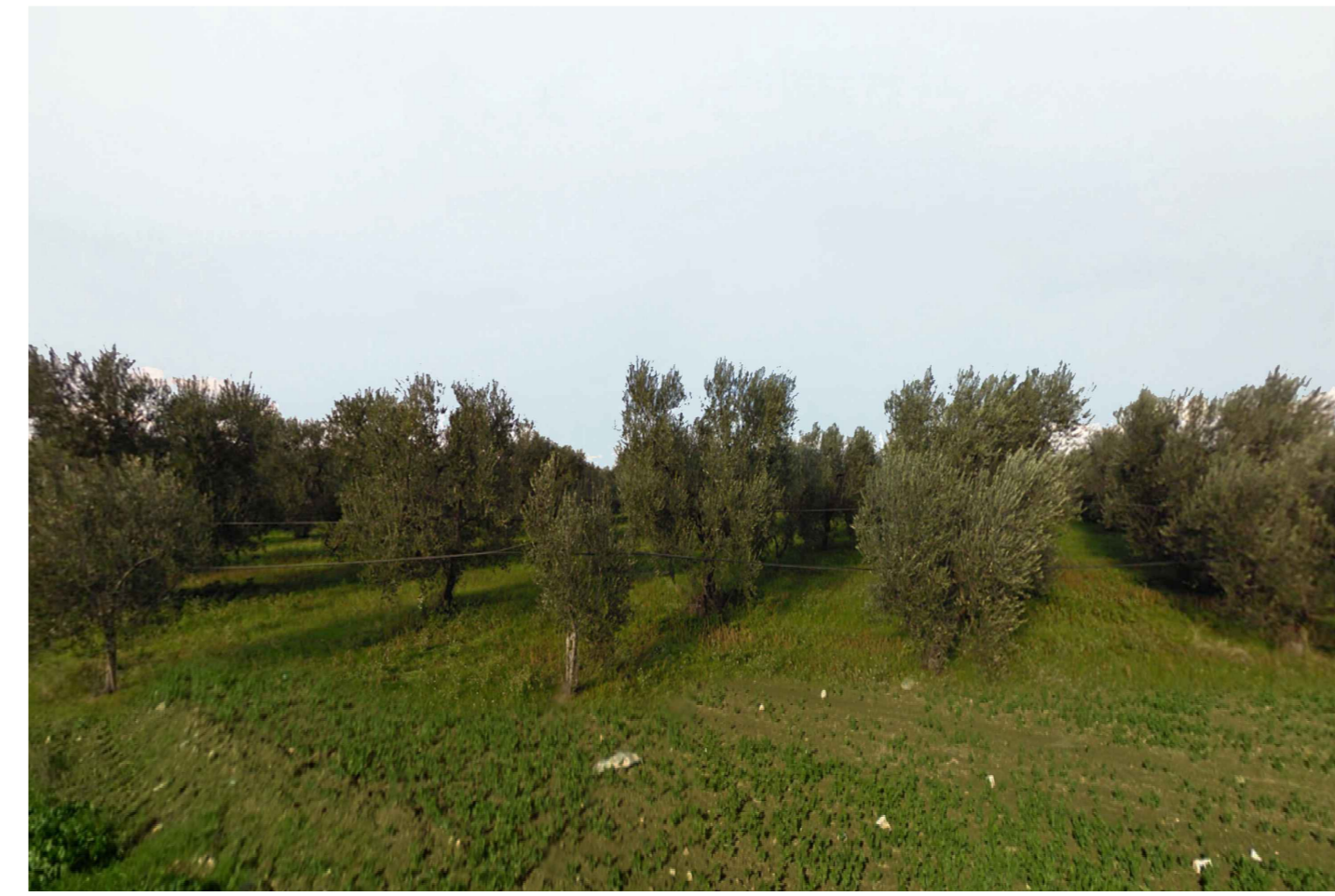
Cerignola. Inquadatura 1 - Stato di progetto. Vista impianto con fascia di mitigazione e con componente agricola esterna all'impianto.