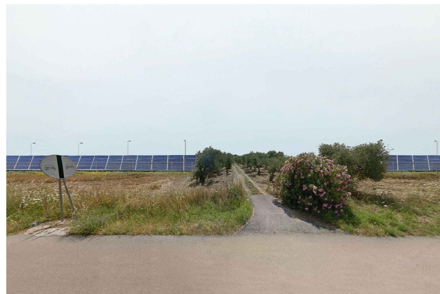
Cerignola. Inquadatura 4 - Stato di progetto. Vista impianto senza fascia di mitigazione.