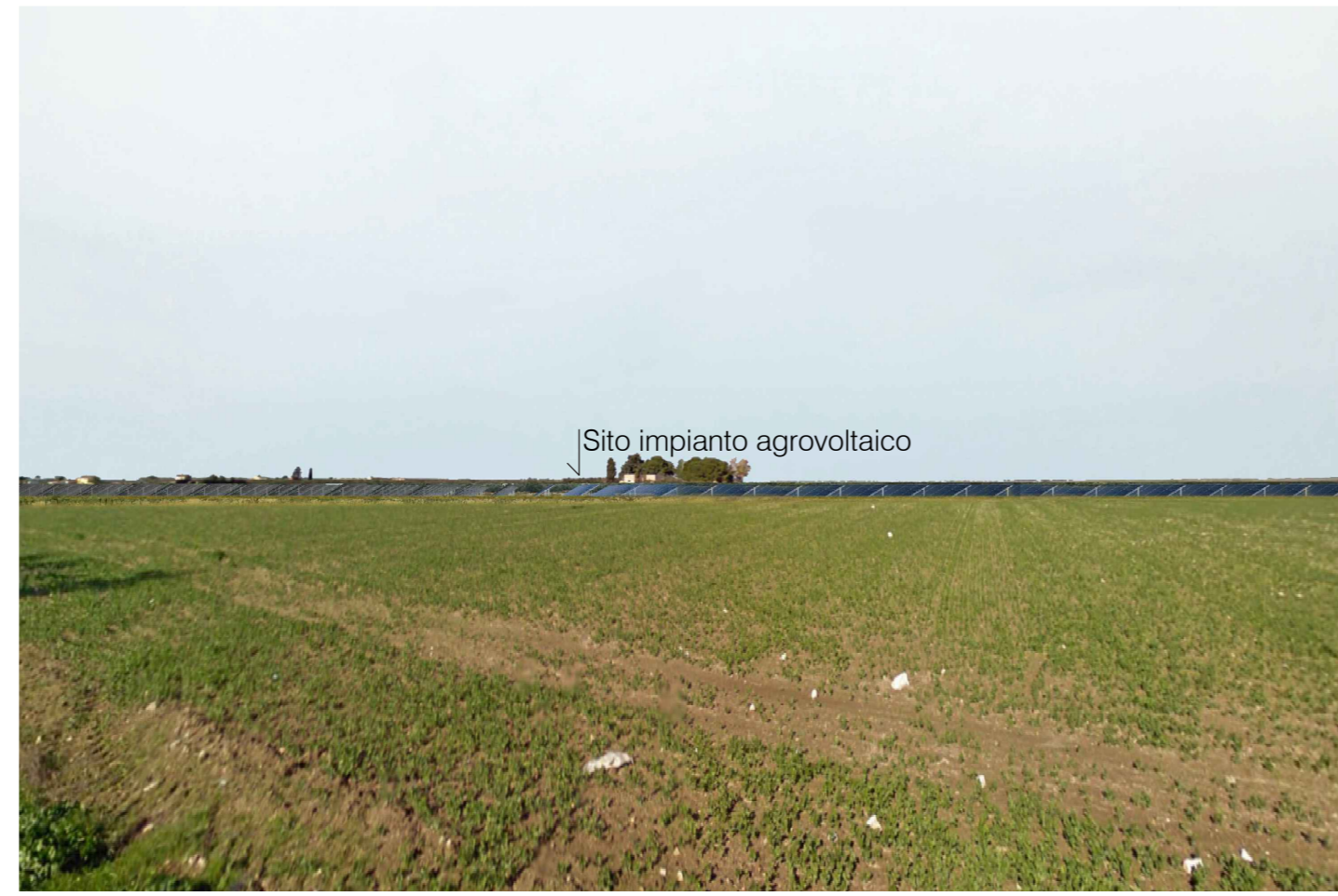
Cerignola. Inquadatura 1 - Stato di progetto. Vista impianto senza fascia di mitigazione e senza componente agricola esterna all'impianto.