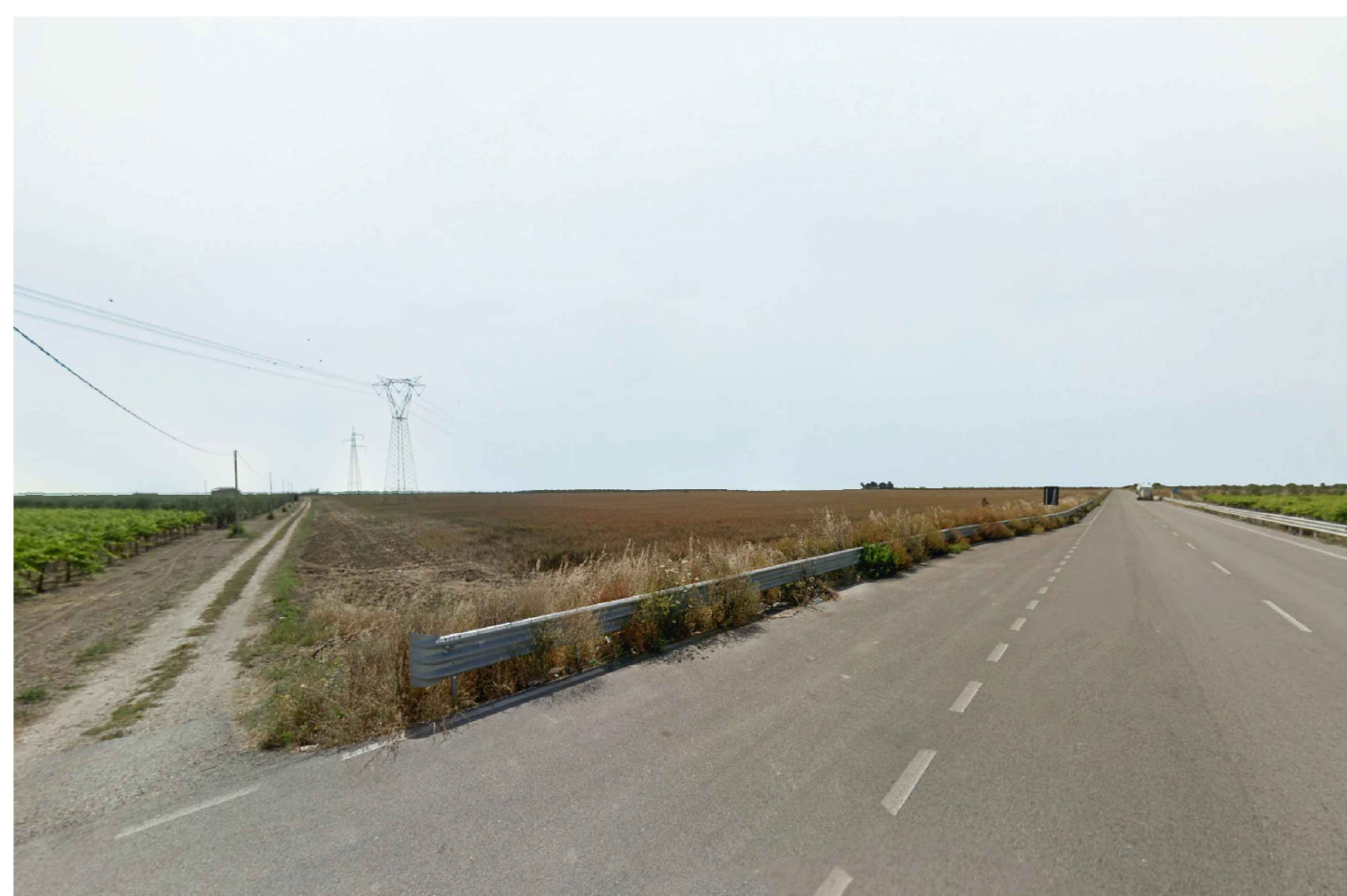
Cerignola. Inquadatura 6 - Stato di fatto.