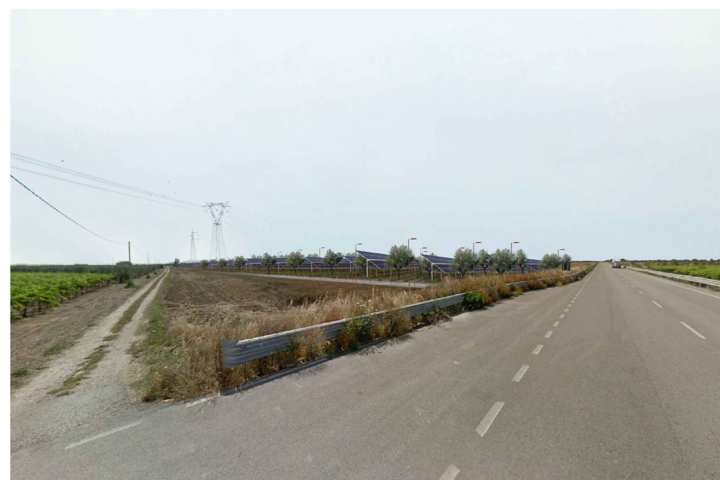
Cerignola. Inquadatura 6 - Stato di progetto. Vista impianto senza fascia di mitigazione.