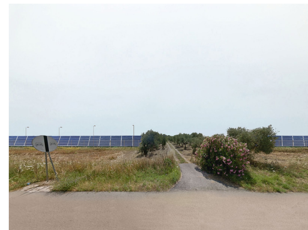
Fotoinserimento - senza fascia di mitigazione