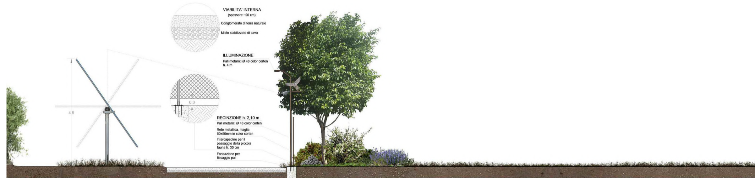
Sezione fascia di mitigazione da 5 mt

ASPARAGUS ACUTIFOLIUS CALICOTOME INFESTA CERATONIA SILIQUA DAPHNE GNIDIUM FICUS CARICA HEDERA HELIT PISTACIA LENTISCUS PYRUS SPINOSA QUERCUS ILEX