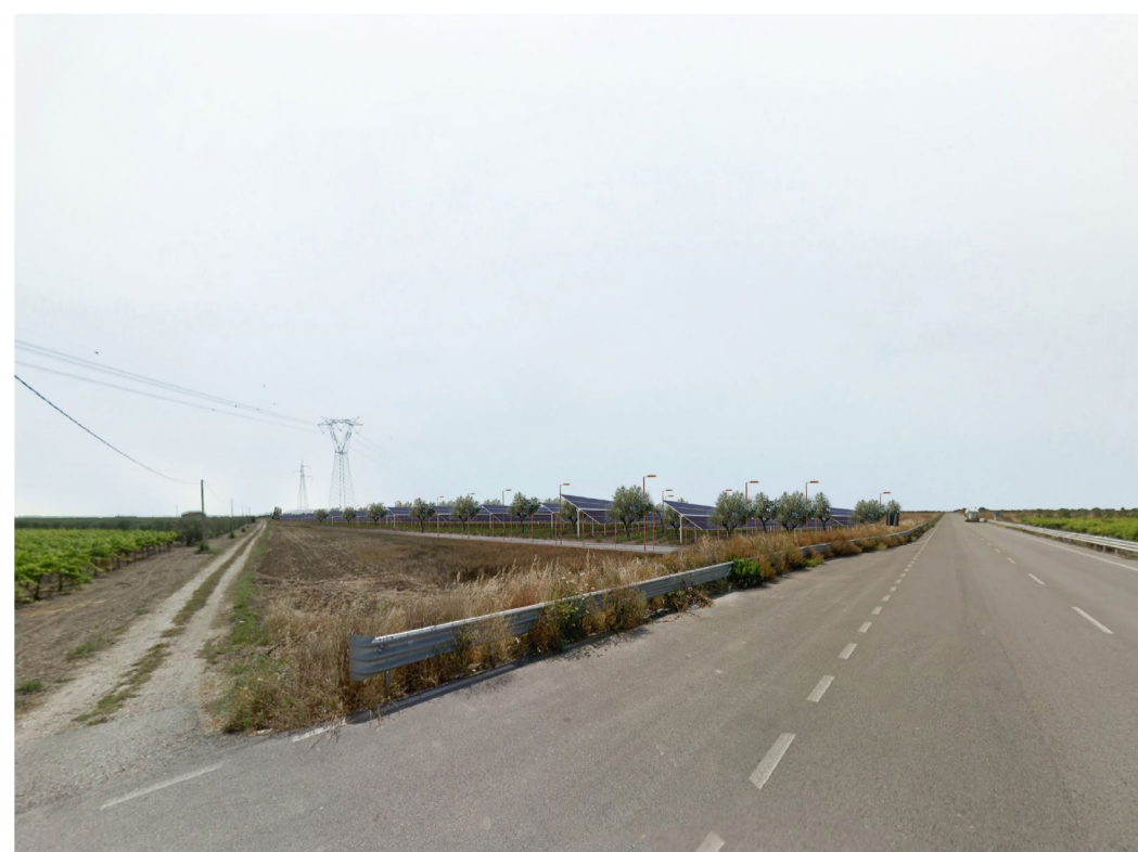
Fotoinserimento - senza fascia di mitigazione