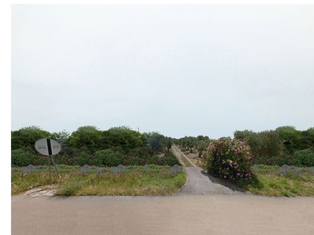
Fotoinserimento - con fascia di mitigazione di 20 m