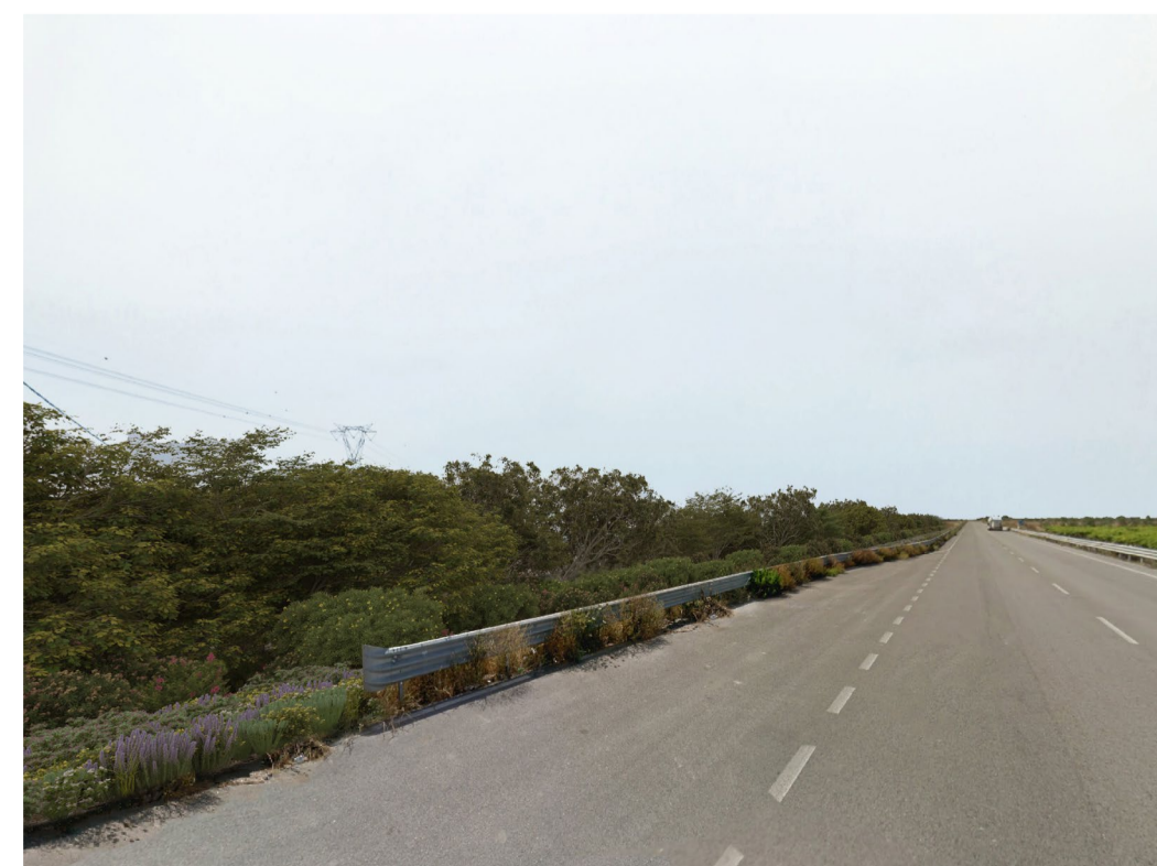
Fotoinserimento - con fascia di mitigazione di 20 m