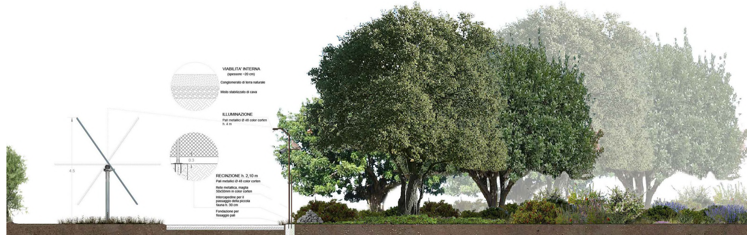
Sezione fascia di mitigazione da 20 mt

ASPARAGUS ACUTIFOLIUS CALICOTOME INFESTA CERATONIA SILIQUA CISTUS MONSPELIENSIS DAPHNE GNIDIUM FICUS CARICA HEDERA HELIT PISTACIA LENTISCUS PYRUS SPINOSA QUERCUS ILEX THYMUS CAPITATUS