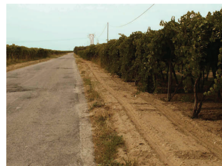
Sito: Regio trattarello Salpitello di Tonti-Trinitapoli Vista 1