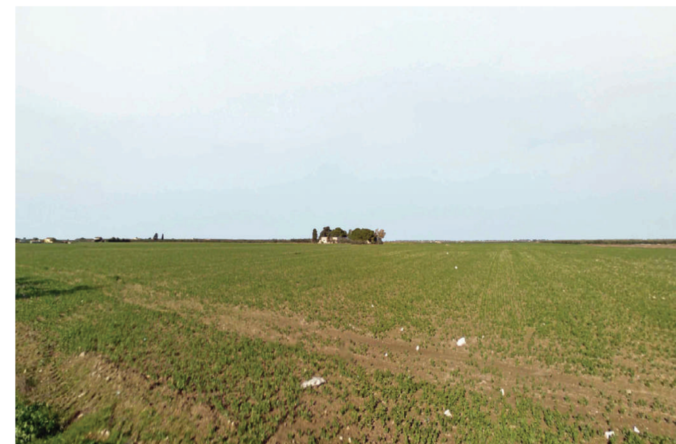
Sito: Regio trattarello Salpitello di Tonti-Trinitapoli. Stato di Fatto