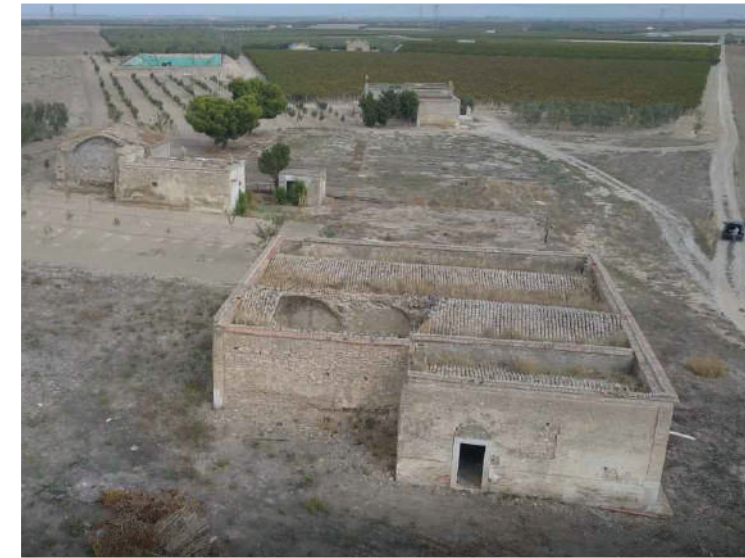
Sito: Masseria Posta dei Preti Vista 3