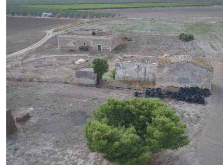
Sito: Masseria Posta dei Preti Vista 2