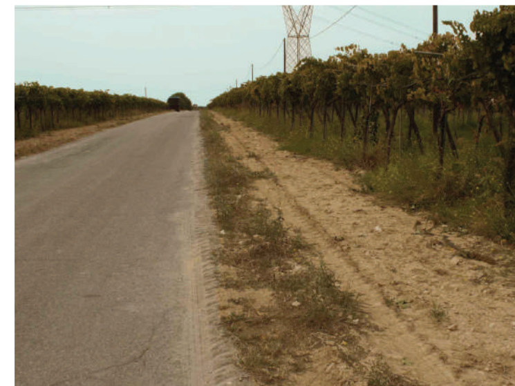
Sito: Regio trattarello Salpitello di Tonti-Trinitapoli Vista 2