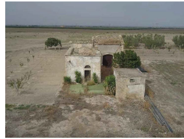
Sito: Masseria Posta dei Preti Vista 1