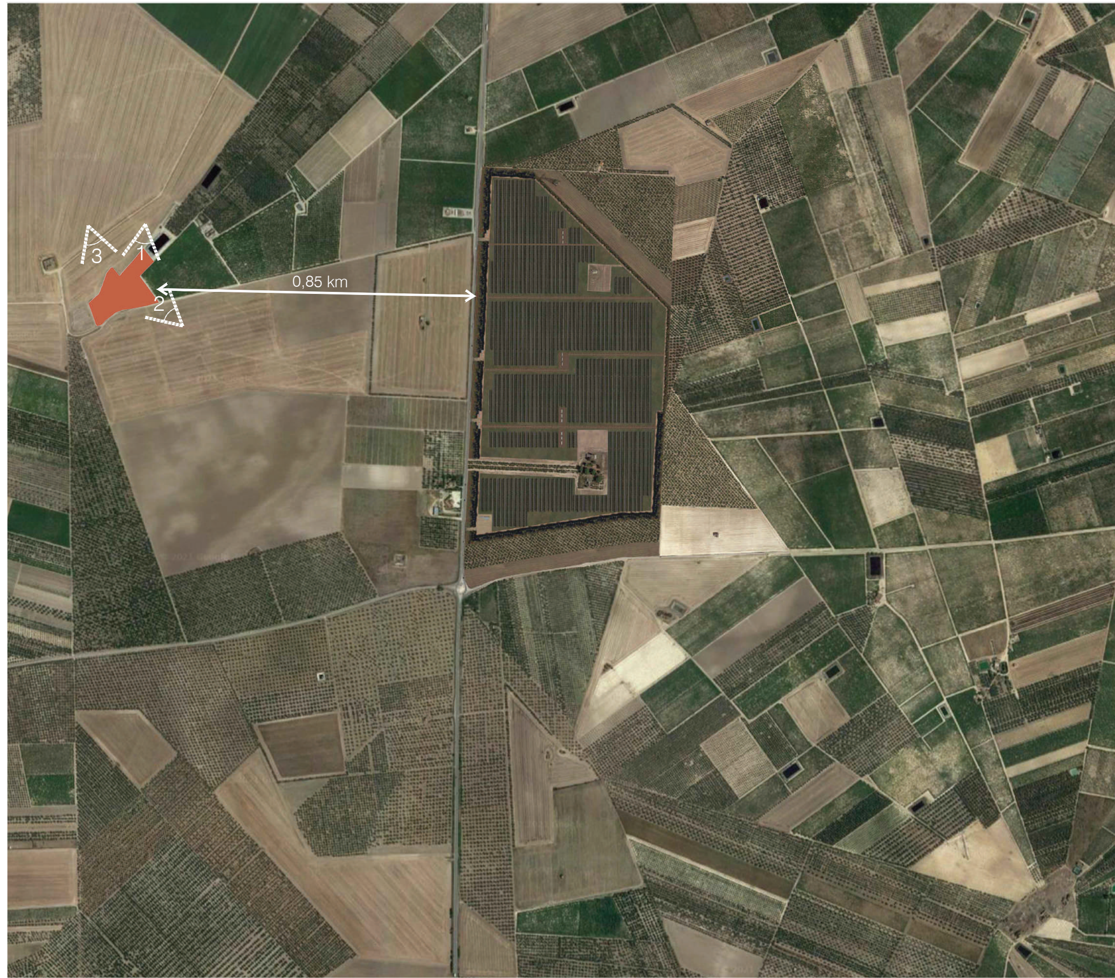
Ortofoto Masseria Posta dei Preti