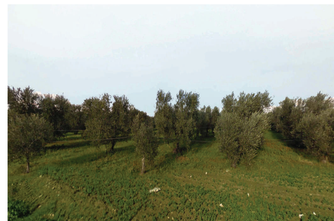
Sito: Regio trattarello Salpitello di Tonti-Trinitapoli. Stato di Progetto