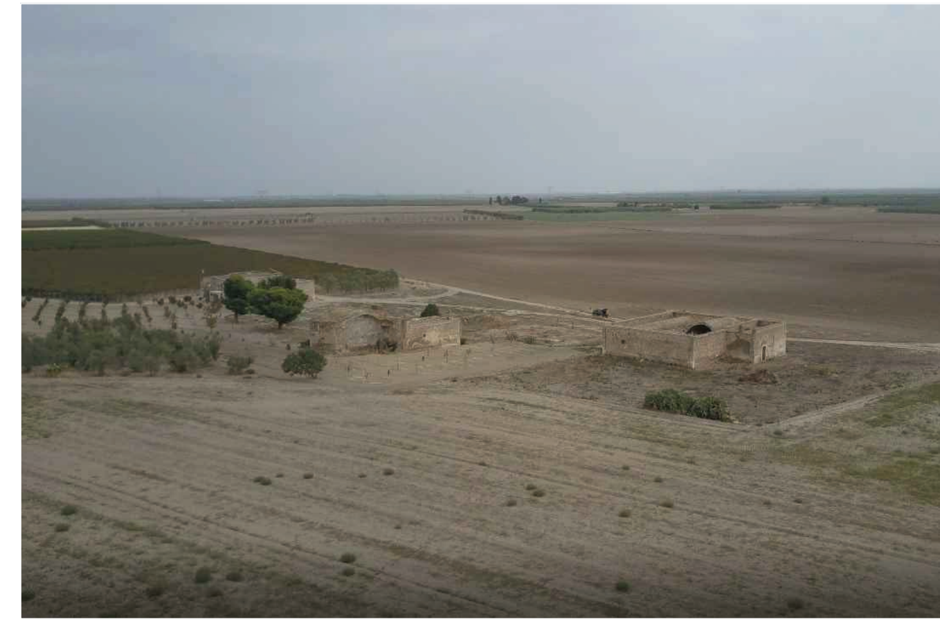
Sito: Masseria Posta dei Preti. Stato di Fatto