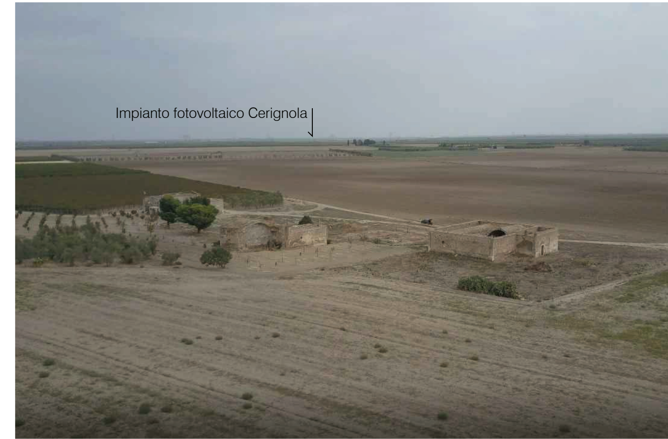
Sito: Masseria Posta dei Preti. Stato di Progetto