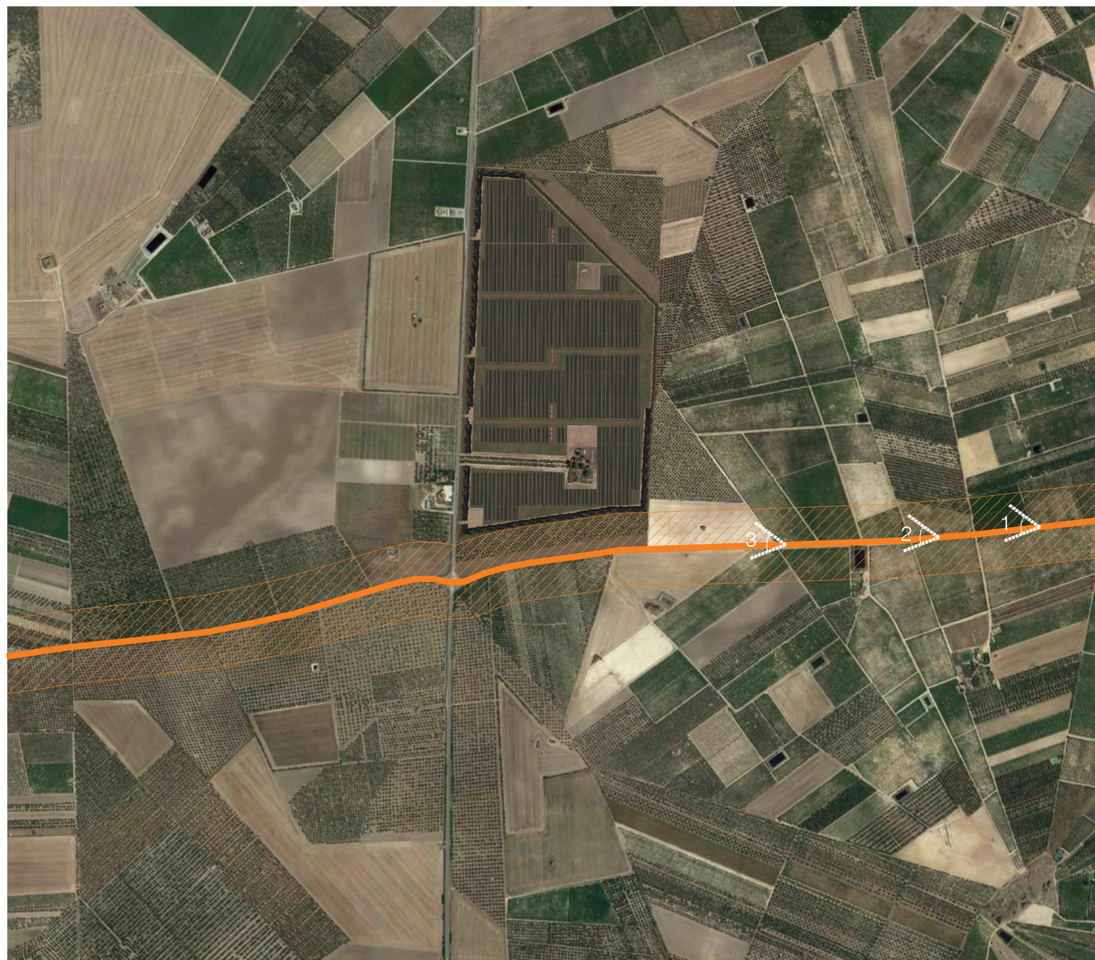
Ortofoto Regio trattarello Salpitello di Tonti-Trinitapoli