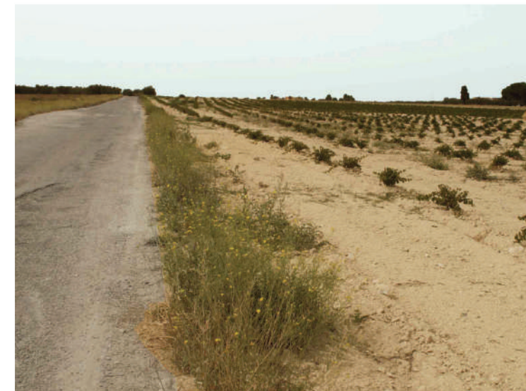
Sito: Regio trattarello Salpitello di Tonti-Trinitapoli Vista 3